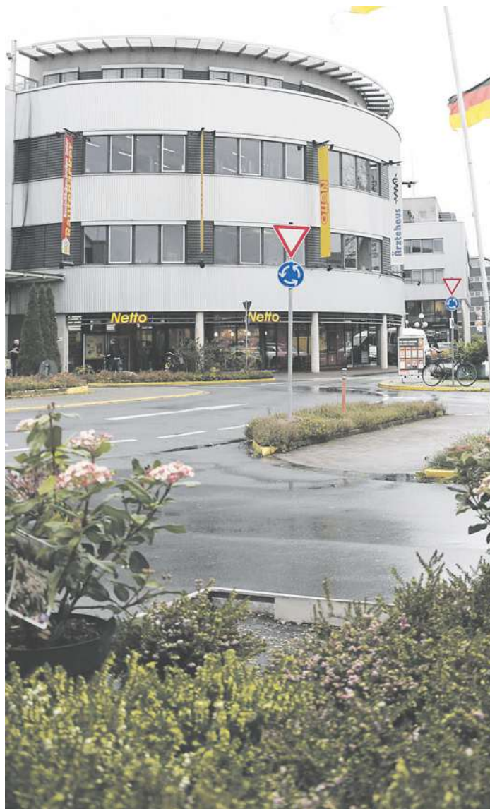
Das Ärztehaus im Centrum Kohake bietet in zahlreichen Praxen Expertinnen und Experten rund um das Thema Gesundheit, Vorsorge und Früherkennung.

Wie gut, dass man sich im Centrum Kohake beiden Aspekten mit großem Engagement widmet und deshalb allen Besuchenden sehr gute Möglichkeiten anbieten kann. Der Philosoph Arthur Schopenhauer brachte die existentielle Bedeutung von Gesundheit sehr schön auf den Punkt. Sein Spruch: »Gesundheit ist nicht alles – aber ohne Gesundheit ist alles nichts«, wird bis heute gerne zitiert und bleibt aktuell. Wie gut, dass es mit dem Ärztehaus im Centrum Kohake zahlreiche, kompetente Ansprechpartnerinnen und -partner gibt, die Experten in ihrem medizinischen Bereich sind. Sie bieten ihren Patientinnen und Patienten rund um Beratung, Vorsorge und Früherkennung zahlreiche Möglichkeiten, um die Gesundheit zu stabilisieren und zu stärken. Im Falle einer Erkrankung ist auf die Ärztinnen und Ärzte im Ärztehaus des Centrum Kohake ebenfalls voller Verlass. Idealerweise ist es natürlich, einer Erkrankung vorbeugen zu können. Da kommt beispielsweise der Kneipp-Verein ins Spiel. Zahlreiche Angebote, zu denen Nordic Walking, Yoga und weitere moderate Bewegungs-Aktionen zählen, unterstützen die Kreislaufstärkung und die Immunabwehr. Ernährungsberatung ist