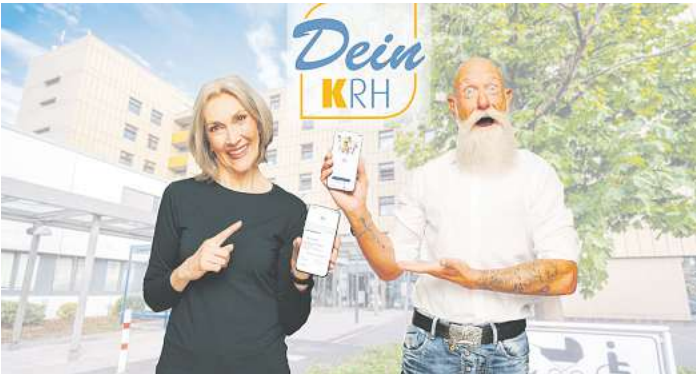
„Dein KRH“ ist ab sofort im Apple App Store und bei Google Play verfügbar.

REGION. Das KRH Klinikum Region Hannover macht einen entscheidenden Schritt zur Digitalisierung seines Leistungsangebots: Mit dem Start des Patientenportals „Dein KRH“ bietet das KRH einen digitalen Zugang für Patientinnen und Patienten, die so per App Sprechstundentermine anfragen und buchen sowie alle erforderlichen Dokumente, wie beispielsweise Überweisungen oder Befunde, direkt hochladen können. Begleitend dazu finden sich auf „Dein KRH“ auch alle Informationen rund um den jeweiligen Termin: von Fragebögen und Checklisten über Vertragsdokumente bis hin zu Erläuterungen und Videos zu der bevorstehenden Untersuchung oder Behandlung. „Wir bieten mit ‚Dein KRH‘ eine zeitgemäße, moderne Möglichkeit zur mobilen, rund um die Uhr verfügbaren Kommunikation und bieten unseren Patientinnen und Patienten damit einen echten Mehrwert und eine deutliche Erleichterung bei der Organisation und Vorbereitung Ihres Aufenthalts bei