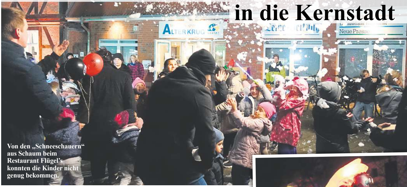
Von den „Schneeschauern“ aus Schaum beim Restaurant Flügel konnten die Kinder nicht genug bekommen.

auf einem Barhocker thronte und zur Gitarre Rock- und Pop-Songs zum Besten gab.