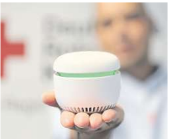
Grünes Licht für gute Luft: Das neue Gerät im Rotkreuz-Hausnotruf zeigt durch die Farbe des Lichtes die Luftqualität im Raum an.

REGION. Modern, dezent und intuitiv: Der Hausnotruf des Roten Kreuzes in der Region Hannover erweitert sein Angebot um ein neues Gerät. „CARU care“ ähnelt in der simplen Bedienung den gängigen Smart-Home-Systemen und erinnert optisch eher an einen modernen Bluetooth-Lautsprecher als an einen klassischen Hausnotrufknopf. Mittels einfachem Sprachbefehl können Notrufe abgesetzt werden, ein zugehöriger Sensor kann außerdem Stürze registrieren und ebenfalls direkt den Notruf auslösen. Darüber hinaus können Kund*innen Erinnerungen fürs regelmäßige Trinken einstellen und eine CO2-Ampel meldet, wann es Zeit zum Lüften ist. So werden sie diskret zur Flüssigkeitsaufnahme und zur Verbesserung der Luftqualität animiert. „Mit dieser Ergänzung zu unserem bisherigen Angebot möchten wir unseren Kundinnen und Kunden mehr Sicherheit und Komfort in ihrem Zuhause bieten“, so Torsten Loeffler vom Hausnotruf des Roten Kreuzes in der Region Hannover. „Wir möch-