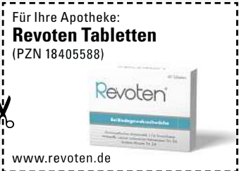
Abbildung Betroffenen nachempfunden. REVOTEN. Wirkstoffe: Acidum silicium Tit. D4, Calcium carbonicum Hahnenamti Tit. D4. Die Anwendungsgebiete entsprechen den homöopathischen Arzneimittelbildern. Dazu gehört: Bindegewebsschwäche. www.revoten.de • Zu Risiken und Nebenwirkungen lesen Sie die Packungsbeilage und fragen Sie Ihre Ärztin, Ihren Arzt oder in Ihrer Apotheke. • Remitan GmbH, 82166 Gräfelfing

Oft stehen wir Frauen vor einem scheinbar unlösbaren Problem: Wie werde ich die schlaaffe Haut, die lästigen Dellen und Falten los? Diese unschönen Erscheinungen entstehen durch ein schwaches Bindegewebe, also von innen. Wissenschaftlern ist es gelungen, ein Arzneimittel mit einem dualen Wirkstoffkomplex zu entwickeln (Revoten Tabletten, rezeptfrei, Apotheke), der von innen wirkt! Die zwei enthaltenen natürlichen Arzneistoffe dienen laut den Ergebnissen der Arzneiprüfungen und der Pharmakologie als Anregungs- sowie Heilmittel für die nachlassenden Stoffwechselvorgänge im Bindegewebe. So können unschöne Anzeichen von Bindegewebsschwäche wie schlaaffe Haut und Cellulite natürlich von innen bekämpft werden.