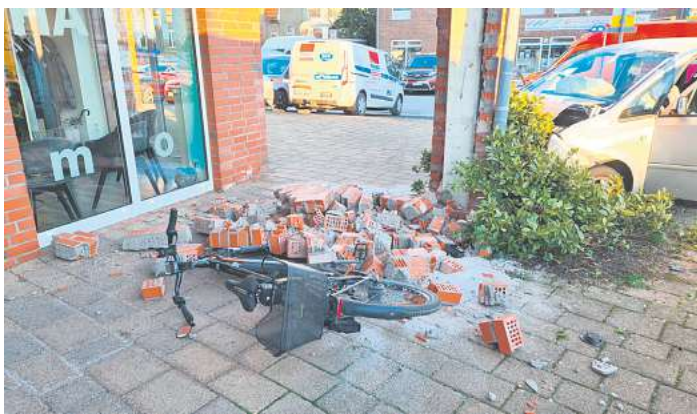
Die Säule einer Steinarkade wurde von dem Opel Meriva am Dienstagmittag schwer beschädigt. Die beiden Insassen wurden bei dem Unfall schwer verletzt.

SEELZE. Zu einem Verkehrsunfall mit zwei schwerverletzten Personen und erheblichen Folgen ereignete sich am Dienstagmittag gegen 15 Uhr auf der Hannoverschen Straße in Seelze. Ein Opel Meriva, der mit zwei Insassen besetzt war, schoss aus ungeklärter Ursache über den Gehweg eines Elektrofachgeschäftes und prallte gegen einen Baum. Durch den Anstoß wurde das Auto auf die Hannoversche Straße geschleudert, wo es gegen einen vorbeifahrenden Volvo stieß, der mit einem Vater und seinem 9-jährigen Sohn besetzt war. Das Kind erlitt dabei einen leichten Schock. Durch den Zusammenstoß drehte sich der Opel wieder in Richtung Bonhoeffer Straße, überquerte den dortigen Gehweg und kollidierte mit einer Säule einer Steinarkade vor einem Friseursalon. Das Gebäude gehört zum Seniorenwohnheim Alter Krug. Der 81-jährige Fahrer und seine