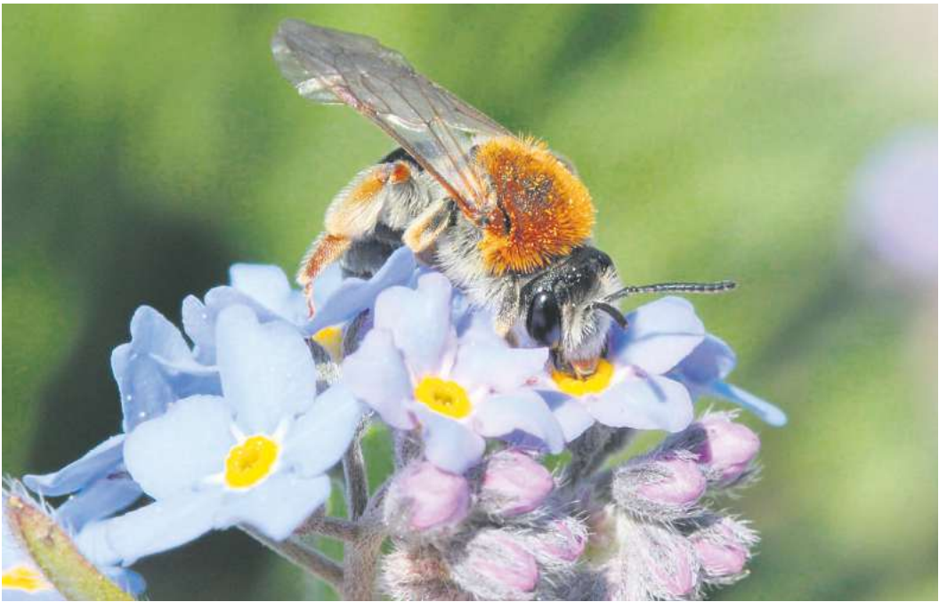
Rotschopfige Sandbiene (Andrena haemorrha) – eine Wildbiene.

Mittlerweile sind mehr als die Hälfte der 604 heimischen Wildbienen-Arten in ihrem Bestand bedroht. Die Ursachen für den Rückgang und die Gefährdung der Insekten liegen in der Zerstörung ihrer Nistplätze und in