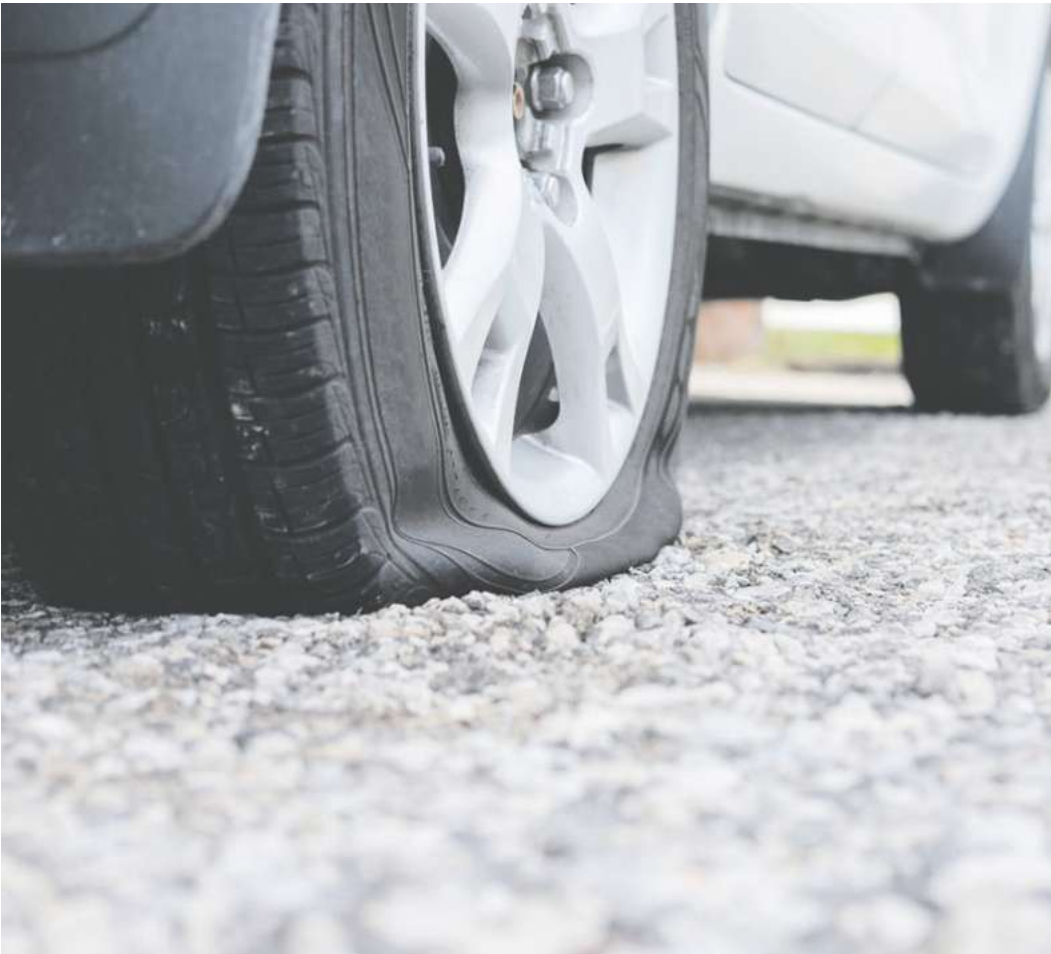
Eine Reifenreparatur ist oft günstiger und schont Ressourcen.

Felge zu demontieren. Nur so kann ihn der Fachmann in seiner Gesamtheit auch von innen prüfen: ob zum Beispiel die Seitenwand unbeschädigt geblieben ist oder der Durchstich zu groß ist. „Bei einer Reifenreparatur von außen fehlt diese Sicherheit. Das Risiko eines Reifenausfalls, unter Umständen bei höheren Fahrgeschwindigkeiten, fährt dann immer mit“, warnt der Experte. „Aus technischer Sicht ist die eigentliche Reifenreparatur heute kein Hexenwerk mehr“, sagt der DEKRA Reifensachverständige. Sie wird den Verbrauchern gegenüber sogar immer wieder als einfache, in Eigenregie durchzuführende Lösung suggeriert. Der Experte empfiehlt Laien jedoch, die Finger davon zu lassen. Neben Ausbil-