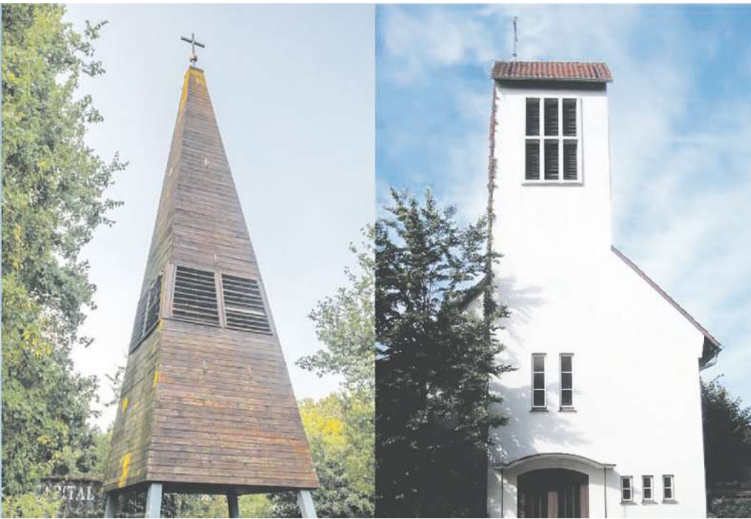
Die Silvanuskirche (links) und die Stephanuskirche fusionieren zur Evangelisch-lutherischen Kirchengemeinde Berenbostel-Stelingen.