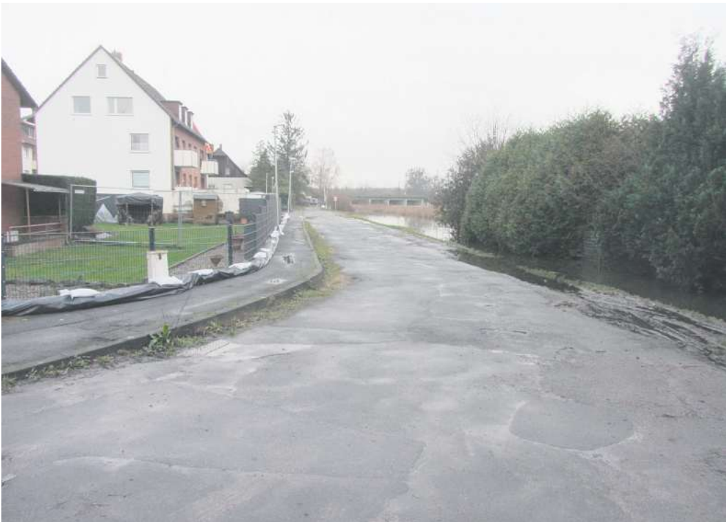
Das Wasser ist zurückgegangen: Die Sandsackbarrieren im Bereich der Straße Im Rischedahle in Letter werden nicht mehr benötigt.

SEELZE. Die Hochwasserlage im gesamten Stadtgebiet ist stabil. Dies ist das Ergebnis des letzten Treffens des Führungsstabes, der sich aus Feuerwehr, Stadtspitze, Verwaltung und Polizei zusammengesetzt hatte. Im Feuerwehrhaus Seelze, in dem auch die örtliche Einsatzleitung ihren Sitz hatte, wurde auch festgestellt, dass die Pegelstände langsam zurückgehen, berichtet Stadtfeuerwehrsprecher Jens Köhler. „Da sich die angekündigten Starkregenereignisse der vergangenen Woche nicht auf das Stadtgebiet ausgewirkt haben und die Talsperren sowie das Regenrückhaltebecken Salzderhelden jetzt wieder einen großen Puffer geschaffen haben, wurde der Führungsstab sowie die örtliche Einsatzleitung aufgelöst“, sagte Köhler. Allerdings müssen an vielen Häusern weiterhin die Keller ausgepumpt werden. Dies ist notwendig, weil nachdrückendes Grundwasser weiter in einige