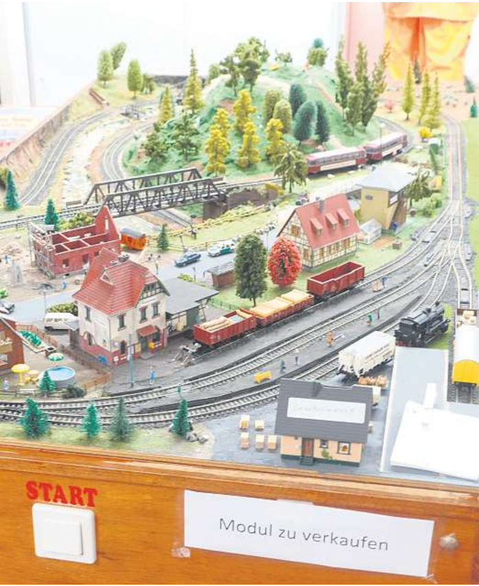
Dieses Eisenbahn-Modul kann gekauft werden.

Aufgrund des anhaltenden Interesses wird die Ausstellung „Zügig ins Museum“ um vier Wochen verlängert. Immer noch kommen Väter mit ihren Kindern in die Ausstellung, wobei die Interessen der beiden Generationen durchaus unterschiedlich sind. Während das Eisenbahnmodul mit der Schmals-