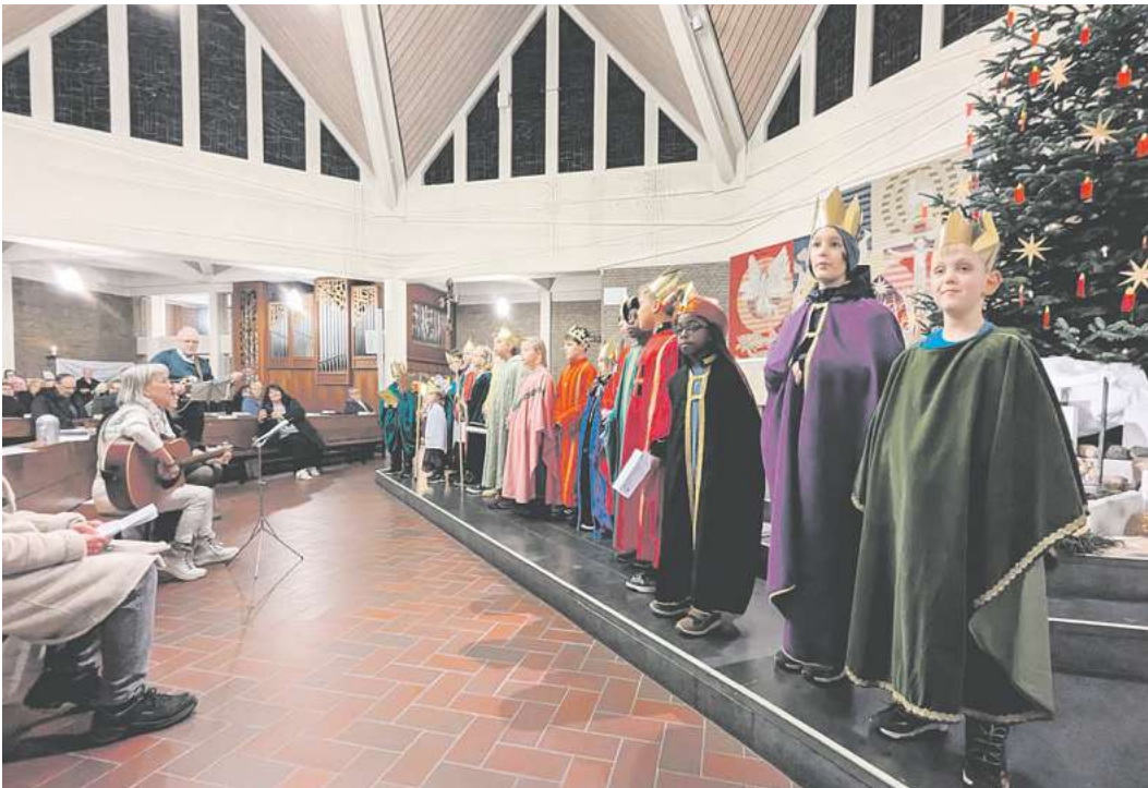
Die Sternsinger bei einem ihrer Auftritte in der Kirche.