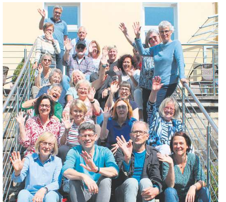
Die Mitglieder des Kammerchors Schloß Ricklingen freuen sich auf das Jubiläumsjahr und auf „Die perfekte Welle“.

SCHLOSS RICKLINGEN. Der Kammerchor Schloß Ricklingen feiert in diesem Jahr sein 40-jähriges Bestehen mit zwei Konzertwochenenden und einer CD-Aufnahme. Freuen dürfen sich Konzertbesucher schon jetzt auf ein Konzert am 9. Juni um 17 Uhr in der Barockkirche Schloß Ricklingen und am 25. August um 17 Uhr in der katholischen Kirche St. Maria Regina. Das neue Programm für dieses Jubiläum trägt den Titel „Die perfekte Welle“. Es wird ein bunter Mix aus Stücken der letzten 500 Jahre werden, wobei Kompositionen des letzten Jahrhunderts im Vordergrund stehen. In diesem Programm lassen sich viele bekannte Stücke aus den letzten 40 Jahren des Kammerchors finden, neue Stücke gibt es ebenfalls zu hören. Als Jubiläumsbonbon soll dieses Programm auch auf CD aufgenommen werden, welche