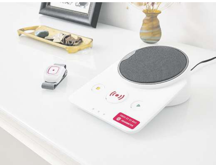
Zwischen dem 5. Februar und 17. März kann der Johanniter-Hausnotruf vier Wochen lang kostenfrei getestet werden.

wirtschaft zusammen, die ein Interesse daran hat, dass die Senioren in den Wohnungen bleiben, weil sie sehr verlässliche Mieterinnen und Mieter sind.“ Ein weiterer Baustein, um möglichst lang in den eigenen vier Wänden zu können, ist eine altersgerechte Anpassung des Heims. Auch dazu beraten die Johanniter. Oftmals könne es schon helfen, kleine Stolperfallen wie Teppichläufer zu an der Stelle eng mit der Wohnungs-