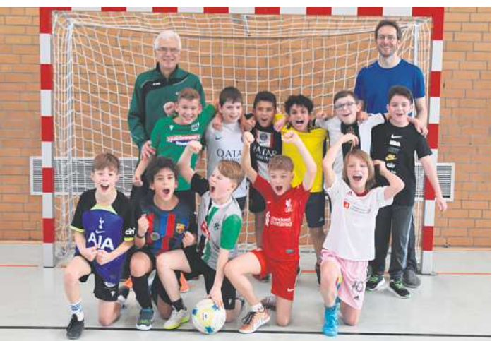
So sehen Sieger aus: Die Fußball-AG der Grundschule Osterberg aus Garbsen hat sich den Titel als Kreismeister gesichert.