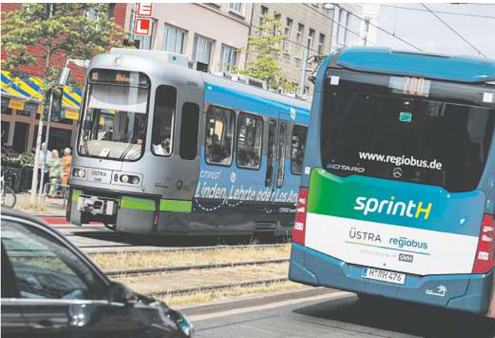
Hannover ist in Sachen ÖPNV auf einem guten zweiten Platz gelangt.