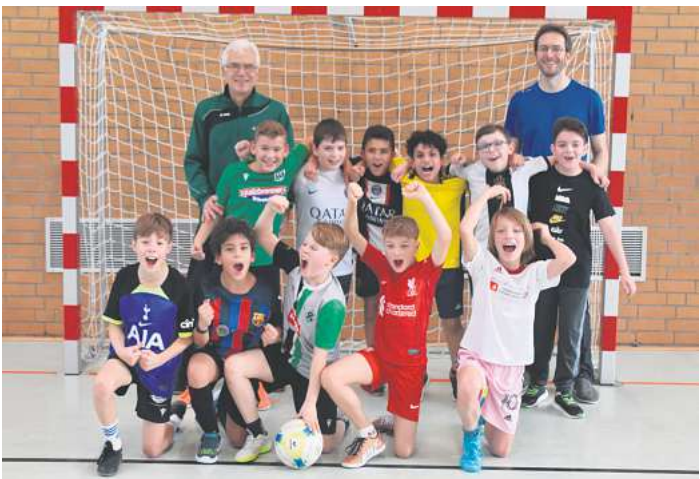
So sehen Sieger aus: Die Fußball-AG der Grundschule Osterberg aus Garbsen hat sich den Titel als Kreismeister gesichert.