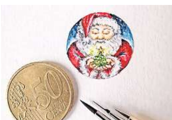
1. Platz: Marina Smirnova (Wedemark) 24,6 Prozent