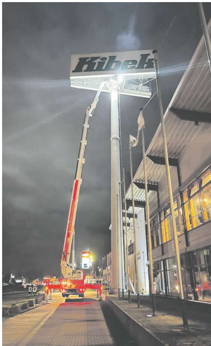
Ein Teleskopmastfahrzeug kam zum Einsatz, als die Feuerwehr an einem Werbeturm ein Schild beseitigen musste.