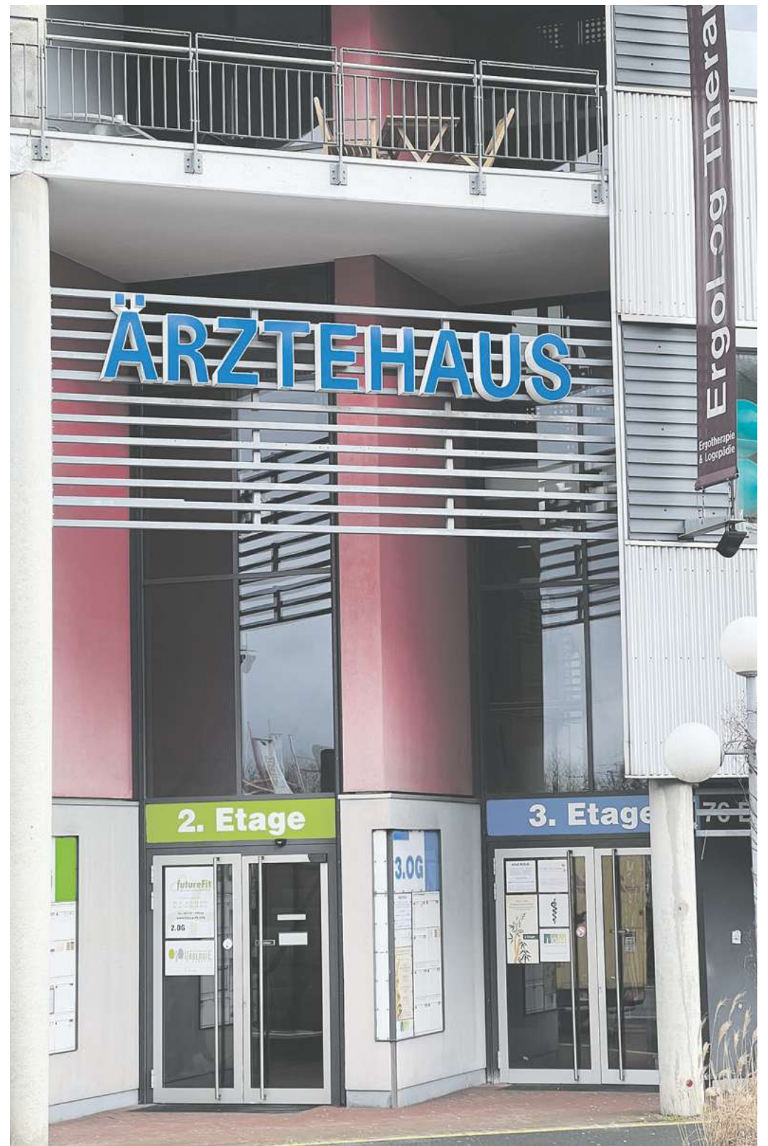
Medizinische Kompetenz unter einem Dach: Von Ergo- und Logopädie über Fitnessstudio, Facharzt-Praxen, Tageskliniken und Physiotherapie.

Die Angebote von Vorsorge und Früherkennung können Leben retten. Im Ärztehaus des Centrum Kohake kann ein Termin vereinbart werden.