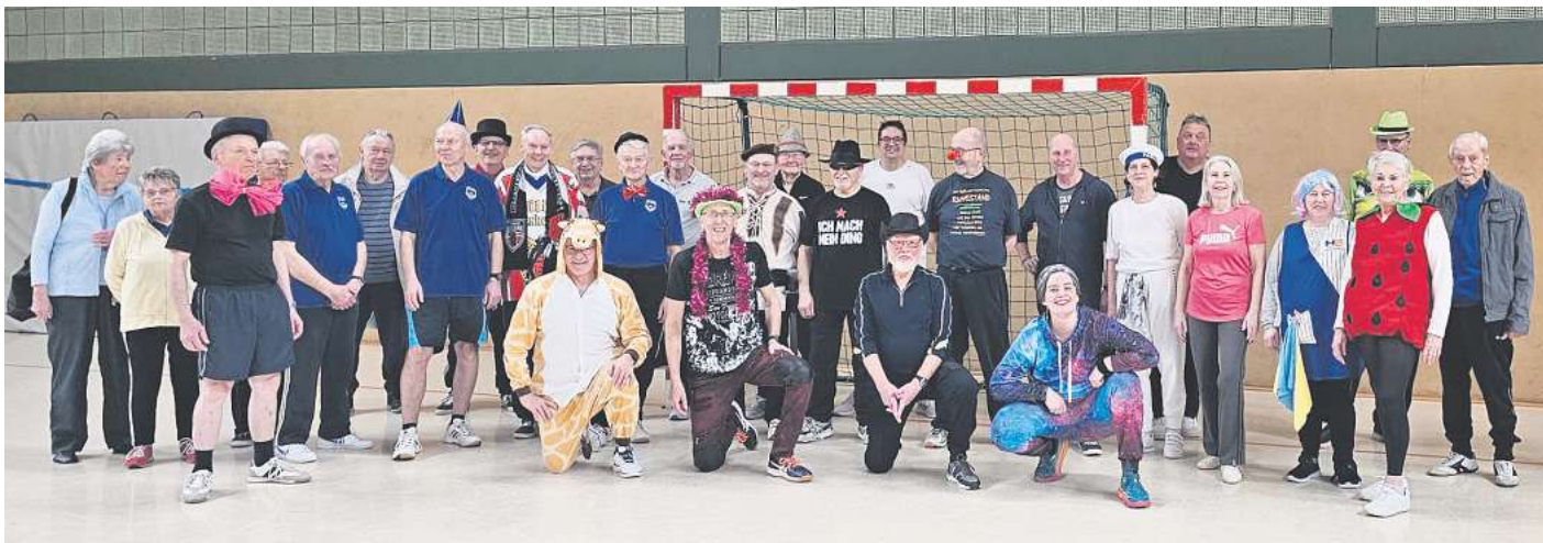
OSTERWALD. Die beiden Herzsportgruppen des SV Wacker Osterwald haben gemeinsam das Training mit der fünften Jahreszeit verbunden. Teils verkleidet und gut gelaunt gab es nach dem Aufwärmprogramm Spiele mit kleinen und großen Bällen. Zum Schluss hieß es noch einmal Dehnen und bei allen wieder die Erkenntnis, dass Sport in der Gruppe besonders viel Spaß macht.