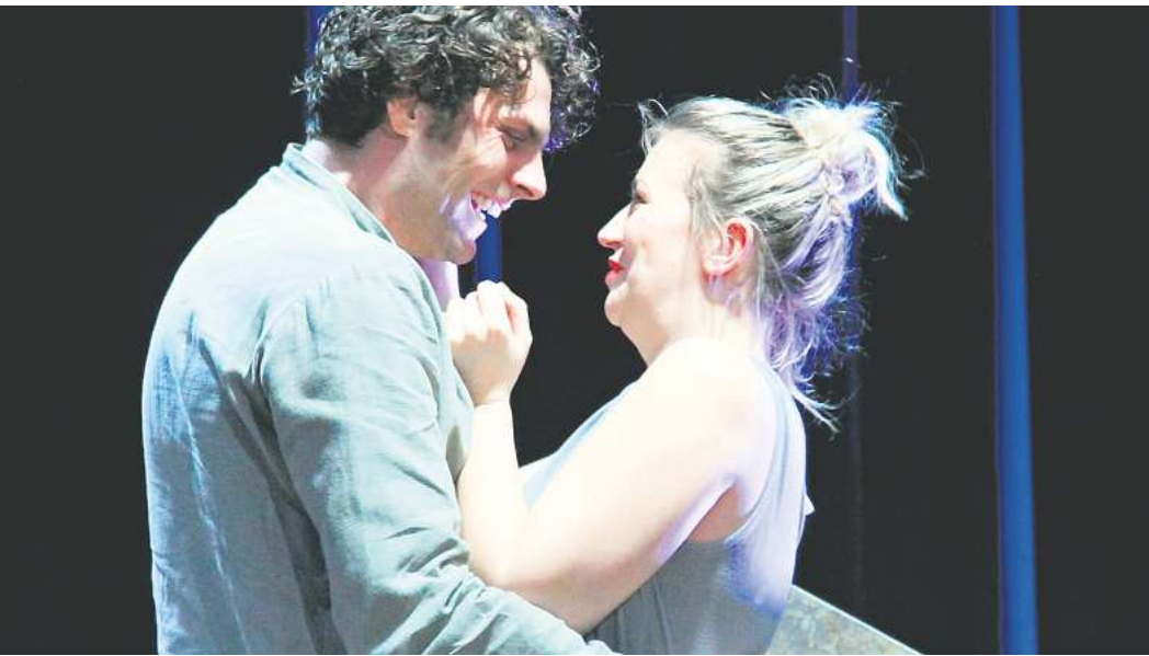
Noch ist die Welt in Ordnung: Der arme Soldat Franz Woyzeck hat ein Kind mit seiner Freundin Marie und muss deshalb zuverdienen.

Im zeitlosen Klassiker des Dichters über das Scheitern eines Menschen am System steht Franz Woyzeck im Mittelpunkt, ein einfacher Soldat. Sein magerer Verdienst reicht nicht aus, um seine Freundin Marie und ihr gemeinsames uneheliches Kind durchzubringen. Deshalb übernimmt er fragwürdige Zusatzjobs bei seinem Hauptmann und einer skrupellosen Ärztin. Für beide ist Woyzeck nichts als Abschaum, ein Mensch zweiter Klasse, den man verhöhnen und demütigen kann. Er wehrt sich nicht, weiß um seine soziale Abhängigkeit. Als Marie, Woyzecks einziger Halt im Leben, ihn mit dem Tambourmajor betrügt,