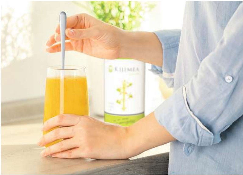
Kijimea Regularis: Einfach einrühren und genießen.

Die in Kijimea Regularis enthaltenen Fasern natürlichen Ursprungs quellen im Darm auf und dehnen die Darmmuskulatur sanft. Sie erhält dadurch den Impuls, sich wieder zu bewegen. Der Darm wird auf natürliche Weise aktiviert und die Verstopfung löst sich – planbar und zuverlässig. In der Folge können auch die Gase im Darm reduziert werden und dadurch der Blähbauch zurückgehen.