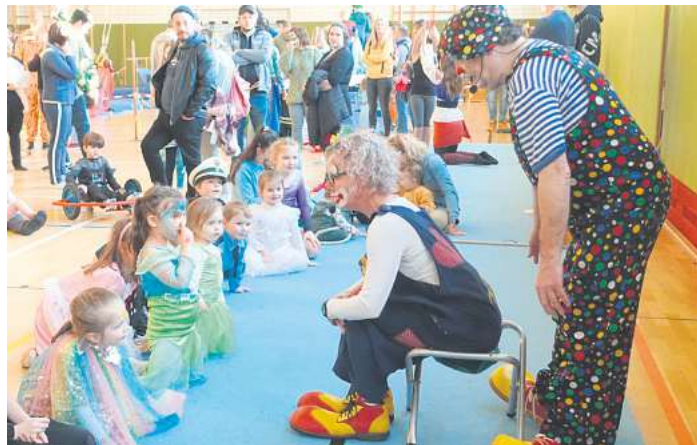
Mit großem Jubel begleiteten die Kinder den Auftritt des Clown-Duos „Floh und Luftikus“.