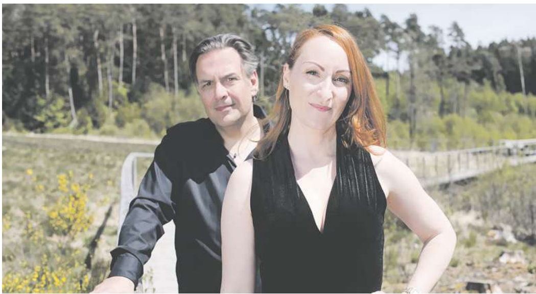
Das Duo Lühning und Nendza tritt am 9. März in der Tagesstätte Balance auf.

Von totaler Reduktion über einzelne – passgenau gewählte – zusätzliche bis hin zu opulenten Flächen reicht