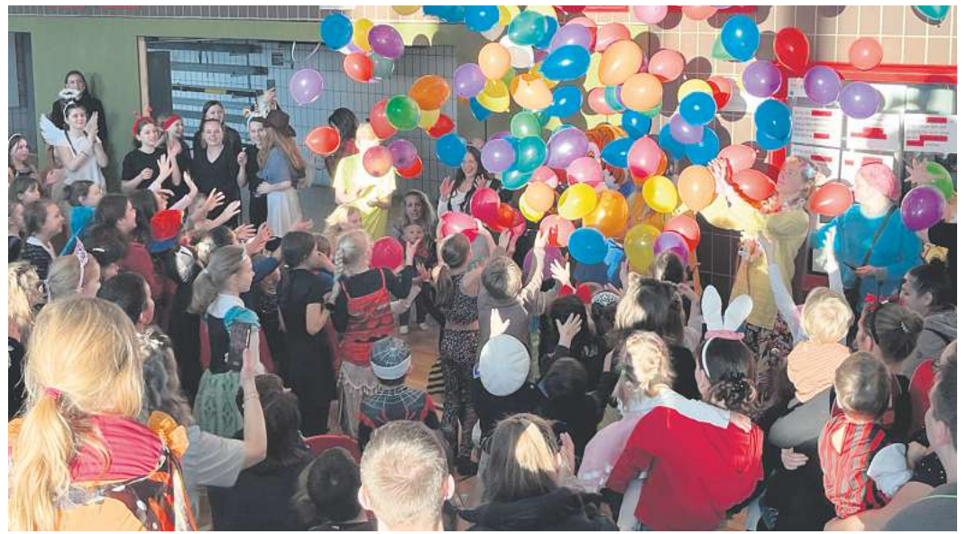
Mit dem großen Luftballonregen ging der Kinderfasching zu Ende.

In der Cafeteria im Bürger-Treff entstand ein sehenswertes Kuchenbuffet, an denen sich vornehmlich die Eltern gütlich taten. Die Kids eroberten nämlich blitzschnell die Aktionsstände in der Turnhalle. Für ein besonderes Highlight hatte hier die örtliche