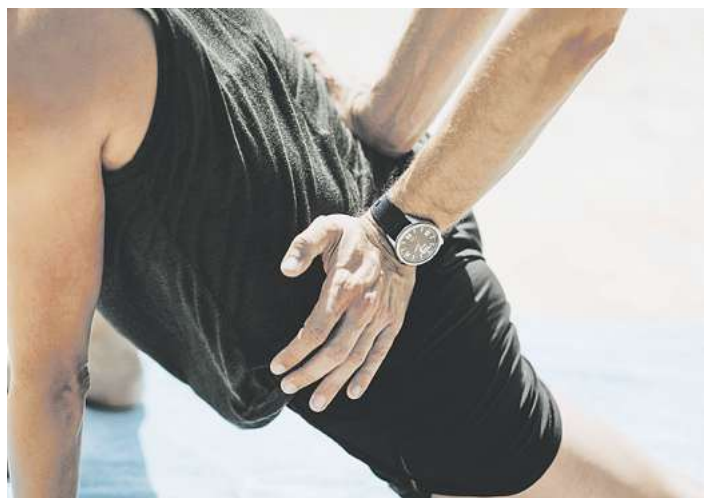
Der richtige Mix aus Aktivität und Entspannung stärkt den Rücken effektiv.