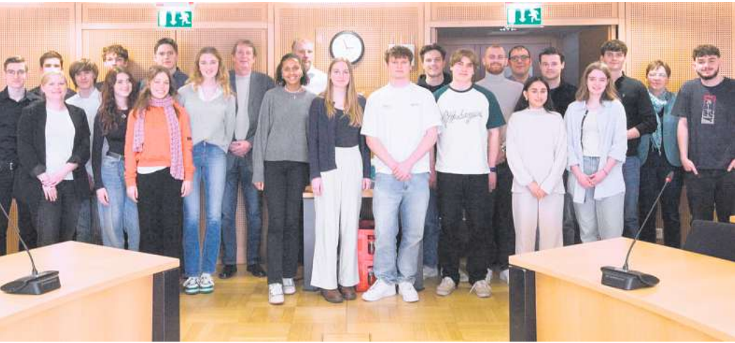
24 Schüler trafen sich mit ihren Jahrgangskoordiatoren im Rathaus Garbsen zum Abschlussgespräch der Initiative StaF.