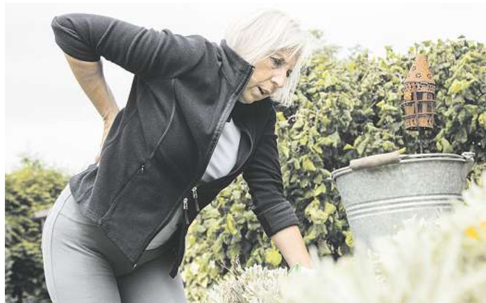
Autsch, ein Stich fährt durch den Rücken: Nach einem Hexenschuss können Wärme und Entspannung helfen.