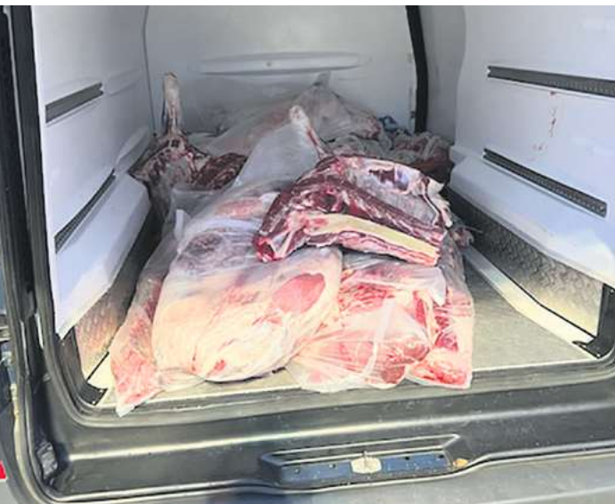
In diesem Transporter fand die Polizei unverpackte und ungekühlte Fleischwaren.

GARBSEN. Die immer noch vorherrschende dunkle Jahreszeit birgt Gefahren für den Straßenverkehr. Lichter an sämtlichen Fahrzeugen müssen funktionstüchtig sein, um diese Gefahren zu verhüten. Aufgrund dessen führte die Polizeiinspektion Garbsen Donnerstag vergangener Woche eine Großkontrolle an der Bundesstraße 6 durch. Dafür fanden sich 30 Polizeibeamtinnen und -beamte der Polizeiinspektion Hannover an den Parkplätzen auf Höhe des Geflügelhofes an der B6 ein. Die Verkehrskontrollen wurden in beide Fahrtrichtungen, Nienburg und Hannover, durchgeführt. Die Kontrollen bezogen sich jedoch nicht nur ausschließlich auf die Gefahren im Zusammenhang mit der Dunkelheit, sondern auf sämtliche Verkehrswidrigkeiten und Straftaten. Insgesamt wurden über 150 Fahrzeuge auf ihre Verkehrstüchtigkeit kontrolliert und die Fahrtauglichkeit der Fahrzeugführenden überprüft. Neben 41 geahndeten Ordnungswidrigkeiten, stellte sich zudem ein Verstoß gegen das Lebensmittel- und Futtermittelgesetz