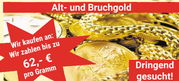
Alt- und Bruchgold

Wir kaufen an: Wir zahlen bis zu 62,- € pro Gramm