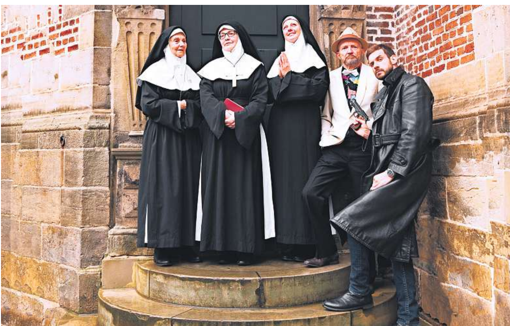
Die neue Kriminalkomödie der Laientheatergruppe der vhs Hannover Land unter Leitung von Martin Bossert spielt in einem Kloster.

Beim diesjährigen Bühnenstück geht es nicht um Mord, sondern um drei glücklose Bankräuber, die sich in dem Kloster zum heiligen Gertrudis verstecken wollen. Sie ahnen allerdings nicht, was sie hinter den Klostermauern erwartet. Jack, der Boss der Bande, verzweifelt zunehmend an seinen Mitgaunern. Aber auch die frostige Äbtissin des Klosters und ihre Mitbewohnerinnen strapazieren seine Nerven gewaltig. Die Lage im Kloster spitzt sich zu, als auch noch die ehrgeizige Kommissarin Valuzzi von der Staatspolizei samt ihrer Inspektorin Rossi die Spuren der Bankräuber bis zum Kloster verfolgt. Eine Entwicklung wiederum, die auch den