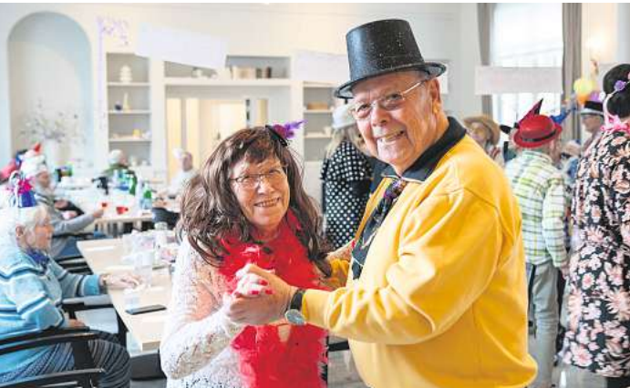
Saisonale Feste wie beispielsweise Karneval feiern die Gäste gemeinsam.

Telefon: (0511) 36736-1003 E-Mail: heidehaus@hahne-tagespflege.de www.hahne-tagespflege.de