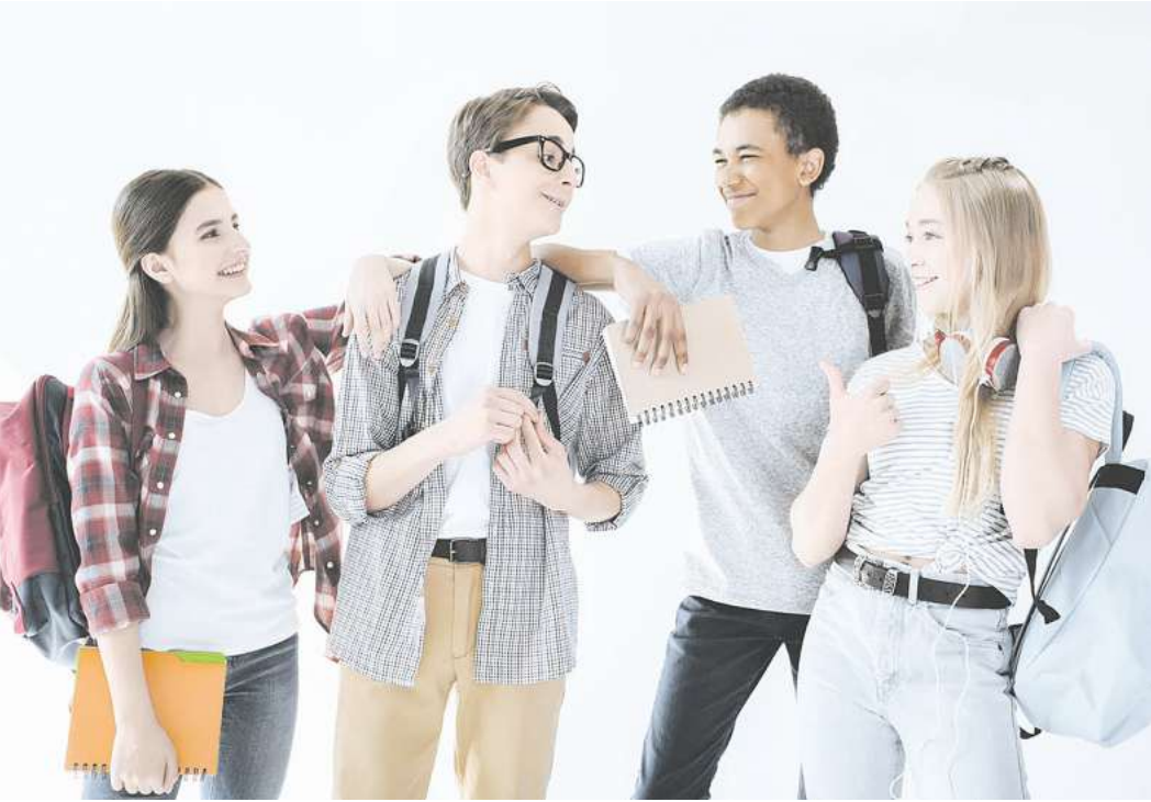
Im Ferienkurs der Schülerhilfe erste Wissenslücken schließen.

GARBSEN. Am Montag hat die Polizei Garbsen drei E-Scooter-Fahrer kontrolliert, die ohne Versicherungsschutz unterwegs waren. In zwei Kontrollfällen war der alte Versicherungsschutz zum 1. März ausgelaufen, dies war deutlich zu erkennen an den schwarzen Kennzeichen. Seit dem 1. März wird ein bestehender Versicherungsschutz von zulassungspflichtigen Kleinstfahrzeugen durch ein blaues Kennzeichen ausgedrückt. In der dritten Kontrolle wurde das Fahrzeug ohne Kennzeichen geführt. Allen drei Fahrzeugführern wurde die Weiterfahrt untersagt. Zudem wurden Ermittlungsverfahren wegen des Verstoßes gegen das Pflichtversicherungsgesetz eingeleitet.