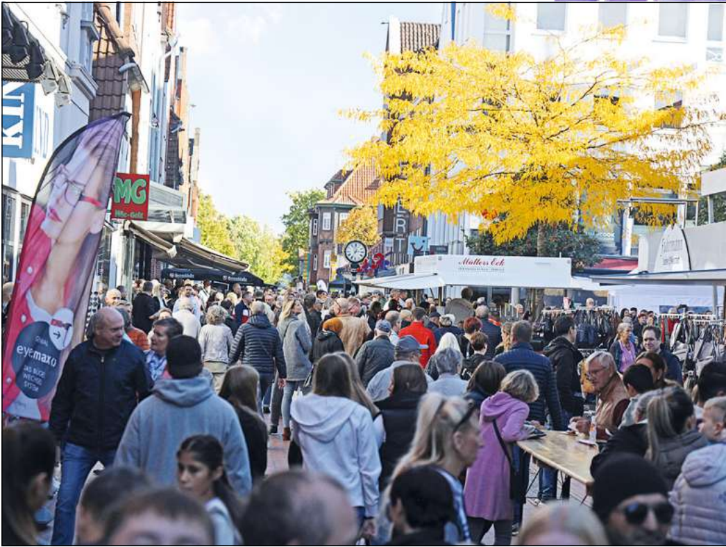
Bei hoffentlich so gutem Wetter wie im Herbst dürften Besucher der Innenstadt am „Goldenen Sonntag“ wieder voll auf ihre Kosten kommen.

Neustadt (os). Ein großes buntes Erlebnis- und Mitmach-Programm begleitet auch dieses Mal wieder den Goldenen Sonntag der Gemeinschaft für Wirtschaftsförderung (GfW) am morgigen 17. März. Viele Geschäfte in der Neustädter Innenstadt - teils auch im Gewerbegebiet - laden zwischen 13 und 18 Uhr mit aktuellen Frühlingstrends und Aktionen zum Shoppen ein. Kinder können sich am DRK-Stand „Zwischen den Brücken“ schminken lassen. Die Feuerwehr Neustadt zeigt dort ihre Einsatzfahrzeuge und hat sicher wieder Aktionen geplant. Die Bundeswehr ist ebenfalls mit Fahrzeugen und dem Freundeskreis Panzerbataillon 33 vertreten, bietet dazu einen Fitness-Parcours. An der Mühlenbrücke wird auch die DLRG wieder vertreten sein. Für die Jüngsten hat die GfW wieder ein Karussell am Heini-Nülle-Platz gebucht. Außerdem gibt es in der Mittelstraße eine Kindereisenbahn und ein weiteres Kinderschminken. Die