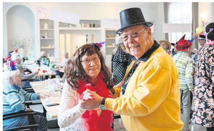
Saisonale Feste wie beispielsweise Karneval feiern die Gäste gemeinsam.

Telefon: (0511) 36736-1003 E-Mail: heidehaus@hahne-tagespflege.de www.hahne-tagespflege.de