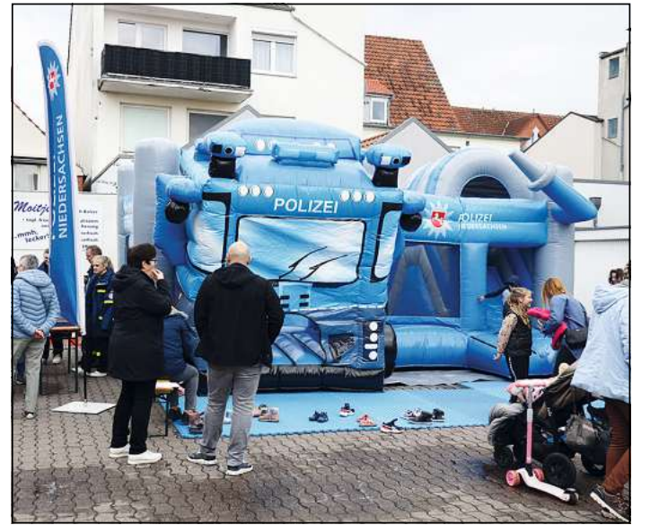
Die Polizei lockt vor allem die Kleinsten mit der Wasserwerfer-Hüpfburg auf den Wallhof.

nicht nur die Innenstadtgastrosomen und -bäcker, sondern zusätzlich auch Crêpes und andere süße Speisen, Suppen, Gegrilltes sowie verschiedene, internationale Spezialitäten - verteilt über die Innenstadt.