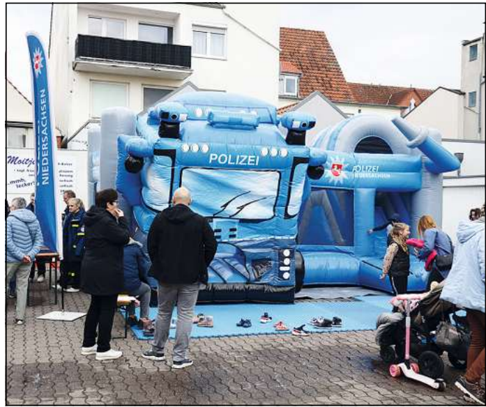
Die Polizei lockt vor allem die Kleinsten mit der Wasserwerfer-Hüpfburg auf den Wallhof.

nicht nur die Innenstadtgastrosomen und -bäcker, sondern zusätzlich auch Crêpes und andere süße Speisen, Suppen, Gegrilltes sowie verschiedene, internationale Spezialitäten - verteilt über die Innenstadt.