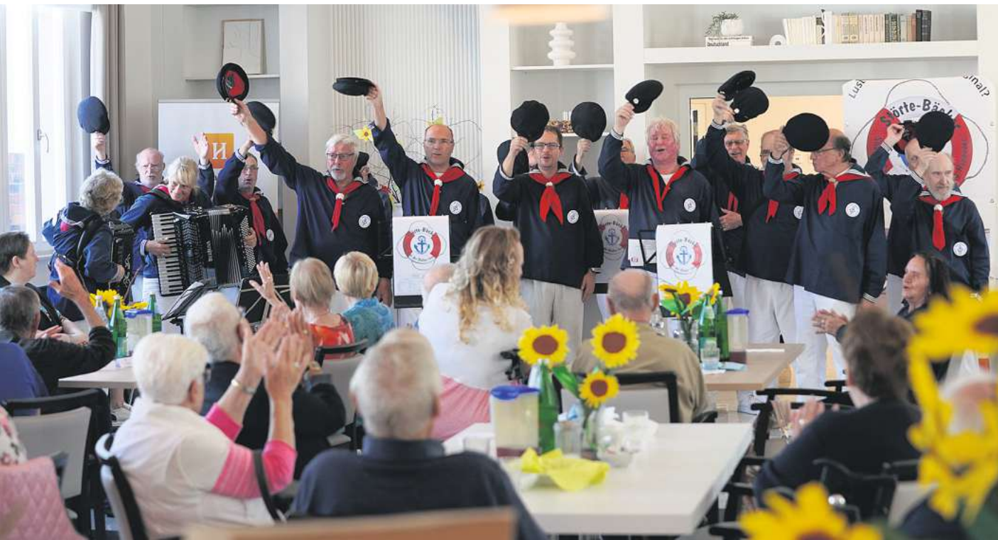
Der Besuch des Shantychores ist immer ein besonderer Höhepunkt für viele Gäste.