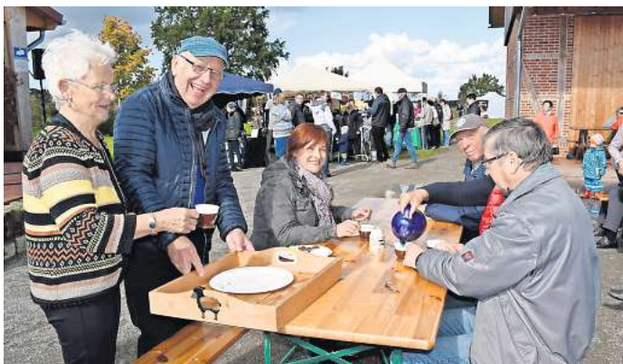
Eigentlich kann Osterwald sehr gut feiern: Besonders wie hier auf der Naturerlebniswiese beim Heimatverein oder bei den beiden Schützenfesten. Aber das 777-Jahr-Fest für Osterwald fällt aus.

Das große Fest ist gescheitert, weil niemand die Schulden übernehmen will, wenn keine Leute und kein Geld kommen. Der Ortsrat will das am wenig-