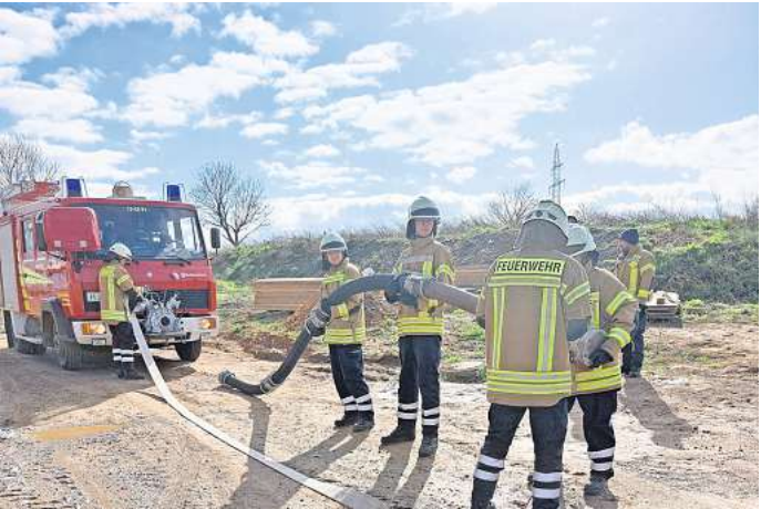
Die Teilnehmenden der modularen Truppausbildung der Seelzer Stadtfeuerwehr zeigten am letzten Praxistag ihr Können.

Brandbekämpfung sowie der technischen Hilfeleistung. Am Samstag mussten die angehenden Feuerwehrangehörigen das Erlernte im Rahmen einer umfangreichen Übung unter Beweis stellen. Ein angennommener Brand in der neuen Grundschule in Harenberg erforderte den Einsatz aller Teilnehmer. Es mussten Wasserversorgungen und Angriffsleitungen aufgebaut werden. Trotz des hellen Nachmittages wurde die Einsatzstelle auch ausgeleuchtet. Nachdem über tragbare Leitern die oberen Stockwerke erreicht waren, wurden Löschschläuche mit besonderen Knotentechniken an Seilen befestigt und hochgezogen werden. Nach Abschluss der Übung trafen sich Teilnehmer und Gäste aus Rat und Verwaltung sowie der Feuerwehr in der Mehrzweckhalle zum feierlichen Abschluss. Alle Teilnehmer erhielten von den Stadtausbildungsleitern Sascha Kues und Frank Korthauer die Teilnahmebescheinigungen. Stadtbrandmeister Dr. Christian Kielhorn betonte seinen Stolz darüber, dass das Ausbildungsteam der Stadtfeuerwehr die vorgegebenen Rahmenrichtlinien erfolgreich und mit hohem Niveau umsetzen konnte. Auch Bürgermeister Masthoff bezeichnete die erste modularen Ausbildung als sehr gelungen.