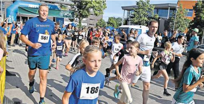
Garbsen bewegt sich: Beim Citylauf am 24. Mai gehen wieder Hunderte Läuferinnen und Läufer auf die Strecke.

Hier gibt es die größten Veränderungen zum Vorjahr, sagt Borowy. „Zum einen bieten wir auf Wunsch der Teilnehmer in diesem Jahr wieder eine 10.000-Meter-Strecke an und zum anderen haben wir den Verlauf geändert, um am Ende jeweils auf glatte Kilometerzahlen zu kommen“, so der Psychologiestudent. Der Start- und Zielbereich wird wie gehabt auf dem Rathausplatz aufgebaut. Die Läuferinnen und Läufer der längeren Distanzen laufen allerdings nicht mehr komplett um den Berenbosteler See, sondern nur noch an einer Seite entlang. Rund um die Strecke werden