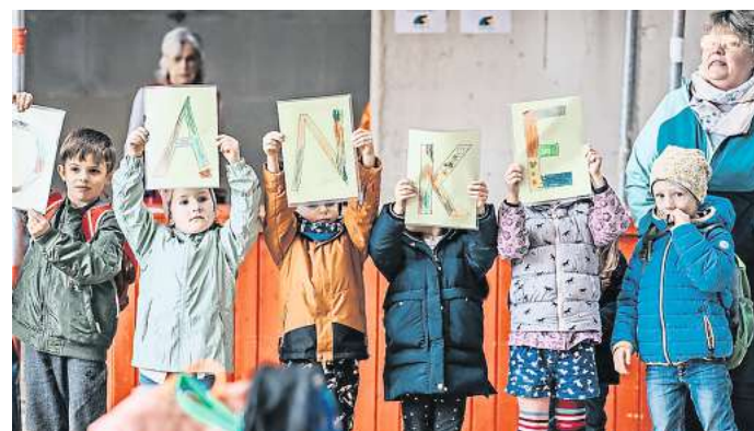
Die Kinder der Kita Harenberg tragen ihre Wünsche für die neue Kita vor und sagen Danke an alle Baubeteiligten.