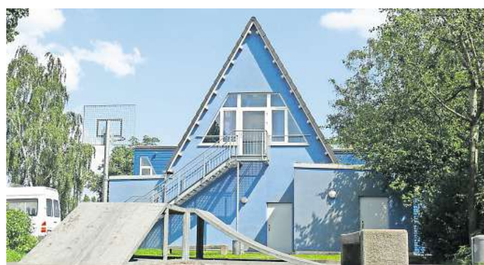
Das neue Quartalsprogramm für das Jugendbildungshaus Letter mit vielen bunten Angeboten für die Monate April bis Juni ist da.

Das gedruckte Programm liegt seit Ende März im Rathaus Seelze, der Stadtbibliothek, den