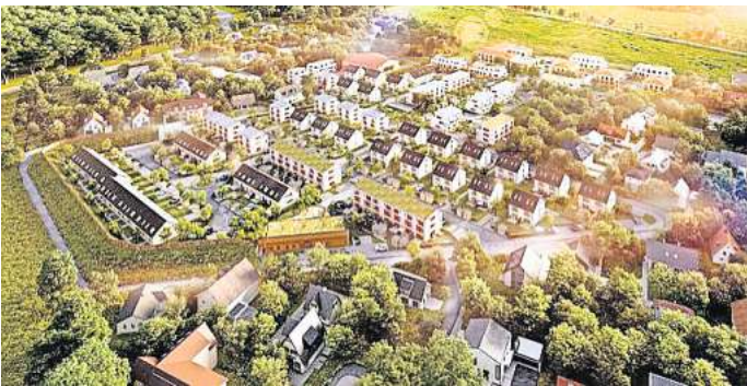
So soll das Neubaugebiet in Gümmer einmal aussehen: Geplant sind überwiegend Einfamilien- und Doppelhäuser.

Tatsächlich sei die Hannoversche Immobilien Treuhand aktuell von dem Insolvenzverfahren nicht betroffen, sagte ein Mitarbeiter. „In Gümmer könnte aktuell noch gearbeitet werden.“ Allerdings liefen noch Gespräche mit Banken, und die geplante Grundsteinlegung für die Kindertagesstätte sei