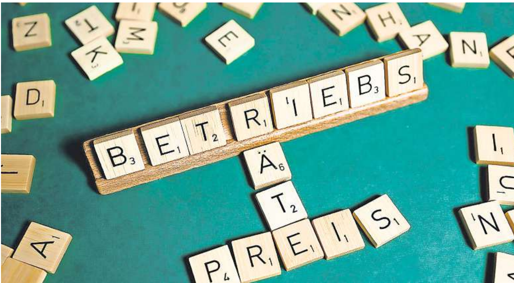
IG BAU ruft zum Betriebsrätepreis in Stadt und Region Hannover auf.