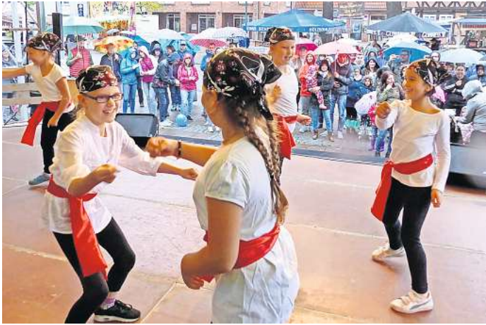
Viel Beifall gab es in den vergangenen Jahren für die Kindertanzgruppen auf der Bühne.