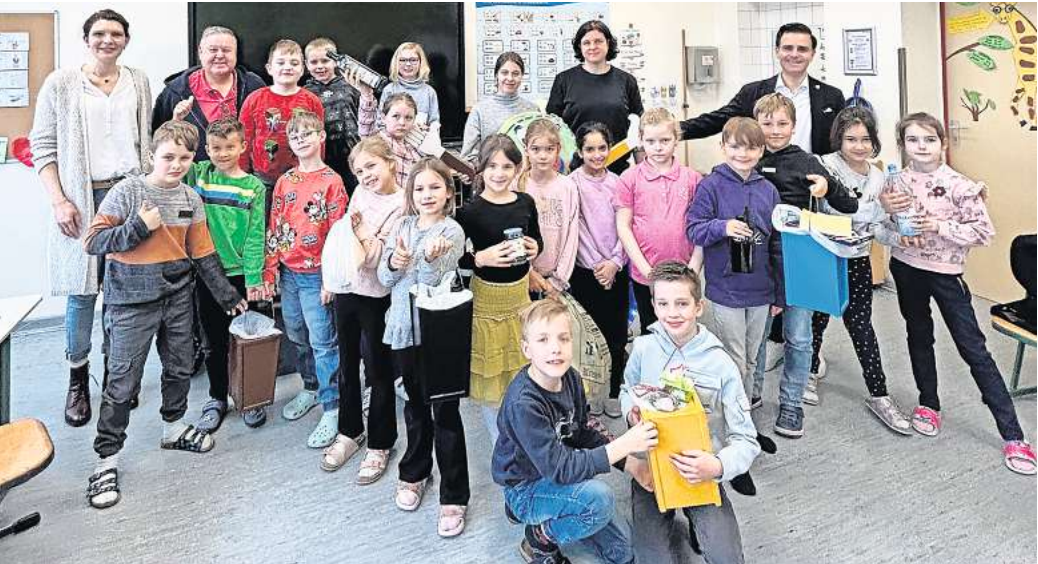
Das Müllmonster hilft den Zweitklässlern spielerisch zu erfahren, wie Müll getrennt oder bestenfalls direkt vermieden werden kann.

sieht das Kollegium das Thema Ganztagschule. Ein besonderes Lob gab es für das kostenfreie Schlittschuhlaufen, das die Stadt allen Schulklassen beim Weihnachtszauber angeboten hatte.