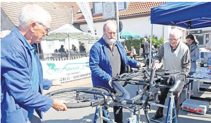
Das Codier-Team des Allgemeinen Deutschen Fahrrad-Clubs aus Garbsen wurde zu Beginn der Aktion in Letter regelrecht überrannt.

immer ihren Eigentümern zu geordnet werden. Allerdings sollten die Besitzer nicht auf ein stabiles Schloss verzichten, denn nach der Statistik hat der Diebstahl der in der Regel mehrere tausend Euro teuren Bikes zugenommen. Auch das Kruse-Team hatte alle Hände voll zu tun. Da die Aktionstage mit reduzierten Preisen schon kurz nach Ostern begannen, hatten viele Zweirad-Fans das Fachgeschäft in den Tagen vor dem Saisonstart angesteuert und sich informiert. Andere liebten es gemütlicher angehen, informierten sich am Samstag in aller Ruhe bei Kaffee und Kuchen und erfüllten sich ihren Traum von einem neuen Bike