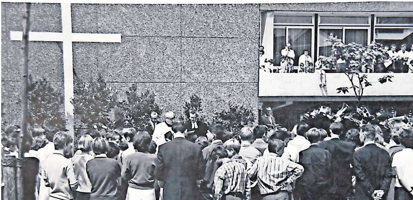
Damals stand das Rathaus noch in Havelse: Das Foto zeigt einen Gottesdienst vor dem Gebäude.

GARBSEN. Garbsen ist eine junge Stadt. Das, was wir heute darunter verstehen, gibt es erst seit dem Jahr 1974. Bei der jüngsten Gebietsreform vor 50 Jahren entstand die Stadt mit ihren heute 13 Stadtteilen – inklusive Berenbostel. Und auch wenn sich bis heute einige der Einwohnerinnen und Einwohner mehr mit ihrem jeweiligen Stadtteil identifizieren als mit dem Zusammenschluss, soll dieser anlässlich des Jubiläums gebührend gewürdigt werden. Deshalb soll es in diesem Jahr (und teilweise auch noch 2025) Spaziergänge und Führungen zu markanten Punkten in allen 13 Stadtteilen geben. Den Auftakt macht am Mittwoch, 24. April, Havelse. Der Stadtteil war vor der Gebietsreform von 1974 so etwas wie das Zentrum Garbsens und auch der Sitz des Rathauses. 1968 hatten sich die damaligen Gemeinden Garbsen und Havelse zur Stadt Garbsen zusammengeschlossen (damals noch ohne Berenbostel). Das sogenannte Stadtrecht verlieh der damalige niedersächsische Innenminister Richard Lehnert, der selbst in Garbsen lebte. Die Verleihung des Stadtrechts war ein wichtiger Schritt gegen die seinerzeit drohende Eingemeindung nach Hannover. Der historische Stadteitspaziergang in der Veranstaltungsreihe „50 Jahre Gebietsreform“ startet um 17 Uhr am Kulturhaus Kalle, dem ehemaligen Rathaus der Stadt. Die Führung übernimmt Garbsens Stadtarchi-