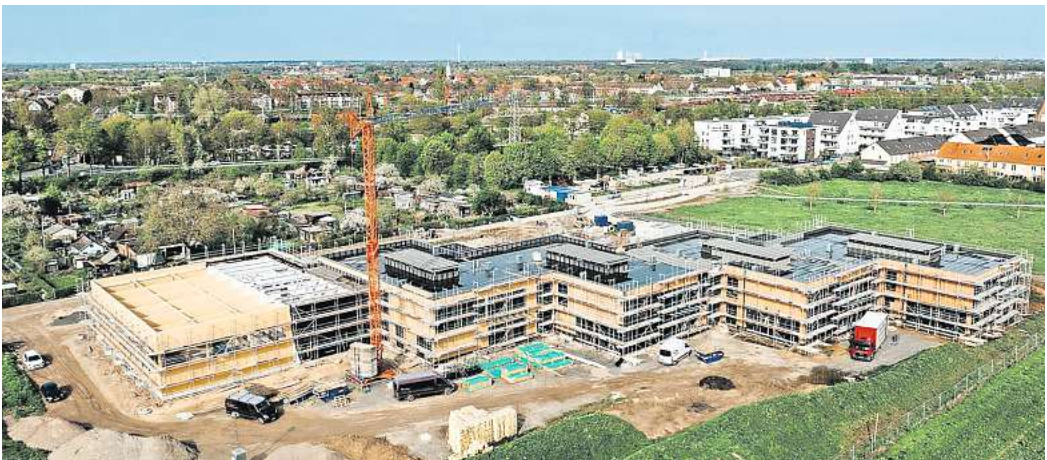
Der Richtkranz weht über dem Rohbau der Grundschule Seelze-Süd. Zum Schuljahr 2025/2026 sollen in den modernen und auf vielfältige Lernkonzepte ausgerichteten Räumen die ersten 300 Kinder beschult werden.

lastung der Regenbogenschule in Seelze erfolgen, die aktuell im laufenden Betrieb saniert wird und an der zurzeit 520 Kinder unterrichtet werden. Zeitgleich entsteht in Harenberg ein weiterer neuer Grundschul-Neubau, an dem ebenfalls zum Schuljahr 2025/2026 die ersten Klassen einziehen sollen. Die aktuelle Kostenplanung für den Neubau der Grundschule Seelze-Süd beläuft sich auf rund 28,3 Millionen Euro.