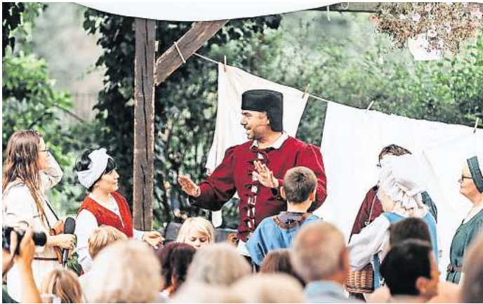
Die Obentraut-Zeitreise ist seit Jahren ein beliebtes Spektakel. Für ihre nächste Aufführung Ende August im Bürgerpark Seelze suchen die Darstellerinnen und Darsteller Verstärkung.