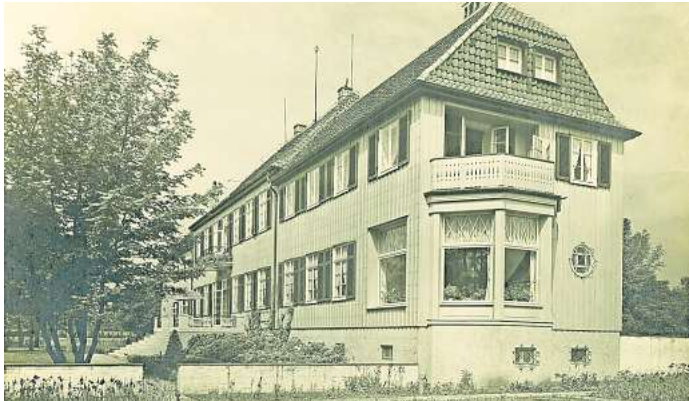
Historisches Gebäude: So sah das Gut Heitlingen 1925 aus.

straße 343a. Meyenfeld: Donnerstag, 28. August 2025, 17 Uhr, Treffpunkt Dorfplatz, Leisterstraße. Horst: Donnerstag, 25. September 2025, 17 Uhr. Treffpunkt: Stadtarchiv, Lehmstraße 1. Ziel ist unter anderem die Mühle aus der Mitte des 19. Jahrhunderts, die von der Müllerfamilie Koopmann erbaut wurde. Die Flügel des sogenannten Erdholländers sind 1923 abgenommen und durch einen Motor ersetzt worden. Info: Die Teilnehmerzahl ist jeweils auf 30 Personen begrenzt. Anmeldungen sind jeweils ab sechs Wochen vor dem Termin möglich online auf www.garbsen.de/stadtteilrundgaenge .