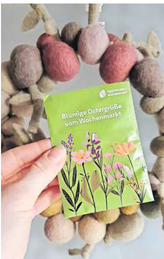
Kleine Aufmerksamkeit für Wochenmarktbesucher in Garbsen

pracht. So möchte die Deutsche Marktgilde den Nachhaltigkeitsgedanken und Gemeinschaftscharakter des Wochenmarktes weiter verstärken und dem immer knapper werdenden Lebensraum der nützlichen Lebewesen entgegenwirken. Wer Lust hat, die Landwirte und Unternehmer der Region zu unterstützen, der ist herzlich eingeladen den Wochenmarkt zu besuchen. Der Wochenmarkt Garbsen am Kastanienplatz findet donnerstags von 14 bis 17 Uhr statt und auf dem Hérouville-St.-Clair-Platz freitags von 14 bis 18 Uhr.