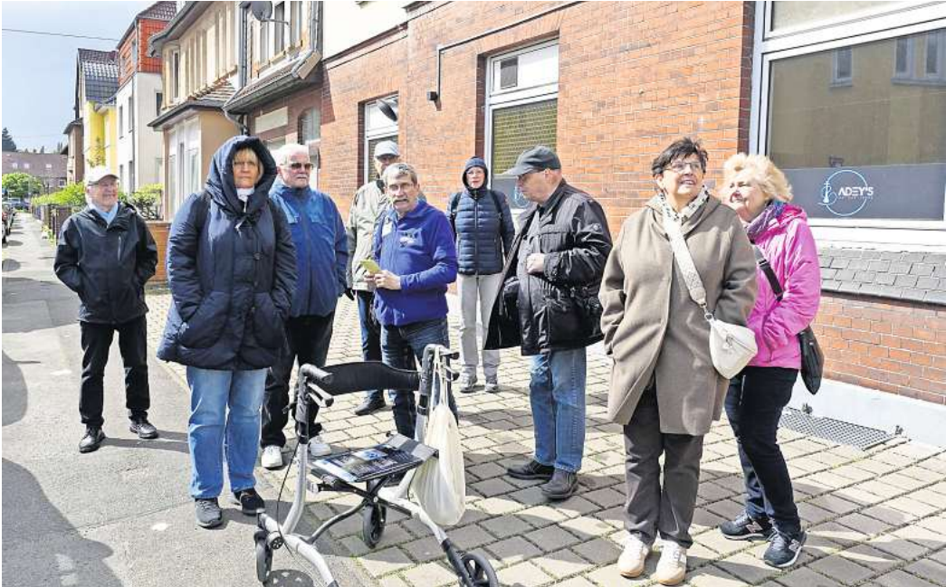
LETTER. In der vergangenen Woche fanden sich trotz Kälte zehn Interessierte zur 9. Stadtführung Letter ein, die der Verein „Letter-fit: Miteinander-Füreinander“ anbot und hielten auch über drei Stunden bei anregenden Gesprächen durch. Der Rundgang startete am Wulfesbrunnen und ging über Im Sande, Stöckener Straße, Kurze Wanne, Mehrgenerationenspielplatz, Lange-Feld-Straße bis zum Kastanienplatz und zurück. Es gab viel zu entdecken, spannende Geschichten zu berichten und Anekdoten auszutauschen.