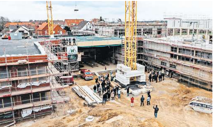
Es geht voran: Im März konnte auf der Baustelle für die neue Grundschule in Harenberg das Richtfest gefeiert werden.

Täter konnten vom Opfer wie folgt beschrieben werden: Alle waren etwa 18 bis 20 Jahre alt und ungefähr 1,80 m groß; zwei Personen haben jeweils einen Hoodie getragen; die dritte Person trug eine dunkle Cappy sowie eine dunkle Vintage-Joggingjacke mit Streifen an den Ärmeln. Aufgrund der körperlichen Auseinandersetzung ist es möglich, dass mindestens zwei der Täter Gesichtsverletzungen davongetragen haben. Wer hierzu auffällige Feststellungen gemacht hat, insbesondere im Bereich der Goethestraße, Am Isenbrink oder in der Südstraße, oder allgemein Hinweise zu den Tätern geben kann, wird gebeten, sich mit der Polizei in Seelze unter der Telefonnummer (05137) 8270 in Verbindung zu setzen.