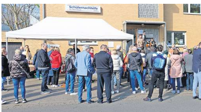
Vertreter aus Politik und Verwaltung und viele neugierige Bürger nutzten die Eröffnung des „Ecki“ zu einem Besuch.

„Deutsch lernt man am besten, wenn man es spricht“: das dienstags von 16 bis 18 Uhr und donnerstags von 14 bis 15 Uhr angeboten wird; Start des Angebots am 7. Mai