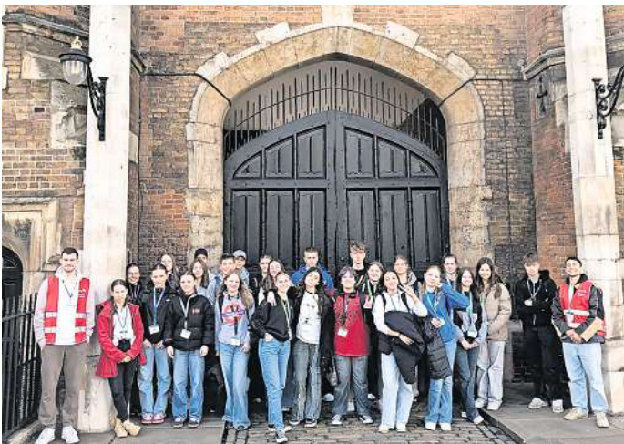
Jungen und Mädchen aus Garbsen, die in den Osterferien einen Ausflug nach London vor dem St. James Palast gemacht haben.