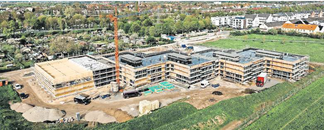
Im April wurde das Richtfest gefeiert: Der neue Grundschul-Standort in Seelze-Süd ist inzwischen unübersehbar.

Nach den Planungen wird zum Schuljahr 2025/2026 in Harenberg eine neue 3,5-zügige Ganztagsgrundschule mit einer Ein- einhalbfeld-Sporthalle zur Verfügung stehen, in deren unmittelbarer Nachbarschaft zeitgleich die neue Kindertagesstätte gebaut wird. In Seelze-Süd kann