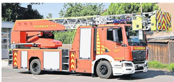
Die neue Drehleiter der Ortsfeuerwehr Garbsen.

Verwaltung sowie Abordnungen der Feuerwehren aus Markoldendorf und Seelze und vom DRK Garbsen zur offiziellen Indienststellung der neuen Drehleiter im Feuerwehrhaus in Ha-