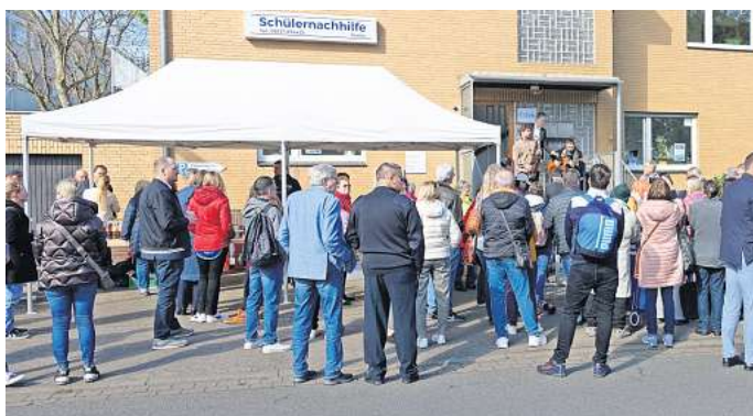
Vertreter aus Politik und Verwaltung und viele neugierige Bürger nutzten die Eröffnung des „Ecki“ zu einem Besuch.

„Deutsch lernt man am besten, wenn man es spricht“: das dienstags von 16 bis 18 Uhr und donnerstags von 14 bis 15 Uhr angeboten wird; Start des Angebots am 7. Mai