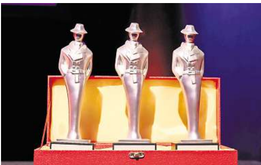
Die Verleihung der begehrten Glauser-Preise findet am Sonnabend, 18. Mai, statt.