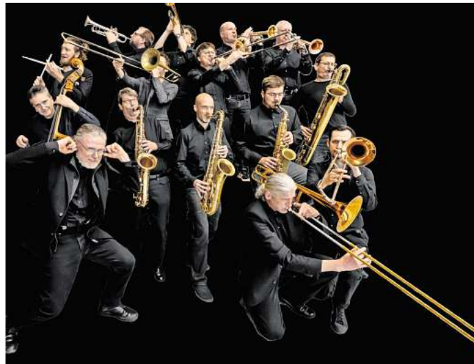
Mit JAZZORGAN können die Besucher in die goldene Ära der Big Bands eintauchen, in pures Entertainment und in den Flair mitreißender Ballroom Dance Music