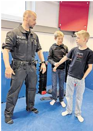
Beim Zukunftstag zeigten speziell ausgebildete Polizeibeamte den Schülern auch Abwehr- und Zugriffstechniken.

keit von vorbeifahrenden Fahrzeugen messen. Zu guter Letzt bekamen sie die Möglichkeit, sich die Schutzausstattung eines Beamten des Einsatz- und Streifen dienstes einmal genau anzugucken und auf Wunsch auch mal anzuprobieren. Zahlreiche Polizisten standen den Kindern bei allen Fragen rund um den Polizeiberuf Rede und Antwort.