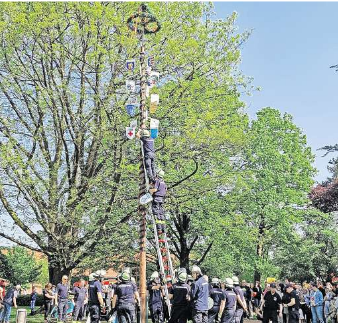
In luftiger Höhe wurden durch die Feuerwehr noch die letzten Wappen der Stadtteilvereine am Maibaum angebracht.