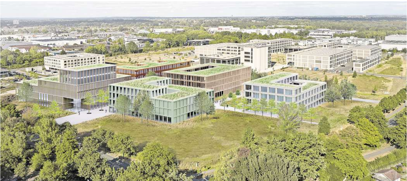
So könnte es am Ende aussehen: Der Technologiepark am Campus Maschinenbau entsteht zwischen der Havelser Straße und der Walter-Koch-Straße.

Die Pläne sind ambitioniert: Spätestens in zehn Jahren sollen zwischen der Havelser Straße