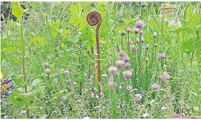
Vielfältig und Insektenfreundlich: Alle Seelzerinnen und Seelzer können sich bis Mittwoch, 31. Juli, am Wettbewerb für naturnahe Gärten und Balkone beteiligen. Die Gewinnerinnen und Gewinner erhalten ein Preisgeld.

Eine bunte Auswahl insektenfreundlicher und möglichst heimischer Pflanzenarten, ein Nistkasten und ein Insektenhotel: Viel mehr braucht es nicht, um den eigenen Balkon oder Garten ökologisch aufzuwerten und Wildtieren etwas Nahrung sowie einen kleinen Lebensraum zu bieten. Dennoch sind im gesamten Stadtgebiet vielerorts Schottergärten und karge Balkone zu sehen. Dass es mit teils sehr geringem Aufwand auch ganz anders geht, soll der Wettbewerb für naturnahe Gärten und Balkone, der auf einen gemeinsamen Antrag der Ratsfraktionen von Bündnis 90 / Die Grünen und SPD zurückgeht, verdeutlichen.