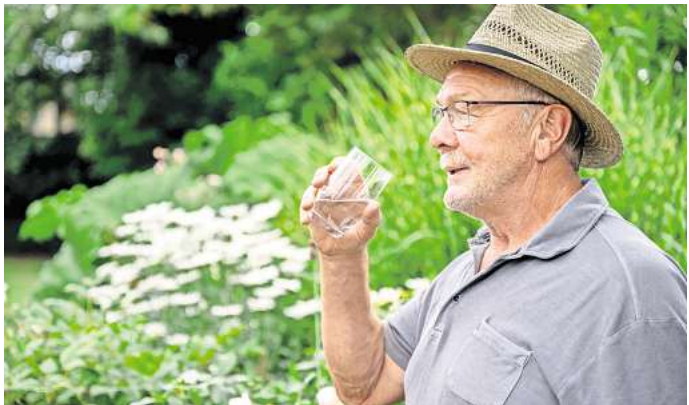
ILLUSTRATION - Trinken nicht vergessen! Mit einfachen Tricks wird der regelmäßige Griff zum Wasserglas selbstverständlich.

Wer es nicht schafft, sich selbst regelmäßig ans Trinken zu erinnern, überlässt diesen Job einfach dem Smartphone. Das BZfE gibt den Tipp, regelmäßige Trink-Erinnerungen einzurichten oder gleich Trink-Apps zu nutzen, die regelmäßig auf sich - oder besser gesagt auf Wasserglas oder Teekanne - aufmerksam machen. Es kann aber auch sein, dass Sie zu wenig trinken, weil Ihnen große Mengen Wasser einfach zu langweilig sind. Daran lässt sich etwas ändern, indem Sie Zitronenstücke, Gurkenscheiben, Beeren, Ingwer oder Minze in die Karaffe werfen, rät das BZfE. Den Ernährungsexperten zufolge kann es sich auch lohnen, verschiedene Mineralwassersor-