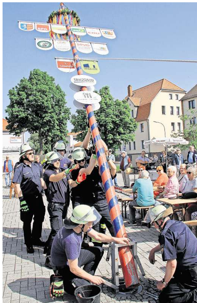
Viel Muskelkraft und ein Seil sind nötig: Mit vereinten Kräften richtet die Ortsfeuerwehr den Maibaum auf dem Kastanienplatz auf und verankert ihn in seiner Halterung.

Alte Tradition zum gemeinsamen Feiern wird fortgesetzt