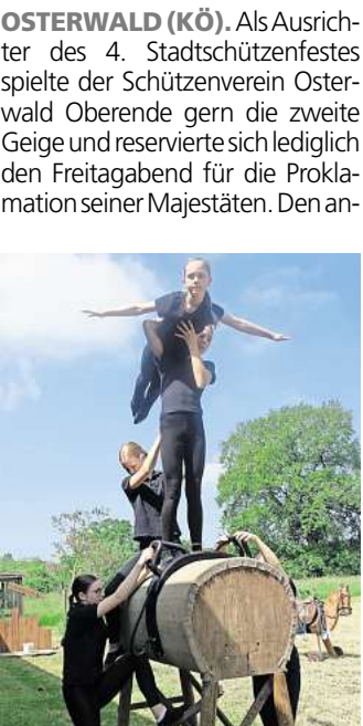
Die Voltigiermädchen des Reit- und Fahrvereins zeigten einige akrobatische Übungen auf dem Holz-Voltigierbock.