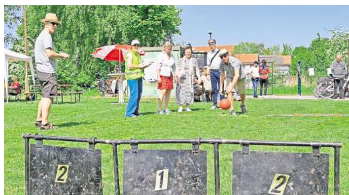
Bei strahlendem Sonnenschein haben sich rund 200 Teilnehmer beim Boßeln auf dem Sportplatz in Velber gemessen.