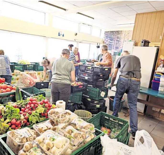
Schon beim Sortieren der Waren haben die Ehrenamtlichen bisher mit dem Platzmangel zu kämpfen.