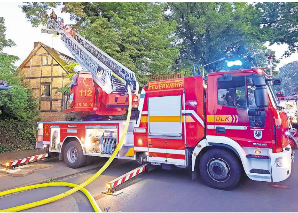
Die Drehleiter der Feuerwehr Seelze unterstützte bei einem Wohnungsbrand in Altgarbsen.

Am Tag zuvor brannte ein Toaster in einer Wohnung in der Bonhoefferstraße, ein Eingreifen der Feuerwehr war aber nicht erforderlich. Am Mittwoch wurde die Sichtschutzwand der