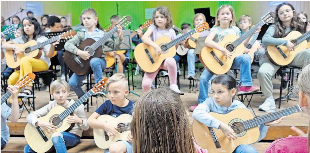
Den Gitarrenschülerinnen und -schülern war das Lampenfieber vor ihrem wohl ersten Konzert anzumerken.