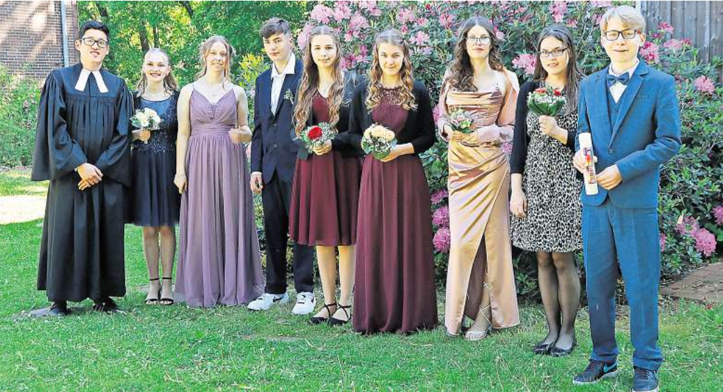
HORST. Am 12. Mai wurden diese Jungen und Mädchen von Pastor Jhi in der Horster Kirche konfirmiert.