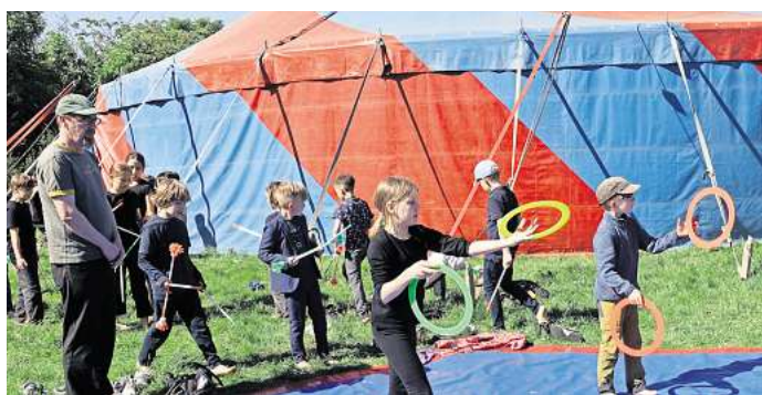
Auch bei der Jonglage mit Ringen und Stäben zeigten sich die Kids auf der Höhe.

Jonglage bis zur Clownerie. Bei der Generalprobe zeigten sich schon die Harenberger Kita-Kinder begeistert. Nicht viel anders erging es den rund 300 Müttern und Vätern, Omas und Opas, die das Zirkuszelt bei der Premiere bis auf den letzten Platz füllten. Immer wieder gab es Szenenapplaus und zum Abschluss Standing Ovation. „Es war nicht nur für die Kinder, sondern auch die Eltern und die Lehrer ein besonderes Erlebnis“, zog Denise Horch ein begeistertes Fazit.