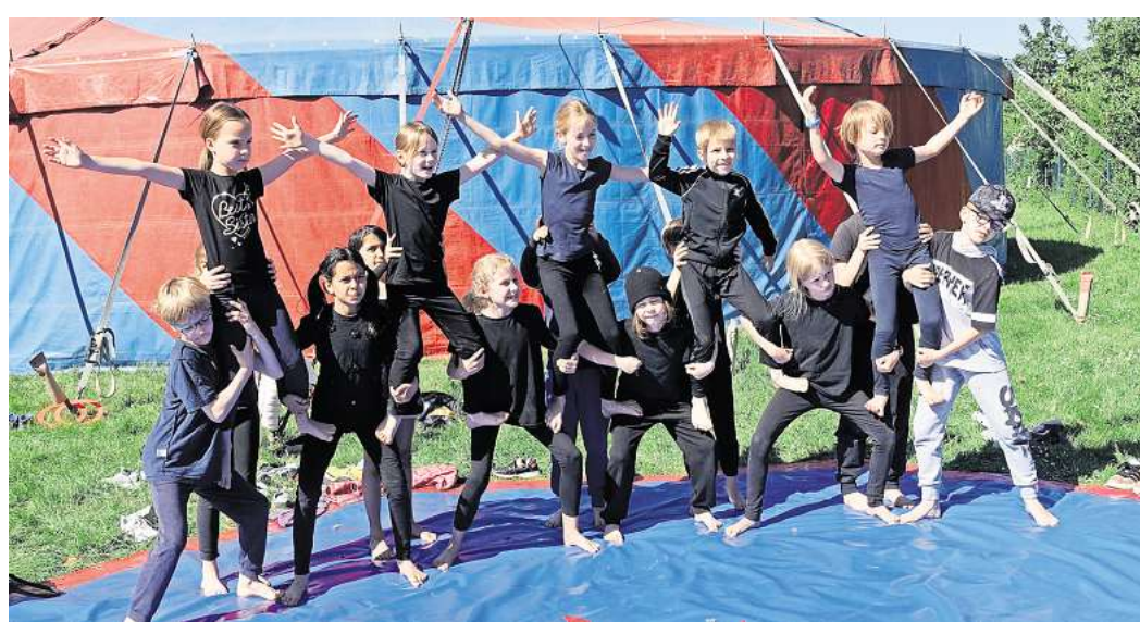
Das Training der Akrobaten mündete in dieser „menschlichen Pyramide“.