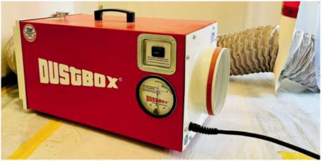
Die DustBox mit eingebauter Filterwechselanzeige, um eine optimale Luftqualität im Bad zu erhalten.

Die klimatisierten Ausstellungsräume in der Pechriede 4 in der Wedemark-Mellendorf sind nach Terminabsprache zu besichtigen. Tel.: 05130/953211 oder www.straussduschen.de .