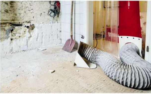
Die DustBox saugt die staubhaltige Luft aus dem Badezimmer und filtert 99,9% des Staubs!

Ein Badumbau ist ein großes Projekt, welches viel Planung und Zeit erfordert. Doch auch die Umsetzung kann mit einigen Herausforderungen verbunden sein, wie beispielsweise der hohe Staubgehalt auf der Baustelle. Alexander Panning und sein Team von Strauß – Duschen aus Glas haben sich mit diesem Problem beschäftigt und bieten seit einiger Zeit den Einsatz eines hoch-effizienten Luftreinigers an. Der DustBox Luftreiniger kann bis zu 99,9 % des Staubs aus der Luft filtern. Dadurch wird die Luftqualität auf der Baustelle deutlich verbessert, was die Arbeit für die Handwerker und die Bewohner der Wohnung erleichtert.