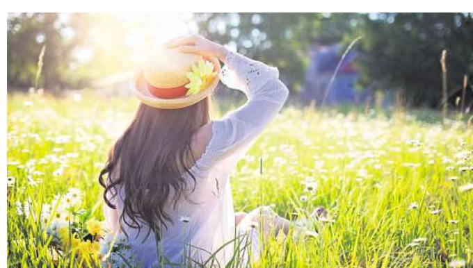
Das Leben unbeschwerter genießen: Fachärzte und Experten raten dazu, die Krebsfrüherkennung zu nutzen.

Jahren alle zwei Jahre auf Hautkrebs untersuchen lassen, ab dem 45. Geburtstag ist die Prostata-Krebsfrüherkennung für sie empfohlen. Diese Untersuchung ist für Männer besonders wichtig! Prostatakrebs macht ein Viertel aller Krebserkrankungen bei Männern aus, so die Information der Niedersächsischen Krebsgesellschaft. Weitere Informationen bietet Weiteres Infomaterial kann unter www.nds-krebsgesellschaft.de/infomaterial.html heruntergeladen werden.