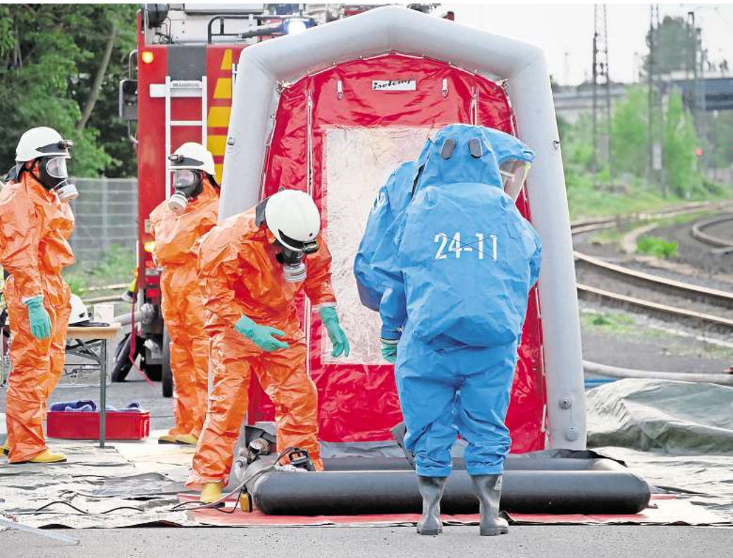
Nach erfolgreichem Einsatz im Chemikalienschutzanzug erfolgte am Dekontaminationsplatz die Dekontamination der eingesetzten Kräfte.

SEELZE. Zur Sicherheit der Bevölkerung führt die Feuerwehr Seelze in regelmäßigen Abständen Einsatzübungen zum Thema „Gefahrgut“ durch. Am 6. Mai fand im Stadtgebiet Seelze am Rande des Rangierbahnhofs eine Einsatzübung des Gefahrgutzugs der Stadtfeuerwehr Seelze statt. Beteiligt waren an dieser Übung die Ortsfeuerwehren Seelze, Almhorst und Letter. Um kurz nach 19 Uhr erfolgte die Alarmierung der Einsatzkräfte mit dem Alarmstichwort „hm1 - VU PKW, zwei Personen vermutlich eingeklemmt“ auf den Notfallbehandlungsplatz des Rangierbahnhofs in der Kanalstraße. Nach der Anfahrt mit Sonder- und Wegerechten zur Einsatzstelle, wurde umgehend mit dem Erkunden des Unfallortes begonnen. Anders als in dem Alarmstichwort beschrieben, stellte sich die Lage vor Ort als ein Unfall mit Gefahrgut und Menschengefährdung heraus. Ein PKW war samt Anhänger verunfallt, aus einem Rohrleitungssystem mit einigen Leckagen drang ein zunächst unbekannter Stoff aus. Ferner konnte Flüssigkeitsaustritt aus dem verunfallten Anhänger festgestellt werden. Zudem befand sich unmittelbar am Unfallort zwei verletzte Personen, welche sich nicht selbst retten konnten. Nach der Absperrung des Gefahrenbereichs wurde eine Sofort-Dekontamination errichtet und personell besetzt, der Angriffstrupp leitete die Menschenrettung ein und übergab das Unfallopfer an den Ret-