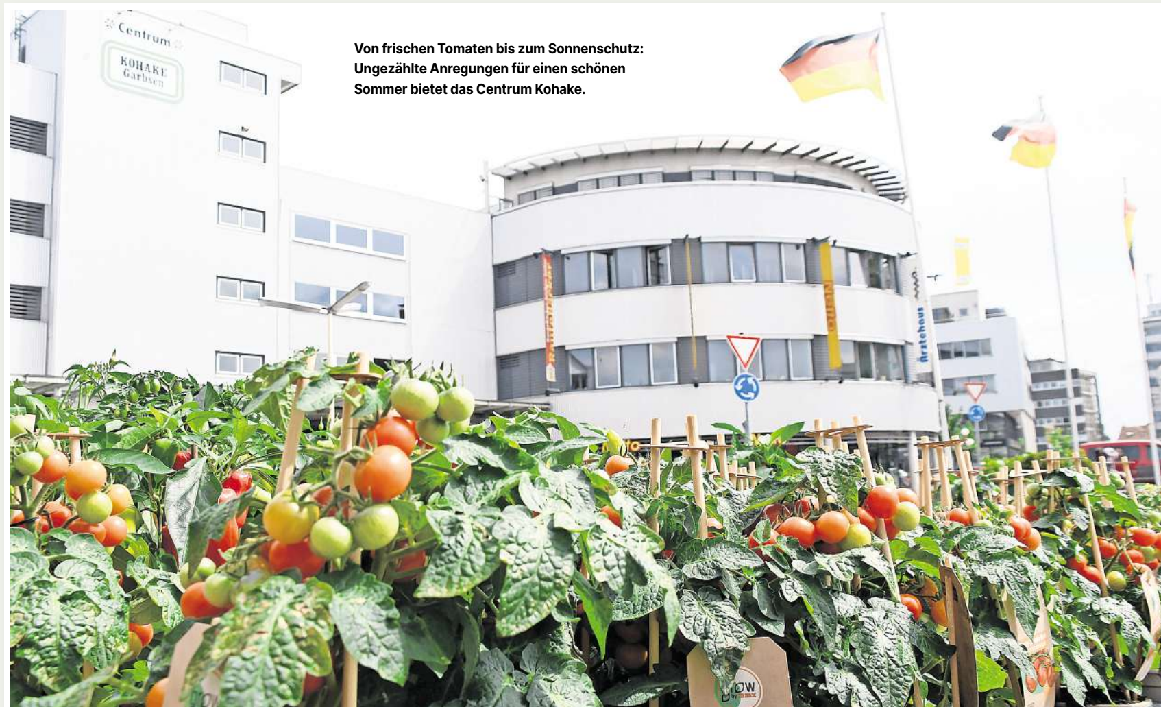
Von frischen Tomaten bis zum Sonnenschutz: Ungezählte Anregungen für einen schönen Sommer bietet das Centrum Kohake.

Gastronomie und Snack-Angebote versüßen den Aufenthalt oder sorgen für eine herzhafte Stärkung. Also herzlich willkommen im Centrum Kohake. Von Ärztehaus bis Nahversorger, von Fitness bis Sanitätshaus sind attraktive Angebote im Herzen der Stadt versammelt.