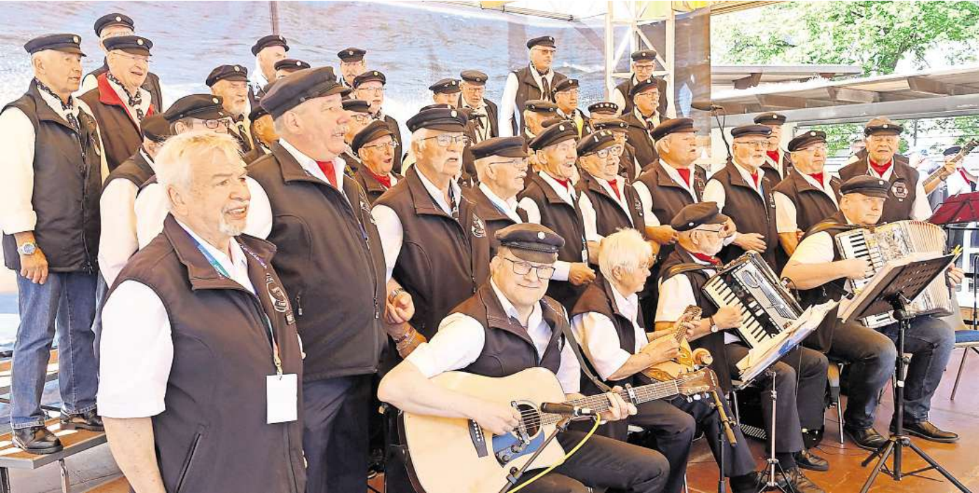
Zum 28. Mal ist der Shanty-Chor-Lohnde (unser Foto) Gastgeber des Seelzer Shanty-Festivals.