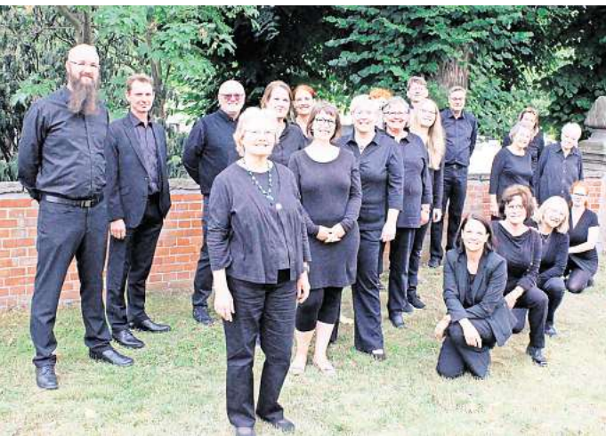
Der Kammerchor Schloß Ricklingen freut sich auf die bevorstehenden Konzerte.

SCHLOSS RICKLINGEN. 40 Jahre Kammerchor Schloß Ricklingen – das ist schon etwas Besonderes und möchte entsprechend gewürdigt werden. Seit seiner Grundsteinlegung im Jahr 1984 sind es das höhere Niveau und die Vielfalt der präsentierten Stücke, Stile und Arrangements, die den Kammerchor in besonderem Maße auszeichnen. Er setzt sie in jedem seiner Konzerte ein und lässt damit spannende Kontraste entstehen, die dem Zuhörer eine überraschende, abwechslungsreiche und kurzweilige Unterhaltung garantieren. Klassische Chorwerke aus der geistlichen und weltlichen Chorliteratur werden ebenso erarbeitet, wie auch Musik aus den Genres Gospel, Pop oder Rock. Dieses besondere Ereignis möchte der Kammerchor Schloß Ricklingen unter der Leitung von Philip Lehmann Anfang Juni und Ende August mit seinen Zuhö-