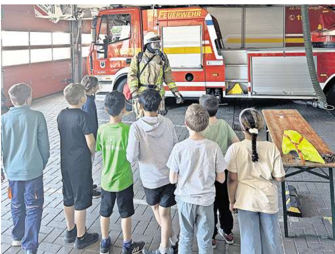
Die Brandschutzerziehung für Schülerinnen und Schüler aber auch für Kindergartenkinder ist ein wichtiges Thema der Feuerwehr Seelze.

und Ausrüstung für den Brandeinsatz. Natürlich ist die Beantwortung der Frage „Welches Fahrzeug fährt zu welchem Einsatz?“ ganz wichtig und wer wollte, durfte auch in der Mannschaftskabine Platz nehmen. Mit der Kübelspritze selbst einen „Brand löschen“ in Form von Dosenzielspritzen gehörte zum praktischen Teil des Besuchstages so wie die Verständigung untereinander mit Sprechfunkgeräten. Am letzten Tag konnten die Grundschüler durch Zufall noch live miterleben, wie die ehrenamtlichen Kräfte zu einem echten Feuerwehreinsatz abrücken.