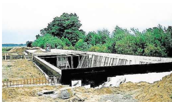
Dieses Foto zeigt einen Blick auf die gewaltigen Ausmaße des Kellers, in dem sich heute die Kleinkaliber-Sportanlage befindet.

Im Laufe der Jahre entwickelte sich das Haus zum idealen Treffpunkt der Mitglieder, die Jahreshauptversammlungen fanden