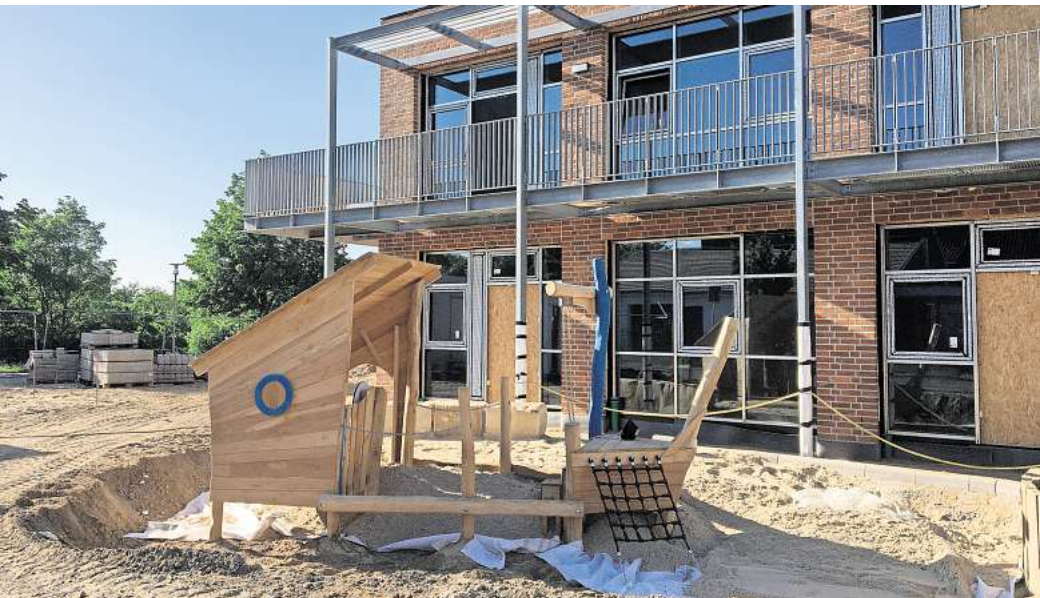
Die Betreuung in der Kita Steinwartskamp kann voraussichtlich erst im Januar 2025 beginnen.

In Horst befindet sich aktuell die Kindertagesstätte Steinwartskamp mit 30 Krippen und 50 Kindergartenplätzen im Bau. Bedingt durch Verzögerungen bei der Anlieferung maßangefertigter Fenster sind hier weitere Gewerke in Verzug geraten. Geplant ist nunmehr, das Gebäude im Dezember an die AWO zu übergeben und das Betreuungsangebot im Januar 2025 zu starten. Die Verwaltung hat dies in der Sitzung des Ortsrates Horst