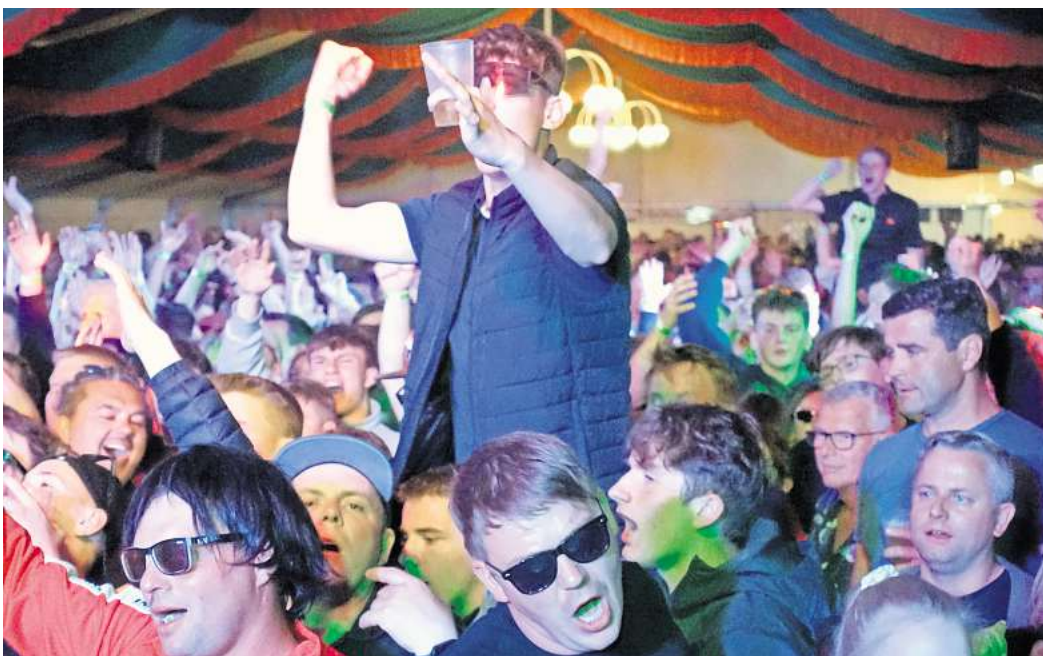
Ikke Hüftgold und seine musikalischen Begleiter werden die Besucher im Festzelt wieder zum Toben bringen.

Feierstimmung herrscht schon bei der Eröffnung des Festes am Freitag, 7. Juni. Rund 160 Teilnehmer am Firmenschießen feiern der Siegerehrung entgegen und werden Sieg und Platzierungen mit Anschluss in der Meer Radio CLUB Night mit den DJs Pinto und Marc Reason feiern. Der Samstag steht zunächst im Zeichen der Schützen, die ab 14.40 Uhr ihre Majestäten pro-