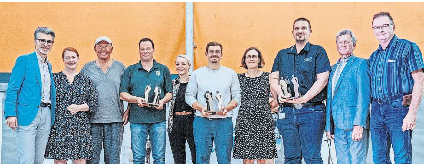
Die Preisträger 2023 gemeinsam mit Bürgermeister Alexander Masthoff (von links), der stellvertretenden Bürgermeisterin Nadine Pfeiffer, Künstler Wolfgang Tiemann und den stellvertretenden Bürgermeistern Wilfried Nickel (Zweiter von rechts) und Frank Joosten (Erster von rechts).

Ab sofort können Vorschläge für die Nominierung der nächsten Preisträgerinnen und Preisträger bei der Stadt unter www.seelze.de/seelzer-dialog , per mail an seelzerdialog@stadt-seelze.de , telefonisch im Büro für Ehrenamt unter (05137) 828179 oder per Post an das Rathaus Seelze, Abteilung Büro des Bürgermeisters, Rathausplatz 1, 30926 Seelze eingereicht werden. Auf der Home-