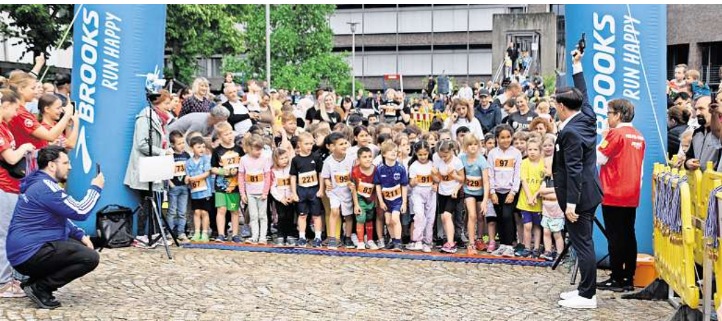
Sportfest auf dem Rathausplatz: Beim Garbsener City-Lauf 2024 waren auch jede Menge Schulklassen am Start.

Für die Sicherheit der Läuferinnen und Läufer war ebenfalls gesorgt. Die Polizei sperrte die Straßen zwischen Rathaus und Berenbosteler See entlang der Strecke ab. Das ignorierte allerdings ein Autofahrer, der sein Fahrzeug mitten auf der Route parkte und mehrfach ausgerufen werden musste. Auf dem Rathausplatz kümmerten sich Ehrenamtliche des DRK Garbsen um kleinere und größere Verletzungen. „Bisher haben wir ein paar aufgeschlagene Knie versorgt, weil Kinder nach dem Start gestürzt sind“, berichtete Zugführer Alan Orant und fügte hinzu: „Zum Glück war das bisher alles halb so wild.“