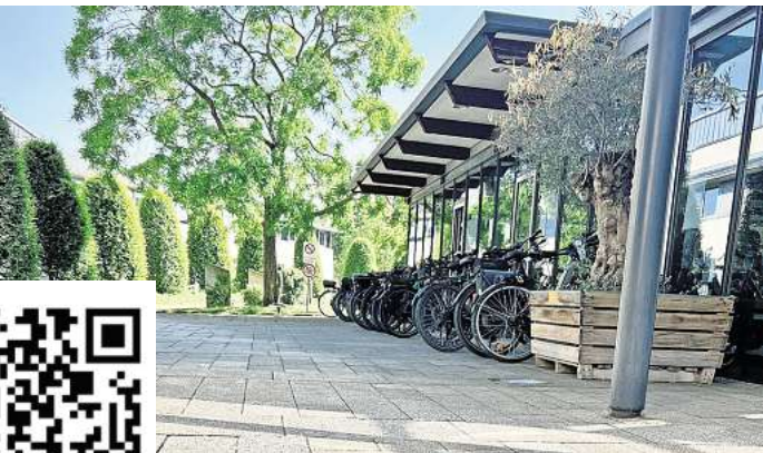
Viel los vor der Rathauskantine: Fahrradinteressierte Bürgerinnen und Bürger zeigen großes Interesse am Runden Tisch Radverkehr.