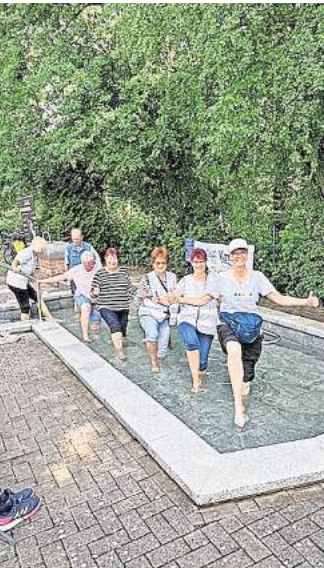
Die Besucher nutzen gleich bei der Eröffnung die Möglichkeit zu einem Gang durchs kühle Nass.

GARBSEN. Zahlreiche Besucher fanden am 25. Mai, den Weg in den Stadtpark zur Wassertretanlage des Kneipp-Vereins. Hier hatten sich circa zehn große und kleine fleißige Helfer im Rahmen