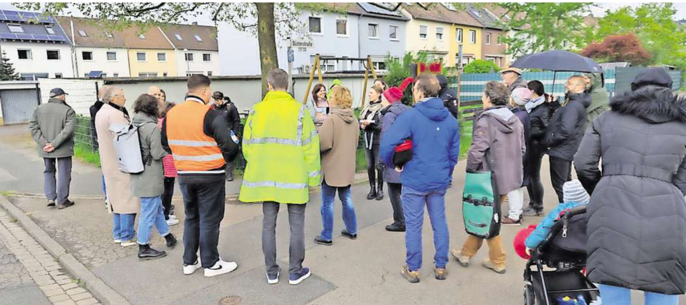
Bei der Begehung im April diskutieren die Teilnehmenden über den Fußverkehr in Harenberg. Für Dienstag, 11. Juni, um 16 Uhr lädt die Stadt Seelze nun zur Abschlussveranstaltung des Fußverkehrs-Checks im Nebenraum der Mehrzweckhalle Harenberg ein.