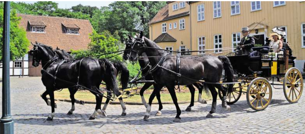
Auf dem Gut Heitlingen werden am Samstag die Gespanne aus verschiedenen Ländern vorgestellt.

Am Sonntag, 16. Juni, geht es ab 9 Uhr mit der Geländefahrt über eine Strecke von circa 15 Kilometer, die durch Heitlingen, Resse und Osterwald führt, weiter. Am Osterwalder Gießelmannhof kann man die Gespanne ab circa 9.45 Uhr bestaunen. Dort müssen die Fahrer eine Fahraufgabe absolvieren. Eine Moderaterin ist vor Ort, die den Zuschauern die Gespanne erklären wird.