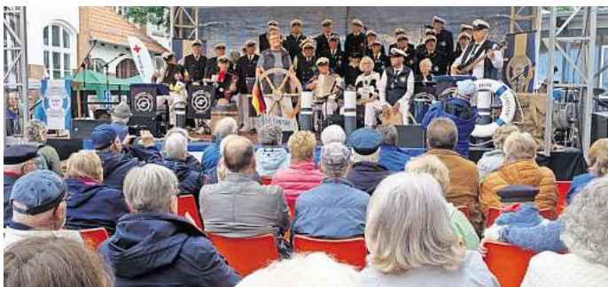
Die große Fanggemeinde des Shanty-Chor-Lohnde gab sich auch beim 28. Shanty-Festival ein Stelldichein.