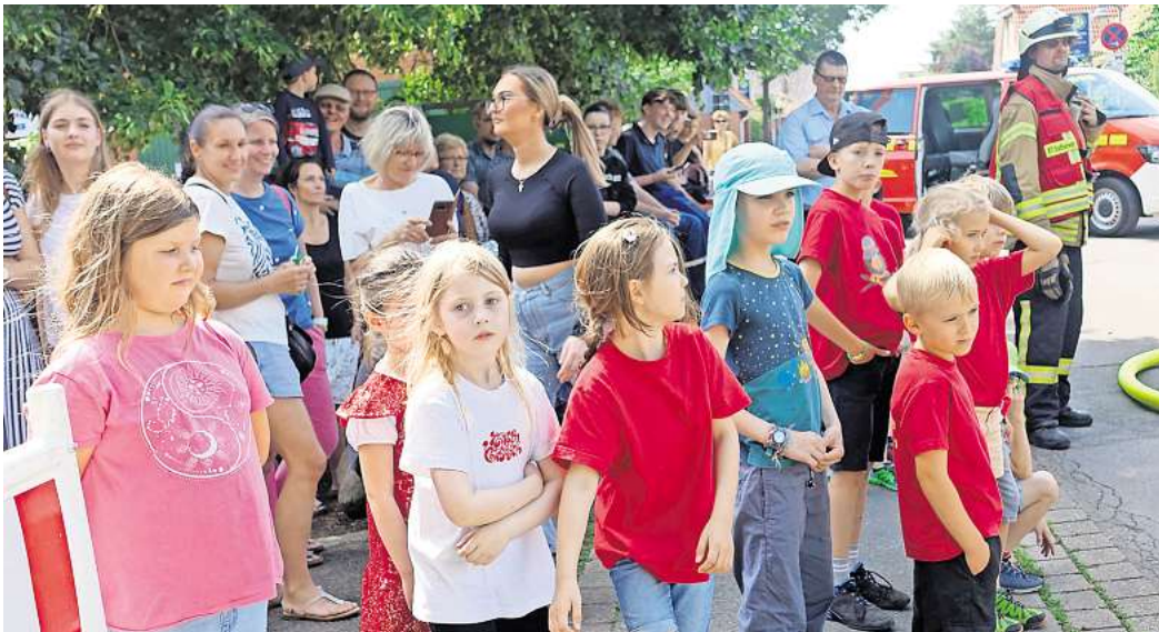
Zu den interessierten Zuschauern bei der Einsatzübung gehörten auch einige der „Löschlöwen (in den roten Shirts).