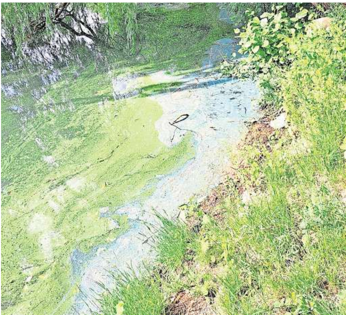
Blualgalen im Schwarzen See - Baden ist im Schwarzen und Berenbosteler See ganzjährig verboten.

Die beiden ehemaligen Ton-gruben Schwarzer See und Berenbosteler See sind für das Baden und die Nutzung mit Booten, Stand-Up-Paddels, Mo-