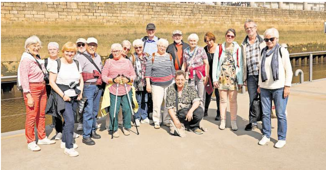
Einen interessanten Tagesausflug erlebten die Mitglieder des berenbostel chor ad libitum in Bremen.

An Bord der „HANSEAT“ konnten die Besucher dann Bremen von der Wasserseite erleben. Besonders beeindruckt waren die Besucher von