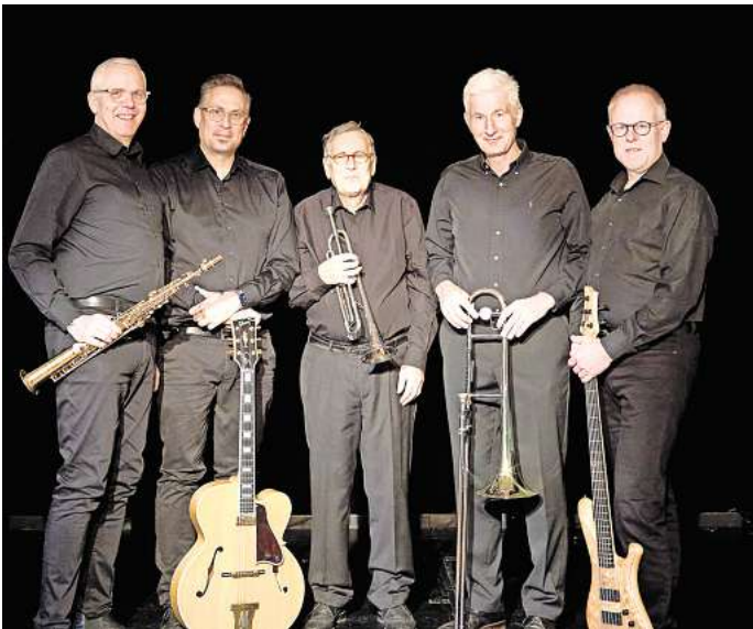
Die „Old Virinny Jazzband“ tritt am 23. Juni im Werner-Baermann-Park in Berenbostel auf.

Karten für das Konzert von Tuto Azul kosten 20 Euro, für Vereinsmitglieder 15 Euro und für Schüler und Studenten 5 Euro. Karten gibt es im Vorverkauf per E-Mail unter tickets@jazzclub-garbsen.de , im Internet auf www.jazzclub-garbsen.de und an der Tages- beziehungsweise Abendkasse. Nähere Informationen, auch zum weiteren Programm, gibt es auf www.jazzclub-garbsen.de .