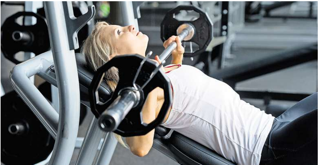
ILLUSTRATION - Schlechte Nachrichten für Fitnessfans: Die Mitgliedschaft im Studio zählt für die Krankenversicherung nicht als Präventionskurs - und wird daher nicht gefördert.

BERLIN. Auch wenn die gesetzliche Krankenversicherung die Teilnahme an bestimmten Kursen zur Entspannung oder Bewegung finanziell unterstützt: Für Mitgliedsbeiträge in Sportvereinen, Fitnessstudios und ähnlichen Einrichtungen gibt es laut GKV-Spitzenverband keine Förderung. Gleiches gilt für Massagen oder Trainingsprogramme mit einseitigen körperlichen Belastungen.