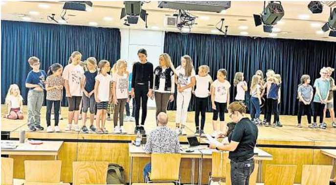
Die Chorklassen der Grundschule Harenberg, geleitet von der Musikschule Seelze, präsentieren ihr Familienmusical „Tuishi pamoja – Eine Freundschaft in der Savanne“.