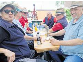
Diese sechs Treckerfreunde aus Steinhude nahmen nach der zeitraubenden Anfahrt erstmal eine Vesper ein.

Grund zur Freude hatten auch die Veranstalter, denn der vor Ort gebackene Zuckerkuchen