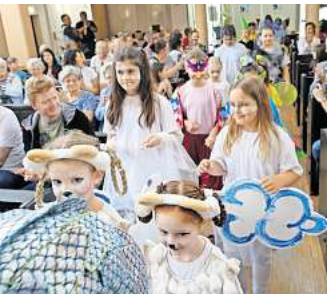
Schon beim Einzug in die Kirche war bei den jungen Akteuren kaum Lampenfieber zu spüren.

Der Verkehrsunfalldienst hat die Ermittlungen wegen fahrlässiger Körperverletzung infolge eines Unfalls aufgenommen und bittet mögliche Zeugen, sich unter der Telefonnummer (0511) 1091888 zu melden.