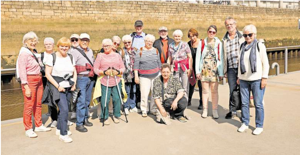
Einen interessanten Tagesausflug erlebten die Mitglieder des berenbostel chor ad libitum in Bremen.

An Bord der „HANSEAT“ konnten die Besucher dann Bremen von der Wasserseite erleben. Besonders beeindruckt waren die Besucher von