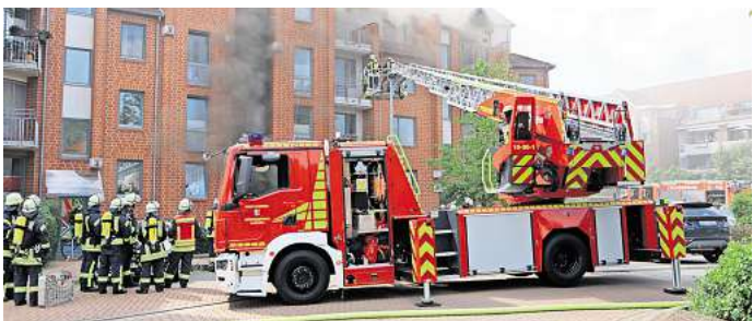
Dichter Brandrauch drang aus dem Haus im Kardinal-von-Galen-Ring.

Jaeschke, der sich freut, ein weiteres Jahr in Havelse spielen zu können.