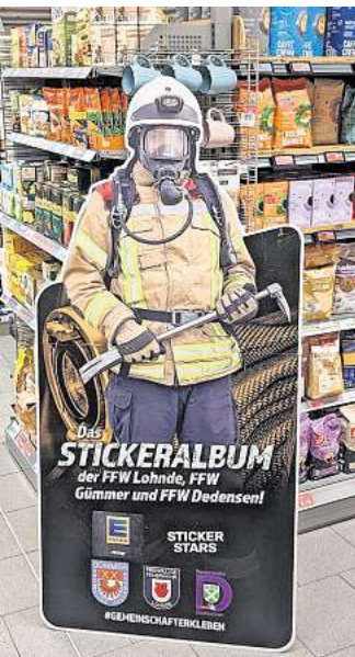
Am 15. Juni startet der Verkauf des Stickeralbums der Freiwilligen Feuerwehren bei EDEKA Jung.

Am Samstag, 15. Juni, findet ab 10 Uhr eine Auftaktveranstaltung zum Verkaufsstart des Stickeralbums mit buntem Kinderprogramm auf dem Gelände von EDEKA Jung statt.