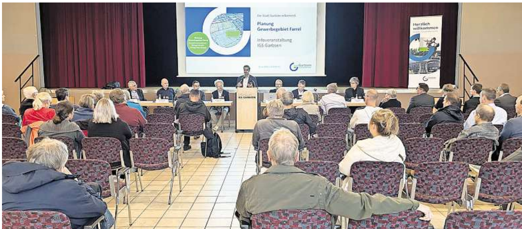
Zahlreiche Garbsenerinnen und Garbsener nutzten die Gelegenheit, sich über das Gewerbegebiet Farrel zu informieren.