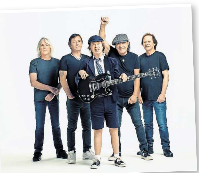
Let there be rock: AC/DC rocken auf dem Messegelände in Hannover.

nis beim Kartenkauf haben – so wie früher.“ Das würde AC/DC sicher gefallen. In der Stadt befinden sich diese an der Langen Laube 10 und im Theater am Aegi. In Langenhagen gibt es eine Geschäftsstelle im CCL, in Neustadt Am Wallhof 1 und in Burgdorf an der Marktstraße 16. Ausschließlich die Geschäftsstelle an der Langen Laube hat auch sonabends geöffnet. Die genauen Öffnungszeiten können Sie auf www.tickets.haz.de/vorort nachlesen. Eine Karte kostet 150,35 Euro. Schnell sein lohnt sich. Was die glücklichen Ticketbesitzerinnen und -besitzer beim Konzert erwartet: Eine energiegeladene Show mit AC/DC-Klassikern wie „Hells Bells“, „Highway To Hell“, „For Those About To Rock“, „Thunderstruck“, „Whole Lotta Rosie“, „TNT“, dazu Böller und Pyro und vieles mehr. Neben Gründungsmitglied und Gitarrist Angus Young wird der 76-jährige Johnson, der 1980 den legendären Bon Scott am Mikrofon ablöste, als dienstältestes AC/DC-Mitglied auf der Bühne stehen. Außerdem sind Rhythmusgitarrist Stevie Young, Schlagzeuger Matt Laug und am Bass voraussichtlich Chris Chaney von Jane's Addiction, der die Nachfolge von Cliff Williams antritt, dabei. Die Tour ist nach der 2020 erschienenen Platte „Power up“ benannt, die in 21 Ländern Platz Eins der Albumcharts erreichte.