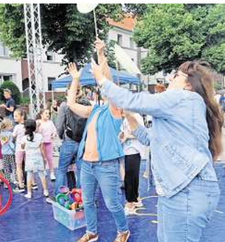
„Beim Mitmachen“ waren auch viele Erwachsene nicht mehr zu bremsen. Die einen übten das Drehen eines Tellers auf einem Stab, andere wollten sich am Hula Hoop-Reifen versuchen.

LETTER (KÖ). Am vergangenen Freitag bereitete das lettersche Flohmarkt-Team den Kindern