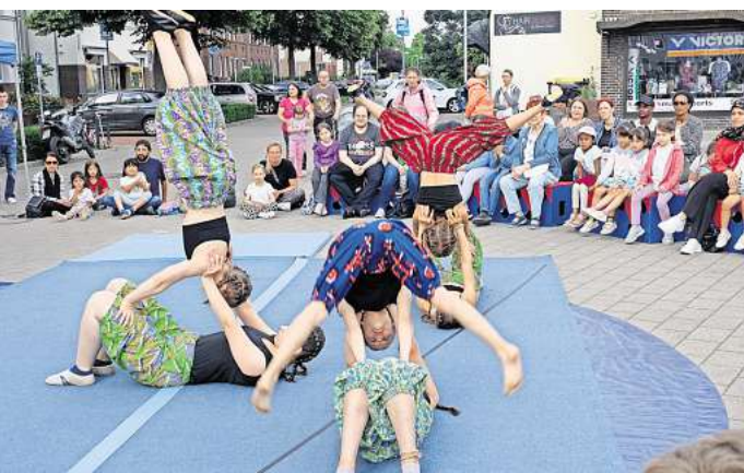
Im weiten Rund der Manege staunen die Zuschauer über diese Bodenakrobatik.

Darunter litt aber nicht die Begeisterung der Besucher, die staunend die Kunststücke der 25 jungen Artisten verfolgten. Ob am Boden mit Flugrollen über mehrere Körper oder mit Salti, mit Kunststücken auf Einrädern und Laufkugeln oder in der Luft am Aerial Hoop: Die Präzision und die Leichtigkeit der Vorführungen begeisterten und