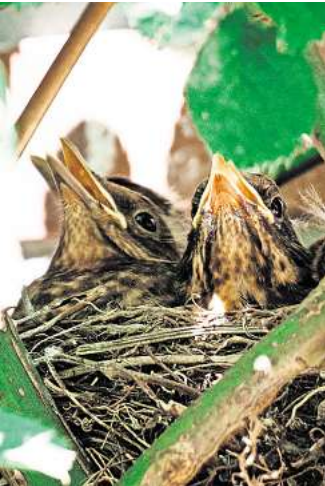
Amselküken im Nest.

REGION.. Es blüht und grünt überall: Bäume, Hecken, Sträucher und Co. schießen in die Höhe. Da mag es dem einen oder der anderen Gartenbesitzer hinsichtlich Pflege- und Rückschnitt durchaus in den Fingern kribbeln. Aber Vorsicht: Vor dem Griff zur Schneidemaschine sollte die Nist- und Brutzeit von Vögeln beachtet werden. Diese beginnt jedes Jahr am 1. März und dauert bis zum 30. September. In dieser Zeit sind laut Bundesnaturschutzgesetz Fällungen und Schnittmaßnahmen grundsätzlich verboten, damit die Tiere beim Nestbau sowie beim Brutgeschehen nicht gestört werden. Die Brut- und Setzzeit dauert in Niedersachsen offiziell vom 1. April bis zum 15. Juli an.