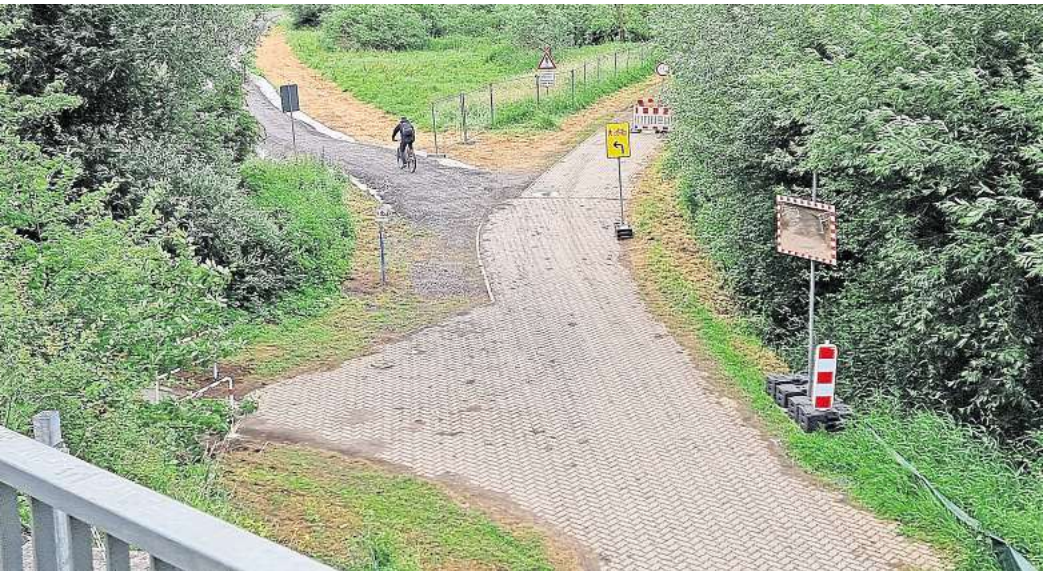
Die Deutsche Bahn plant, die Eisenbahnüberführung über den Stichkanal Hannover-Ahlem östlich von Letter zu erneuern. Wegen der beginnenden Einrichtung der Baustelle wird der Radverkehr im Umfeld der Brücke vom bestehenden Wirtschaftsweg aus auf rund 300 Metern über eine neu geschaffene Strecke umgeleitet.

Weitere Informationen zur Erneuerung der Eisenbahnüberführung über den Stichkanal finden sich im Internet auf der Seite www.bauprojekte.deutschebahn.com/p/hannover-ahlem-stichkanal-eue .