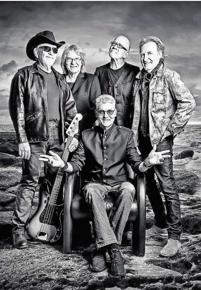
Green River Gang.

Stadtmagazin für Hannover magaScene Viele weitere, spannende Neuigkeiten aus der lokalen Kulturszene finden Sie in der aktuellen Ausgabe unseres Partnerme-