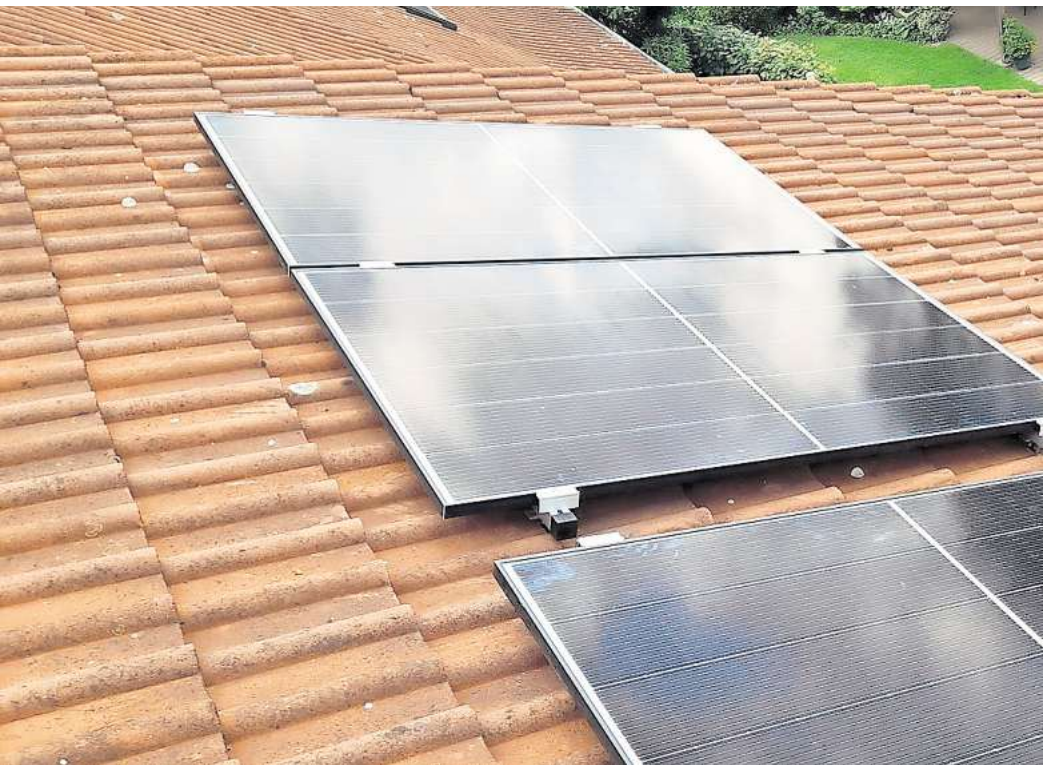
Die Stadt Seelze bezuschusst weiterhin den Kauf und Einbau von Balkon-Solaranlagen mit bis zu 150 Euro pro Haushalt. Neue Anträge sind bis zur Ausschöpfung der bereitgestellten Fördersumme möglich. Aktuell ist diese zu rund zwei Dritteln aufgebraucht.

„Balkon-Solaranlagen verringern den Kohlendioxid-Ausstoß im Stadtgebiet und helfen damit effektiv beim Klimaschutz“, betont Bürgermeister Alexander Masthoff. Die Förderung beinhaltet einen Zuschuss von maximal 150 Euro pro Haushalt. „Sie kann von allen Privatpersonen, die im Stadtgebiet Seelze ihren Erstwohnsitz haben, beantragt werden“, erläutert der Bürgermeister. Dies