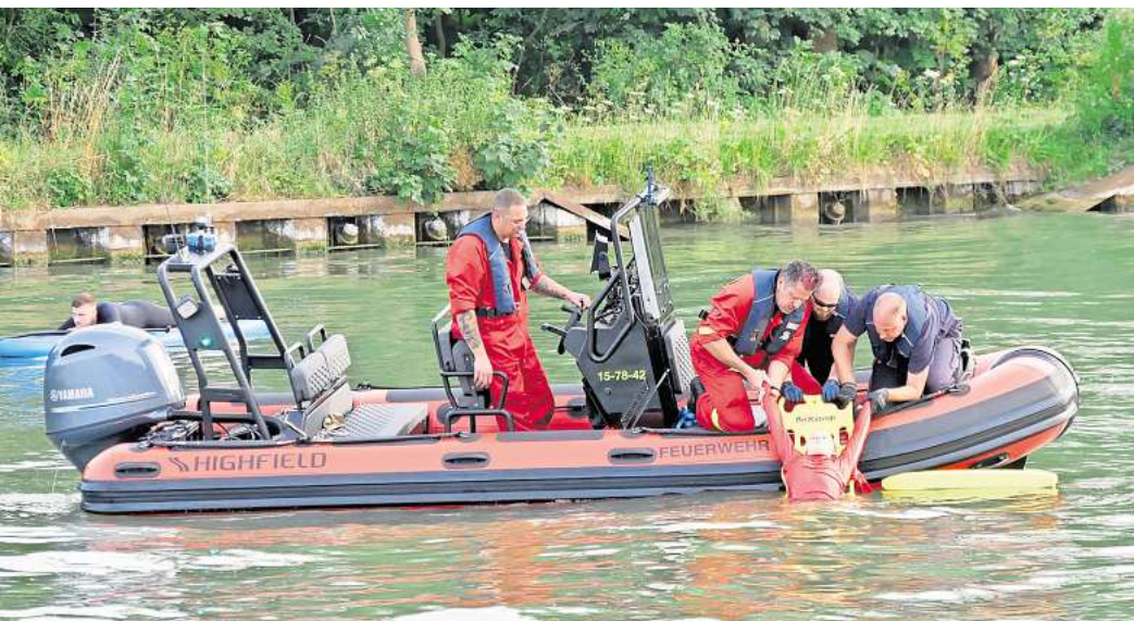
Alle Personen im Wasser konnten schnell gerettet werden.

Im Vorfeld beschäftigten sich die Einsatzkräfte der Ortsfeuerwehr Seelze an vergangenen Dienstabenden unter anderem mit verschiedenen Techniken, sowie Verhaltensweisen bei Wasserrettungseinsätzen und sprachen zudem über Erfahrungen bei vergangenen Einsätzen