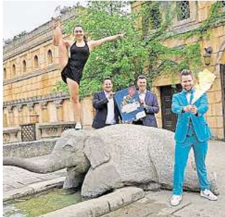
Akrobatik, Comedy und Zauberkunst: Der Zoo Hannover lädt ein zu magischen Nächten.

HANNOVER. Im Annabad erklingen am Freitag, 16. August, ab 21 Uhr Soul-Folk-Songs mit berührenden Texten. Mit ihrer klaren warmen Stimme kehrt Singer-Songwriterin Nina Freckles ihr Innerstes nach außen. Es geht um große Fragen: die großen Fragen des Lebens: Wer bin ich? Wer will ich sein? Wo ist mein Platz in dieser Welt? Begleitet von ihrer Band und oft ironischen Anekdoten aus ihrem Alltag, führt sie durch jazzy Harmonien, verträumte Melodien mit treibend folkigen Rhythmen und einer Prise Groove oben drauf. Für das Konzert im Kleefeld Bad, Haubergstraße 17, ist der Eintritt frei, Spenden sind jedoch gern gesehen. RED