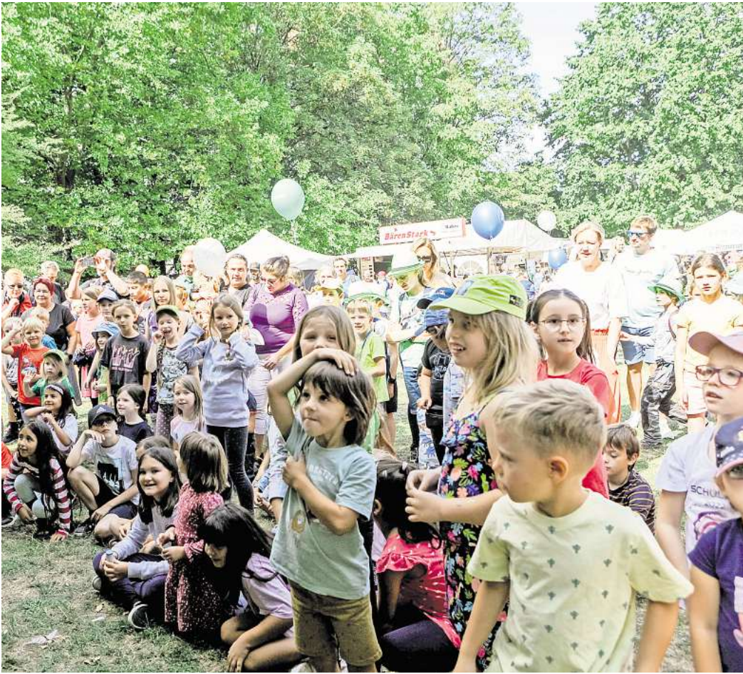
Das Einschulungsfest mit einem Programm rund um Verkehrssicherheit hat Tradition.

Das komplette Programm mit allen Aktionen ist kostenlos, es läuft von 11 bis 17 Uhr. Der Maschpark liegt in direkter Nachbarschaft zum Neuen Rathaus. Und natürlich kann man dort bei dem Familienfest auch die Einschulung gemeinsam gebührend feiern, Picknickdecken ausbreiten und sich kulinarisch versorgen lassen.