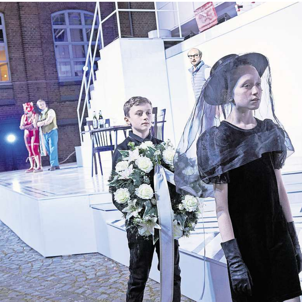
Biedermann und die Brandstifter im August im Freien erleben.