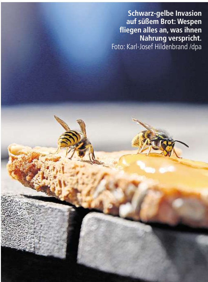
Schwarz-gelbe Invasion auf süßem Brot: Wespen fliegen alles an, was ihnen Nahrung verspricht.

Ätherische Öle in Duftkerzen oder Duftlampen sollen Wespen hingegen abschrecken. Probieren Sie es doch mal mit ätherischen Ölen wie Teebaum- oder Nelkenöl, die Sie in ein kleines Schälchen geben und in der Nähe des Esstisches oder des Grills platzieren. Ein anderer Tipp: Auf Räucherstäbchen setzen. „Den hiervon ausgehenden Geruch mögen Wespen nicht und bleiben daher fern“, sagt Breitzkreuz. Auch der Duft von frischem Lavendel soll Wespen auf Abstand halten. Als Strauß gebunden kann man Lavendel etwa neben dem Esstisch aufhängen.