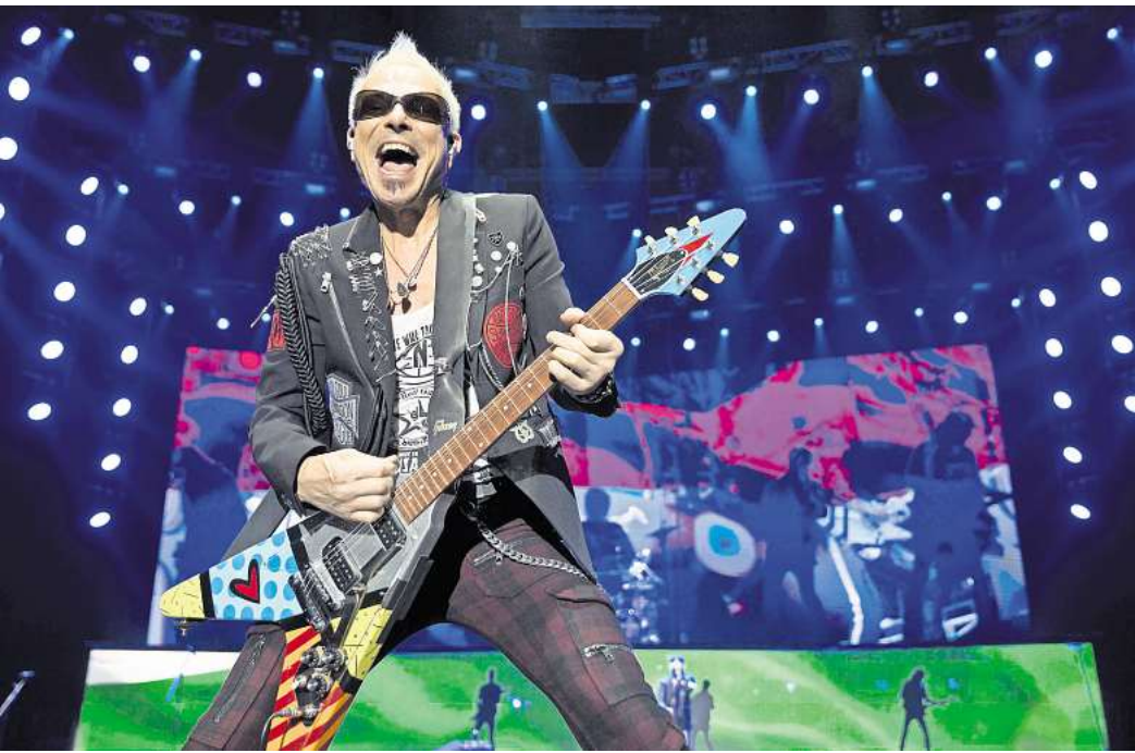
Scorpions-Gitarist Rudolf Schenker ist mal nicht auf Welttournee, sondern besucht die NP am Maschsee.

Der Dienstag mit Moderator Jan Sedelies: Um 18 Uhr beginnt der Startup-Pitch-Event „Höhle der Karpfen“. Aufstrebende GründerInnen präsentieren ihre Ideen und visionären Konzepte vor einer hochkarätigen Jury und einem begeisterten Publikum. Alle streiten um den Goldenen Karpfen. Kreative Köpfe gestalten die Zukunft. Ein Abend zum Netzwerken mit Investoren, Unter-