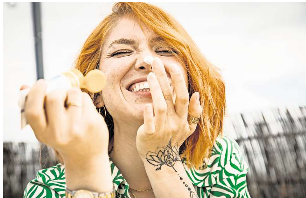
Sonnencreme ist längst nicht gleich Sonnencreme: Es gibt verschiedene UV-Filter - mit unterschiedlichen Auswirkungen auf die Umwelt.

Dohrmann von der Zeitschrift «Öko-Test» geht man bei diesen Produkten davon aus, dass sie nicht nur einen negativen Einfluss auf die Umwelt, sondern auch auf den Menschen haben. Etliche chemische UV-Filter stehen im Verdacht, hormonell wirksam zu sein. Die mineralischen Filter wirken anders: «Sie dringen nicht in die Haut ein, sondern bleiben nach dem Eincremen auf der Hautoberfläche liegen und bilden dort eine Art Schutzfilm, der die UV-Strahlen wie ein Spiegel reflektiert», sagt Dohrmann. Produkte mit mineralischen Filtern gelten als weniger schädlich für die Umwelt und besser verträglich für Menschen.