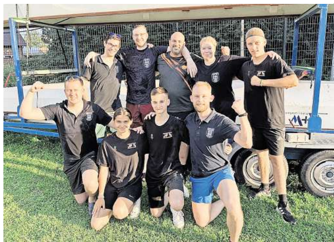
Siegesgewiss: Die Fire Dragons belegten im vergangenen Jahr den zweiten Platz beim Fun-Cup, diesmal soll es der erste werden.

vorher erreicht wurde, steht der Sieger sofort fest. Wer gegen wen antritt, entscheidet sich eine Woche vor der großen Regatta. Neu in diesem Jahr: Alle Teilnehmenden, die Lust dazu haben oder von außerhalb kommen, können auf der hinteren Wiese des Freibades ihre Zelte aufschlagen und dort übernachten.