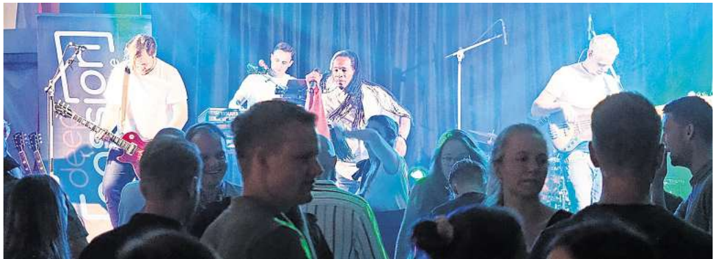
Die Live-Band „Deep Passion“ sorgte bis in den frühen Morgen für Stimmung und eine volle Tanzfläche.

Sie dankte der Dorfgemeinschaft mit den Vereinen DRK, Gesangsverein, TuS Harenberg sowie der Kirchengemeinde St. Barbara und der Ortsfeuerwehr für die immense Arbeit, die in die Organisation des Festes gesteckt wurde, sowie für die besonderen Angebote für die Besucher.