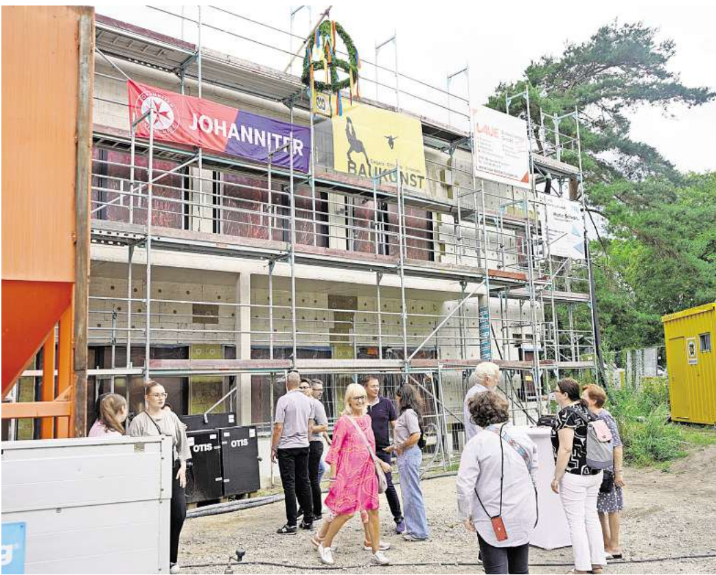
Die neue Kita Uferzeile in Hannover-Misburg: 80 Kinder sollen hier ab August kommenden Jahres einen kreativen Ort zum Spielen und Wachsen finden.