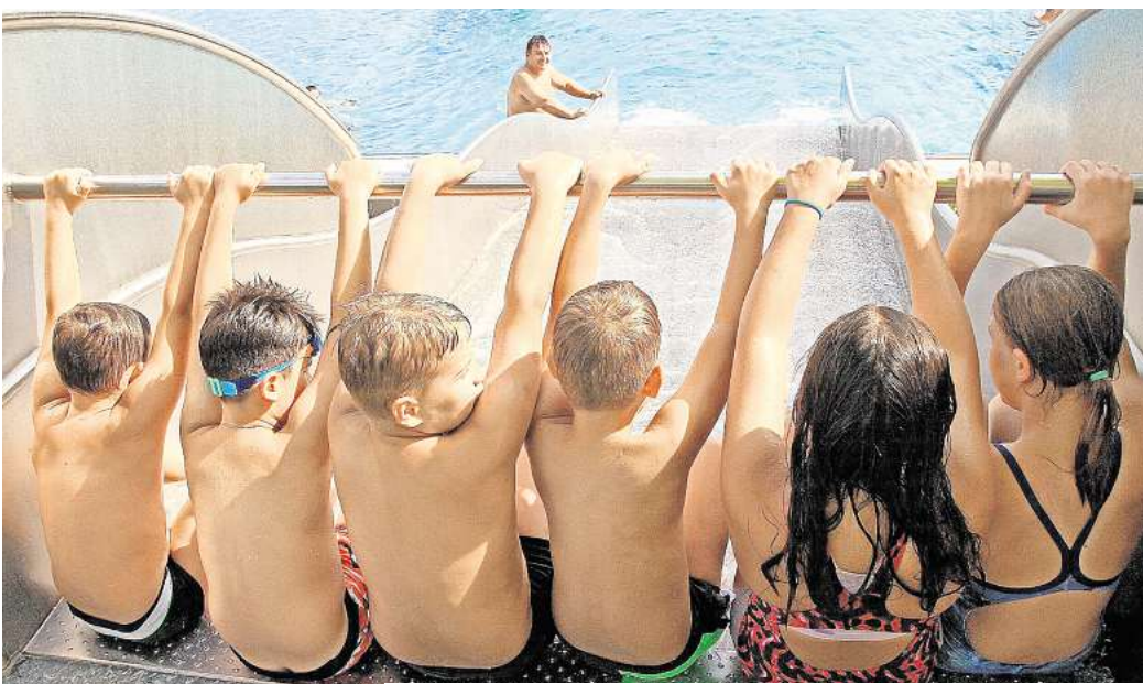
Bei der Poolparty war auch die große Wasserrutsche immer wieder ein Anziehungspunkt für die vielen Kinder.

Das Sommerwetter sorgte dafür, dass sich die Badegäste überwiegend in den Außenbecken tummelten. Gut nachgefragt waren hier insbesondere Wassertennis, Stand-Up-Paddling, Walk on Waterball und Luftmatratzen-Rennen. Bei allen Badegästen kam die Poolparty gut an und sorgte für jede