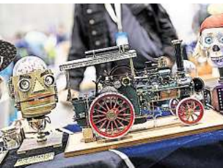
Von witzigen Gadgets bis hin zu nützlichen Erfindungen gibt es viel zu entdecken.