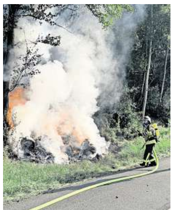
Einsatz auf der A2: Feuerwehrleute löschen einen brennenden Audi.

Eine Anmeldung ist ab dem 19. August bei der Abteilung Jugend und Integration unter Telefon (05131) 707572 oder -578 möglich.