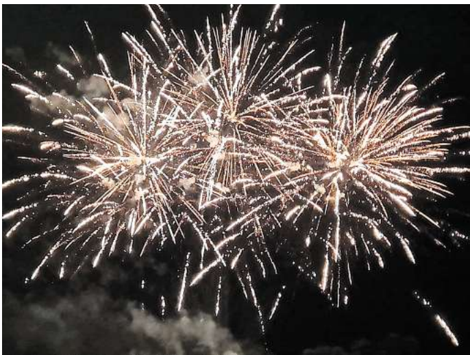
HARENBERG (KÖ). Ein grandioses Feuerwerk war der Höhepunkt der 804-Jahr-Feier im Seelzer Ortsteil Harenberg, das von der Dorfgemeinschaft ausgerichtet wurde. Zudem wurde das 75-jährige Bestehen des DRK-Ortsvereins und der 135. Geburtstag der Ortsfeuerwehr gebührend gefeiert. Mehr dazu im Innern dieser Ausgabe.