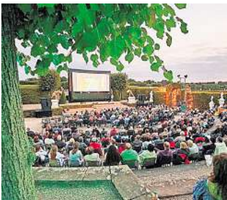
Kino unter freiem Himmel.

Am Sonnabend, 17. August, feiert „Bob Marley: One Love“ das Leben und die revolutionäre Musik der Reggae-Legende. Ab 20 Uhr gibt es Live-Musik, der Film läuft ab 21.30 Uhr. Von den Clubs in Camden zum Weltruhm, vom kometenhaften Aufstieg bis zum tiefen Absturz berührt die Biographie der Ausnahme-Sängerin und Musikerin Amy Winehouse in „Amy Winehouse: Back to Black“ am Sonntag, 18. August,