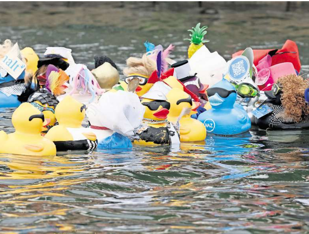
Die bunten „Big Ducks“ schwimmen auf dem Maschsee.

NKR-ENTENRENNEN: 100 kreativ gestaltete „Big Ducks“ und 5000 gelbe Quetscheentchen gehen an den Start