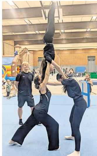
Die Vorführungen der Turnsparte hatten ein bemerkenswertes Niveau.

gesorgt, für die Kids gab es zu- dem einen Stand mit Süßigkei- ten. „Die Arbeit bei der Vorbe- reitung und am Veranstaltung- tag hat sich gelohnt“, konnten die Jugendlichen am Ende des Tages zufrieden feststellen.