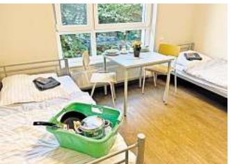
Kochutensilien für alle: Die geflüchteten Menschen werden in Zweibettzimmern untergebracht und mit dem Nötigsten versorgt.

Bis zu 90 Personen finden in dem Stadtteilhaus Platz, „aber es werden nicht sofort so viele einziehen“, betonte Celik, „das fin-