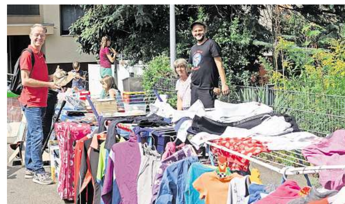
In diesem Haus im Bauverein waren die Kleiderschränke kräftig „geräubert“ worden.