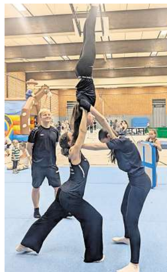
Die Vorführungen der Turnsparte hatten ein bemerkenswertes Niveau.

und wahrhaftig klingen können. Karten gibt es im Vorverkauf bei Petri & Waller, Eventim und an der Abendkasse. Interessierte sollten bedenken, dass es im Foyer der Bank nur eine beschränkte An- zahl von Sitzplätzen gibt.