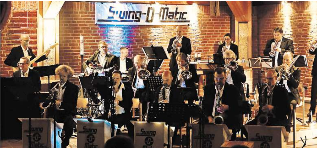
Die hannoversche Bigband Swing-O-Matic tritt am 23. September in der Seelzer Kirche St. Martin auf.

dem insbesondere die musikalische Nachwuchsarbeit des Jugendblasorchester Seelze. Der Eintritt zum Konzert ist frei – der Förderverein freut sich aber über Spenden, um weiterhin spannende musikalische Projekte und lokale (Nachwuchs-) Musikerinnen und Musiker unterstützen zu können. Das Konzert beginnt um 19.30 Uhr; Einlass bereits um 19 Uhr. Sitzplätze können vorab mit einer kurzen E-Mail an vorstand@conbrio-seelze.de reserviert werden.