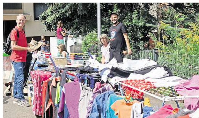
In diesem Haus im Bauverein waren die Kleiderschränke kräftig „geräubert“ worden.