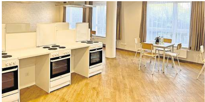
Die Gemeinschaftsküche: Im Erdgeschoss der Einrichtung werden sich die Bewohner das Essen zubereiten.

Inzwischen hat die Stadt Garbsen das Stadtteilhaus gekauft. Und das dient nicht nur als Flüchtlingsunterkunft. Noch bis Ende 2025 werden Räume auch für die Tagespflege genutzt, drei barrierefreie Wohnungen, von denen derzeit nur eine bewohnt ist, bleiben bestehen, andere Zimmer werden von der Stadtverwaltung genutzt. „Und wir können uns auch vorstellen, dass die Volkshochschule mit einzieht“, kündigte Bürgermeister Claudio Provenzano (SPD) an.