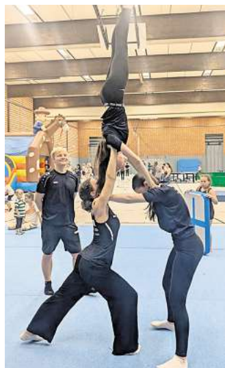
Die Vorführungen der Turnsparte hatten ein bemerkenswertes Niveau.

gesorgt, für die Kids gab es zudem einen Stand mit Süßigkeiten. „Die Arbeit bei der Vorbereitung und am Veranstaltungstag hat sich gelohnt“, konnten die Jugendlichen am Ende des Tages zufrieden feststellen.