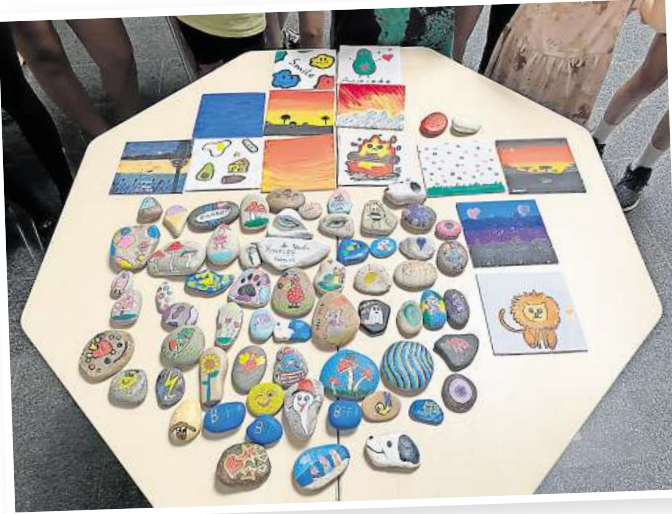
Tolle Ferienpass-Aktion 2024: Steine bemalen.

Grundschule Marienwerder befindet sich ein Treffpunkt. Immer sonnabends um 9 Uhr startet die Nordi Walking Runde zu einer Tour durch die abwechslungsreiche Landschaft.