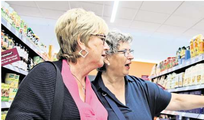
Kundinnen mit Zugangskarte: Einkauf bei „Tante Enso“ in Gülzow.