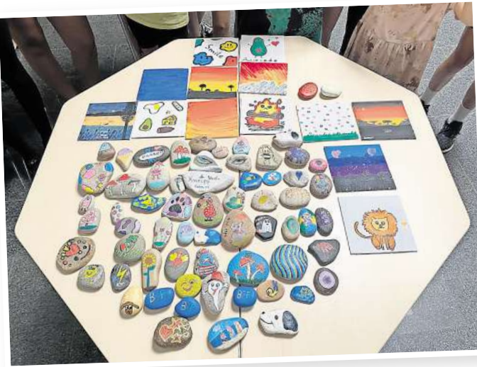
Tolle Ferienpass-Aktion 2024: Steine bemalen.

Grundschule Marienwerder befindet sich ein Treffpunkt. Immer sonnabends um 9 Uhr startet die Nordi Walking Runde zu einer Tour durch die abwechslungsreiche Landschaft.