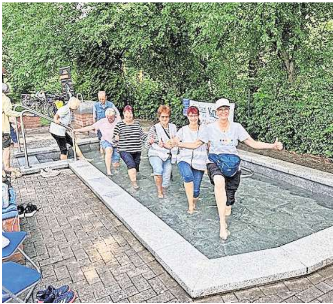
Das Kneipp-Wassertreten im Garbsener Stadtpark ist bis Oktober geöffnet.

Das Wassertretbecken des Kneipp-Vereins im Stadtpark Garbsen zählt zu den klassischen Angeboten, die für jeden passen. Ob jung oder erfahren, ob mittelmäßig sportlich oder super fit. Bis zur ersten Oktoberwoche kann man mittels Wasser treten seine Gesundheit fördern. Einmal die Woche lädt der Kneipp-Verein auch zum Spaziergang im Stadtpark ein. Er ist für Menschen gedacht, denen lange Strecken zu anstrengend sind. Daher kann man in gemütlichem Tempo gehen und bewegt sich zugleich an der frischen Luft und in netter Gesellschaft. Auch an der