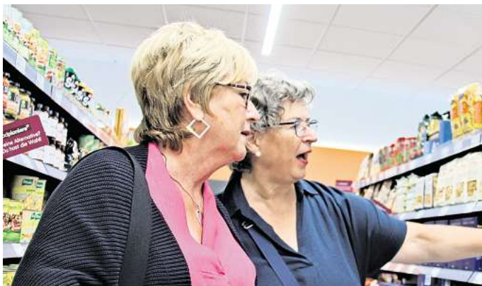
Kundinnen mit Zugangskarte: Einkauf bei „Tante Enso“ in Gülzow.