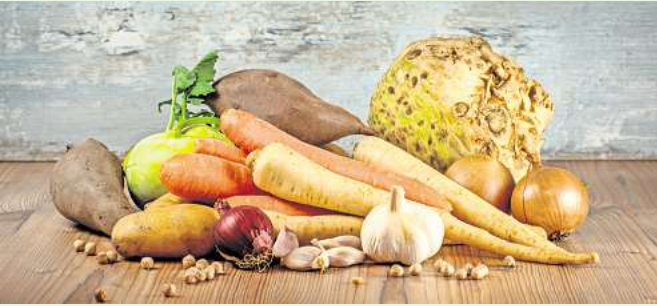
Der Spätsommer bietet reiche Ernte für eine gesunde Ernährung.

Das Ärztehaus im Centrum Kohake bietet eine große Anzahl an Fachärztinnen und -ärzten in einem Haus. Praxen für Physiotherapie, Logopädie und Ergotherapie sowie Bewegungs- und Fitness-Angebote ergänzen die Bandbreite rund um die optimale Versorgung.