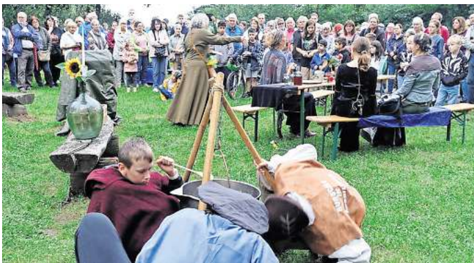
Nicht nur bei den Zeitreisenden spielten zahlreiche Kinder mit, auch unter den Besuchern gab es viele Mädchen und Jungen.