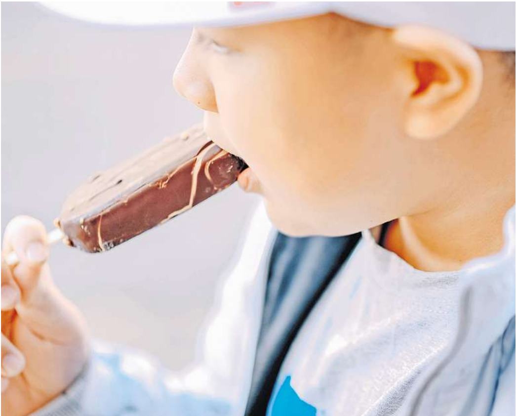
Mit gezielt an Kinder gerichtete Werbung werden diese früh an ungesunde Lebensmittel herangeführt.

gen: „Kinder sind naiv“, sagt sie. „Bis zum Alter von vielleicht 11 oder 12 Jahren fällt es ihnen schwer, redaktionelle Inhalte und Werbung zu unterscheiden, und kleine Kinder verstehen natürlich noch viel weniger.“ Gleichzeitig seien sie emotional besonders leicht ansprechbar. „Jeder, der schon einmal mit einem kleinen Kind durch den Supermarkt gelaufen ist weiß, wie leicht sie von süßen und niedlichen Tieren auf Produktverpackungen angesprochen werden.“