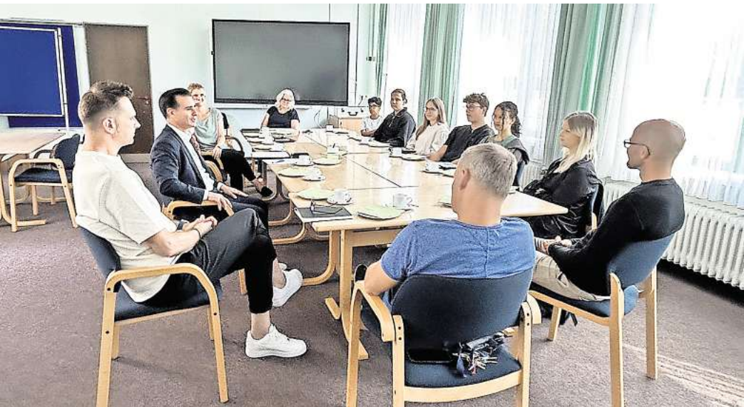
Bürgermeister@school: Bürgermeister Provenzano im Gespräch mit Schülerinnen und Schülern sowie der Schulleitung der IGS Garbsen.

Ein zentrales Thema des Besuchs war der geplante Neubau der IGS Garbsen, eines der größten und kostenintensivsten Bauprojekte, die die Stadt Garbsen je begonnen hat. Bürgermeister Provenzano betonte, dass das Vorhaben im Rathaus höchste Priorität genieße und sich derzeit in der sogenannten Leistungsstufe 3 (Entwurfsplanung)