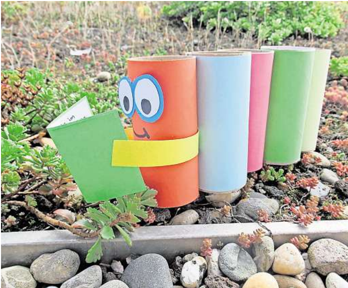
Bastel-Aktion für Grundschulkinder: Aus Klorollen entsteht ein tierischer Stifte-Halter für den Schreibtisch.

Kinder ab drei Jahren mit Begleitperson sind zum Kamishibai eingeladen. Die Geschichte „Kann ich bitte in die Mitte“ ist