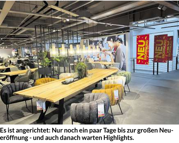
Es ist angerichtet: Nur noch ein paar Tage bis zur großen Neueröffnung - und auch danach warten Highlights.