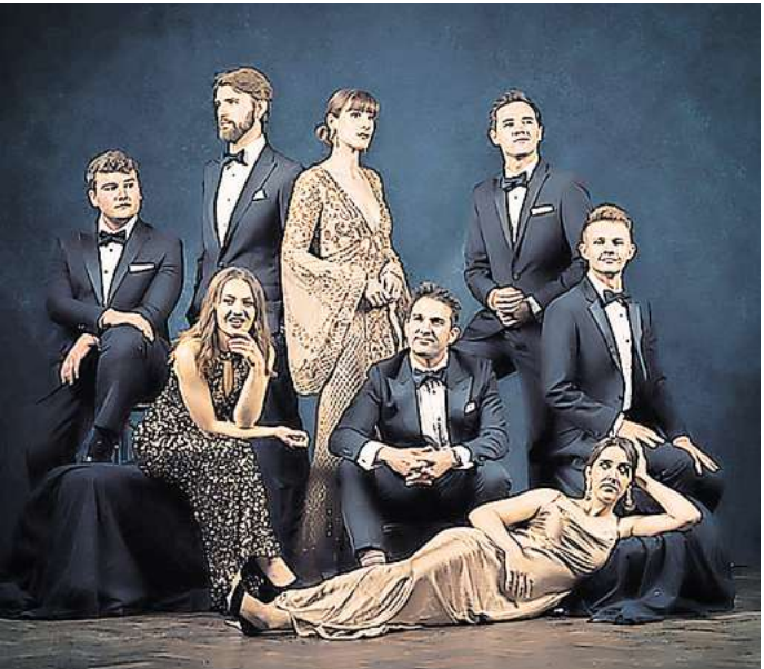
Das für den Grammy nominierte Ensemble Voces8 aus Großbritannien – am 27. September, Christuskirche

zentrum Pavillon, die Neustädter Hof- und Stadtkirche und die Galerie Herrenhausen. Hier