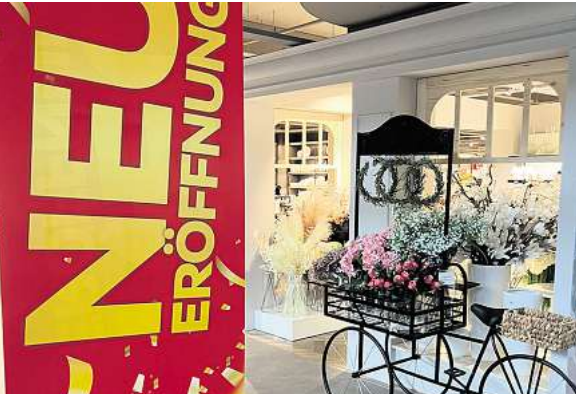
Die neue Boutique-Abteilung im Erdgeschoss glänzt mit viel Detailliebe.