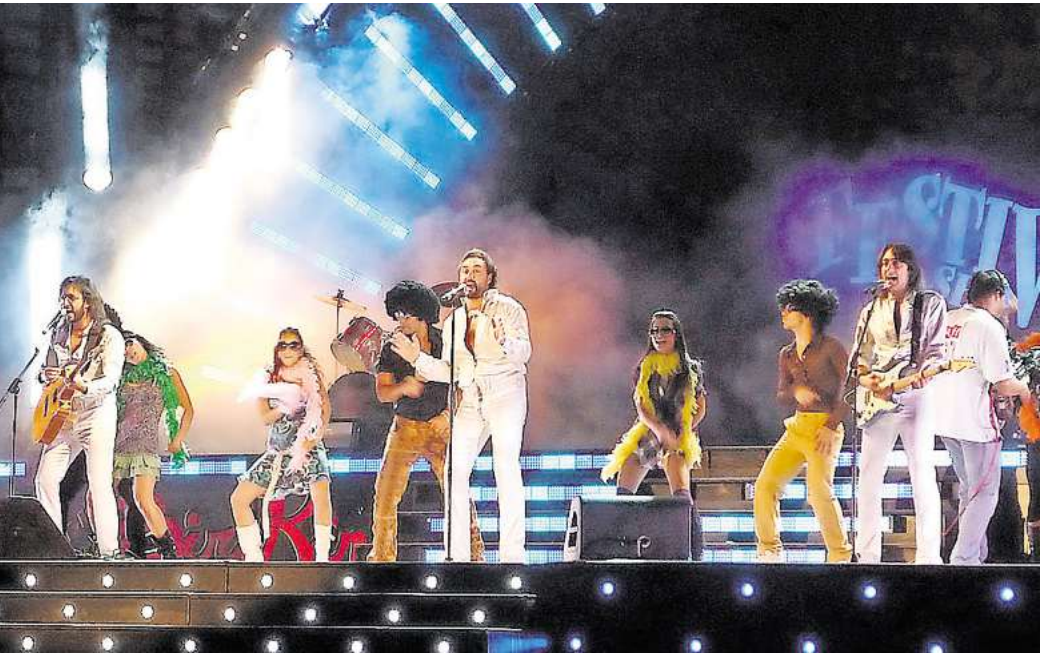
Sorgen für ausgelassene Stimmung auf der Bühne: The Italian Bee Gees.

Am Montag, 12.Mai 2025 um 20 Uhr im Theater am Aegi