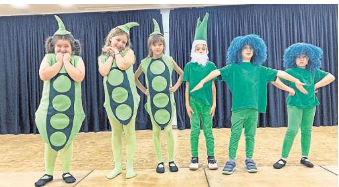
„Welche Farbe hat ein Kuss“: Die Ballettklassen, die Musical-Academy und die Musical-Combo der Musikschule Seelze suchen in ihrem neuen Tanz-Musical eine Antwort auf diese Frage. "Mopperndes Gemüse" in einer Schauspielszene.