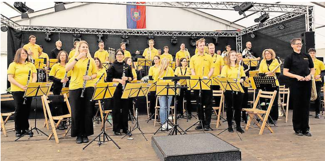
Die „YoungStars“ des Jugendblasorchesters Seelze e.V. spielten ein abwechslungsreiches Repertoire, was vom Publikum mit viel Applaus bedacht wurde.