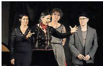
Finale: Nach 27 Jahren Erzählfestival findet es zum letzten Mal statt.