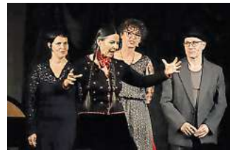
Finale: Nach 27 Jahren Erzählfestival findet es zum letzten Mal statt.