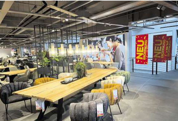
Es ist angerichtet: Nur noch ein paar Tage bis zur großen Neueröffnung - und auch danach warten Highlights.