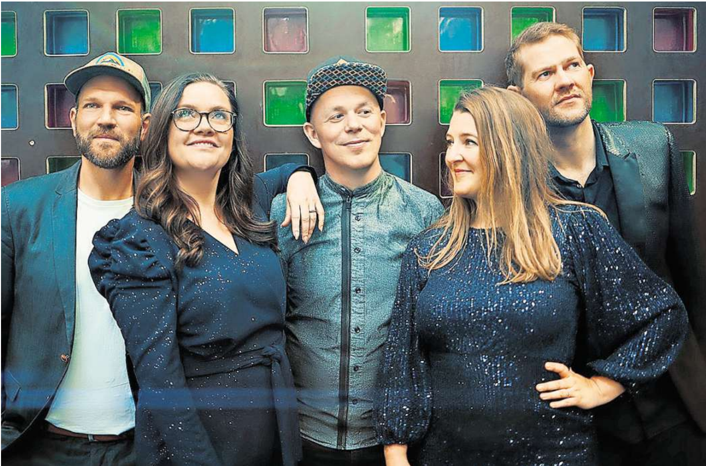
Postyr aus Dänemark – am 26. September im Pavillon

HANNOVER. Die chor.com ist alle zwei Jahre der wichtigste europäische Treffpunkt der Vokalmusikszene und wird in diesem Jahr wieder in Hannover stattfinden. Der Veranstalter, der Deutsche Chorverband e. V., aus Berlin, hat auch 2024 ein beeindruckendes Programm zusammengestellt. Unter dem Motto „Auf- und Umbrüche – neue Perspektiven für die Chormusik“ gibt es über 150 Workshops und Masterclasses, ein großes digitales Angebot und ein frei zugängliches Forum im HCC mit Talks, Diskussionsrunden und einer Messe mit rund 60 Fachausstellern, das gibt Interessierten die Möglichkeit zum Austausch und zum Entdecken neuer Trends. Das Herzstück der chor.com und für die meisten von Euch sicherlich am interessantesten, sind die 22 Konzerte. Hier zeigen nationale und internationale Ensembles die Vielseitigkeit und neue Trends der Vokalmusikszene. Da lohnt sich auf jeden Fall ein Blick auf das komplette Programm auf der untenstehenden Webseite der Veranstaltung, denn Vokalmusik 2024 ist viel mehr, als man vielleicht erwarten würde. Die Konzerte finden an verschiedenen Orten statt. Mit dabei sind die Christuskirche, das Kultur-