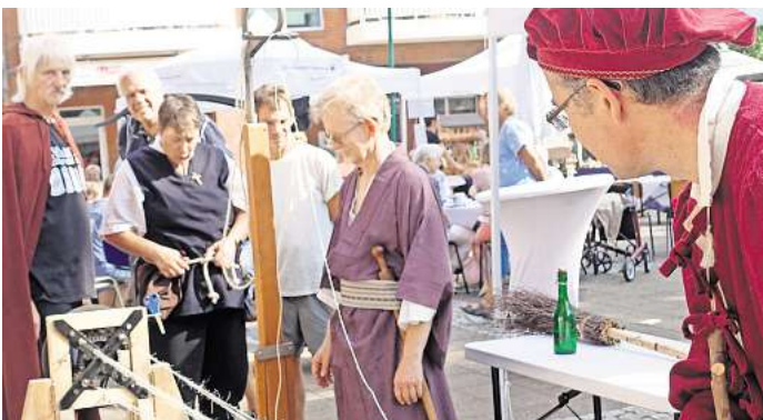
Vielfach bestaunt: Die „Reeperbahn“.