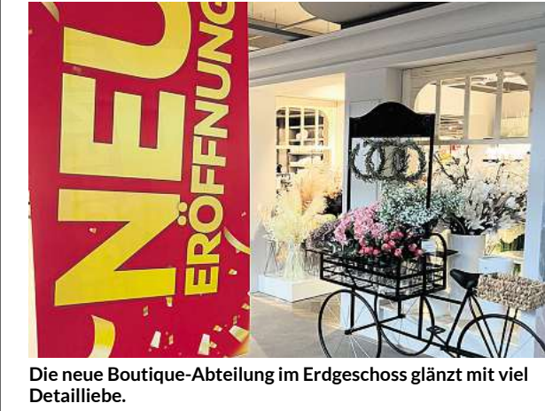
Die neue Boutique-Abteilung im Erdgeschoss glänzt mit viel Detailliebe.