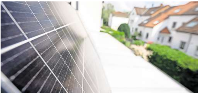
Ob sich ein Batteriespeicher für das Balkonkraftwerk lohnt, hängt auch von der Größe der Anlage ab