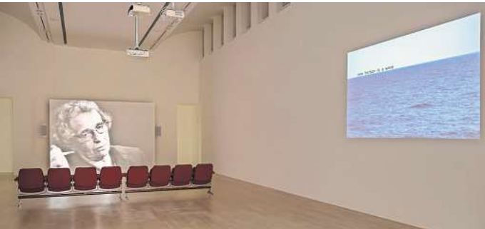
Die Kestner Gesellschaft widmet sich in einer Ausstellung dem Wirken von Hannah Arendt.