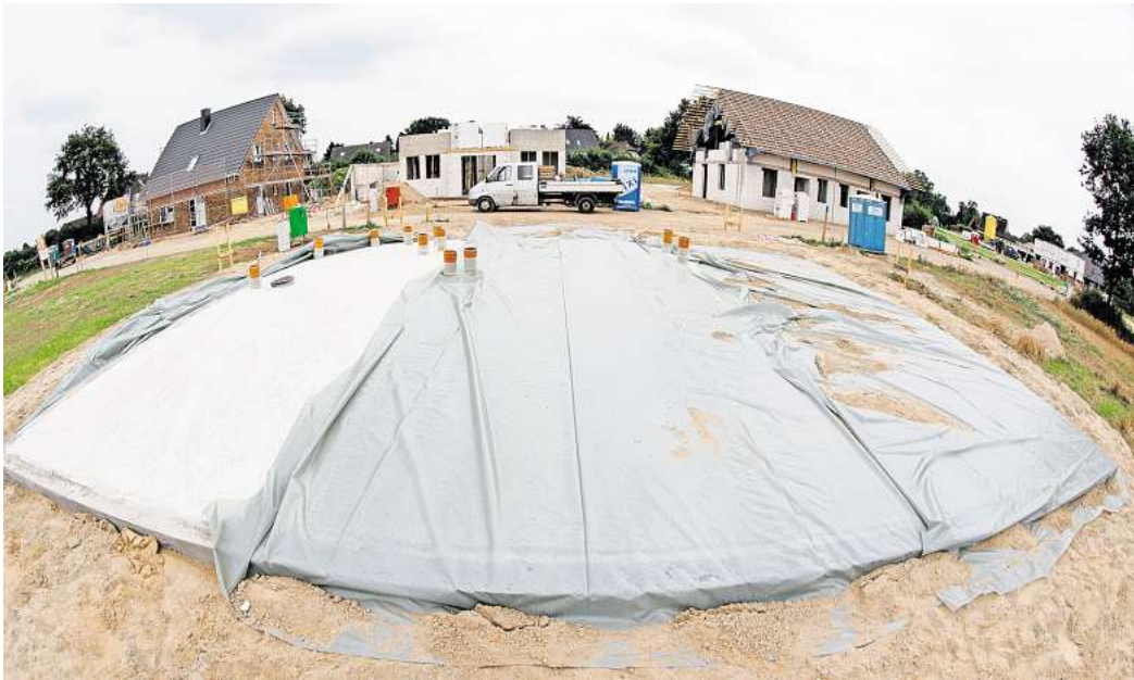
Bauherren sollten bei Vertragsregelungen zu Baustrom und -wasser sowie bei der Organisation und Kostenübernahme von Bautoilette, Bauwagen oder der Entsorgung von Bauabfällen genau hinschauen.

BERLIN. Wo gebaut wird, geht nichts ohne Strom und Wasser. Doch gerade diesen Selbstverständlichkeiten sollten Bauherren große Aufmerksamkeit schenken, rät der Verband Privater Bauherren (VPB). Denn immer wieder gebe es in Bauverträgen Regelungen, nach denen Bauherren die Versorgung sicherstellen müssten. Die vermeintlich unscheinbaren Formulierungen lauten etwa «bauseits» oder «auf Ihrem Grundstück». Wer einen solchen Vertrag achtlos unterzeichnet, muss damit rechnen, ungeplant hohe Kosten zu tragen - insbesondere dann, wenn die Anschlüsse erst noch gelegt werden müssen. Denn bevor die Bauarbeiten beginnen können, müssten dann zunächst provisorische