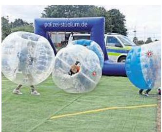
Die Kids hatten einen Riesenspaß beim Bubblesoccer. Dabei war vielen der Ball weniger wichtiger als der Crash mit dem „luftgepolsterten“ Gegner.