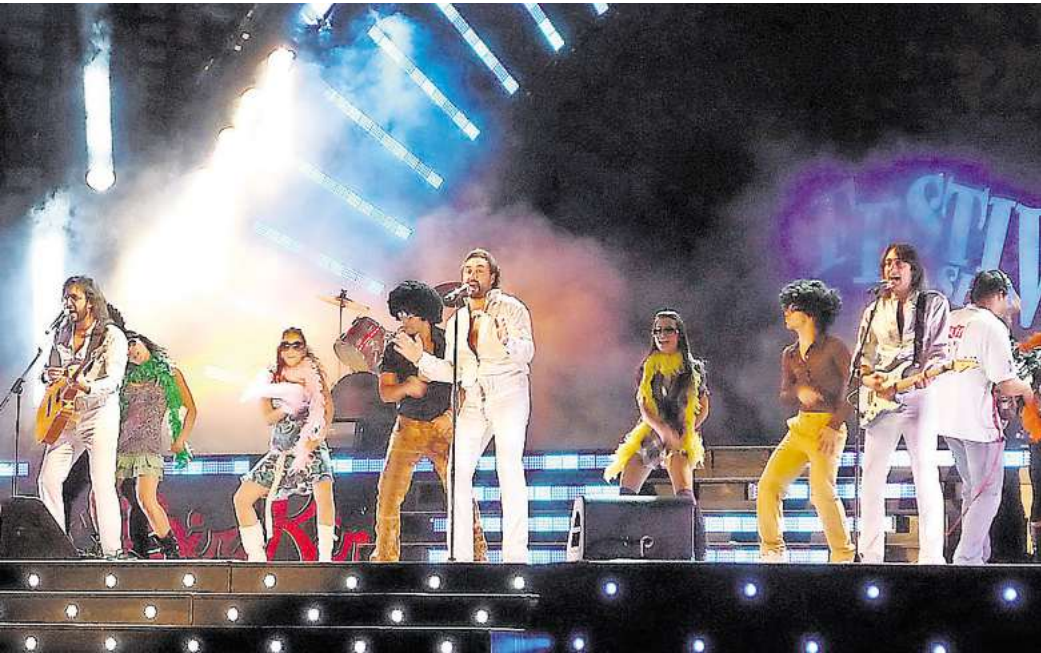
Sorgen für ausgelassene Stimmung auf der Bühne: The Italian Bee Gees.

Am Montag, 12.Mai 2025 um 20 Uhr im Theater am Aegi