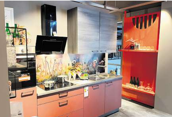
XXXL-Auswahl mit Riesenqualität: Eine von 130 Ausstellungsküchen in der frisch renovierten Küchenabteilung.