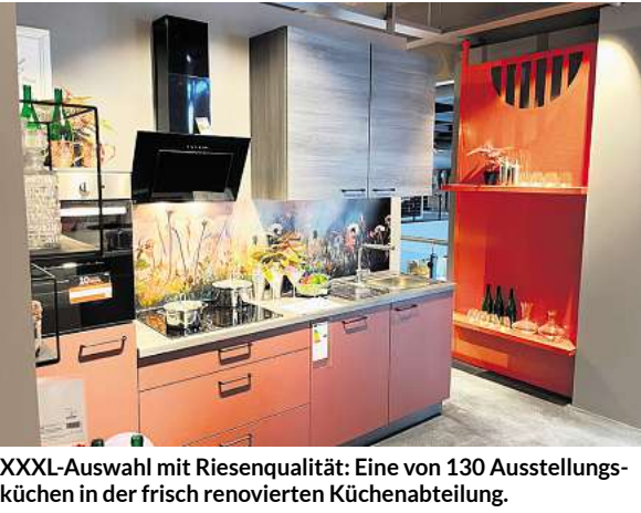
XXXL-Auswahl mit Riesenqualität: Eine von 130 Ausstellungsküchen in der frisch renovierten Küchenabteilung.