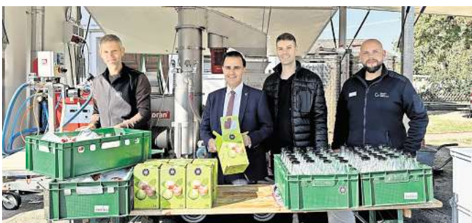
Die Mostaktion, die in diesem Jahr von der Lohnmosterei Heidemost durchgeführt wurde, bot Besuchern die Möglichkeit, ihre Äpfel in frischen Apfelsaft zu verwandeln.