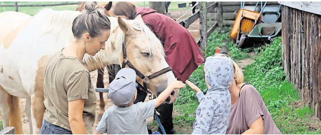
Vertrauen schaffen: Die Beziehung zum Pferd spielt beim heilpädagogischen Reiten eine zentrale Rolle.