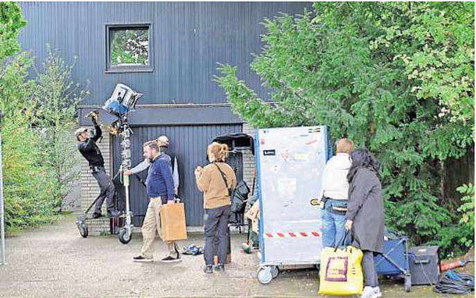
Großes Kino?: Ein Privathaus Am Hohen Holze dient als Drehort für den Film „Sunny“ mit Christoph Maria Herbst.