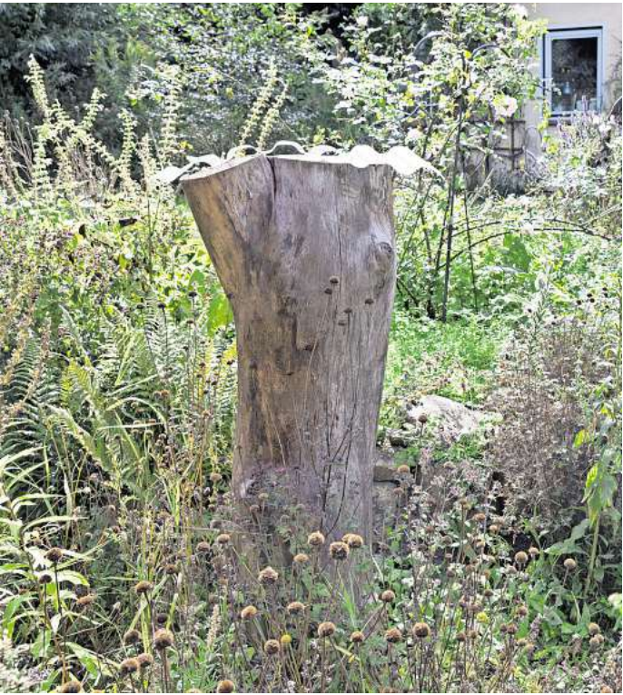
Flechten: Das wichtigste Element für einen naturbelassenen Gartenbereich ist Totholz.

„Lässt man Spontanvegetation zu, kann es hübsche Überraschungen geben“, sagt die Landschaftsgärtnerin. „So manche Wildpflanze ist den bekannten Prachtstauden ebenbürtig. Mitunter etablieren sich Pflanzen, die schön aussehen und wunderbar zusammenpassen, wie etwa das Ruprechtskraut, das von Mai bis Oktober über rosa blüht, mit wilder Möhre, Schafgarbe, Schöllkraut oder Johanniskraut.“ Präger zufolge ist es allenfalls nötig, regulierend