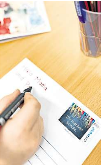
Früh übt sich wer lernt, einen Brief zu schreiben.

■ Sie sind Lehrer oder Lehrerin und möchten Postkarten als Material für Ihren Deutschunterricht? Dann melden Sie gerne unter service@citipost.de .