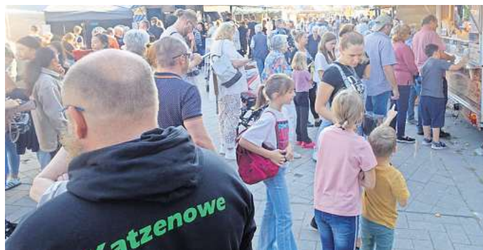
Rappeldicke voll war es beim Kastanienfest auf dem Platz in der Ortsmitte.

Ein Sonderlob verdient sich die Damen des DRK-Ortsvereins, die bis in den späten Abend hinein ackerten. Ihr Angebot von Aperol Spritz (war dann ausverkauft), Wein, Sekt, Schmalzbrot, Mettballchen und Käsehap-pen traf offensichtlich den Geschmack der Besucher, zumal