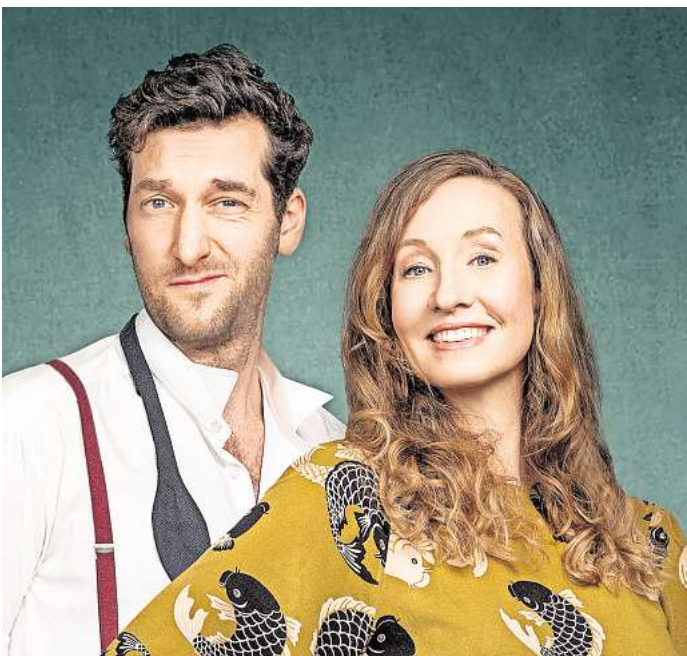
Das Duo „Das Geld liegt auf der Fensterbank, Marie“ bringt die Premiere seines neuen Programms „Glorreich versieben“ auf die Bühne im Apollo.

Bei Gastspielen im Theater am Aegi sind „extra3“-Moderator und „Heute Show“-Sidekick Christian Ehring mit „Stand