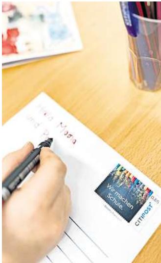
Früh übt sich wer lernt, einen Brief zu schreiben.

■ Sie sind Lehrer oder Lehrerin und möchten Postkarten als Material für Ihren Deutschunterricht? Dann melden Sie gerne unter service@citipost.de .