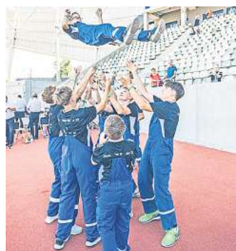
Die Jugendfeuerwehr Osterwald Unterende feiert ihren Erfolg bei der Deutschen Meisterschaft.

Die Deutsche Jugendfeuerwehr ist die Gemeinschaft der Jugend innerhalb des Deutschen Feuerwehrverbandes. Zurzeit sind mehr als 350.000 Kinder und Jugendliche bundesweit in mehr als 18.000 Jugendfeuerwehren und rund 6.000 Kindergruppen aktiv. Neben der feuerwehrtechnischen