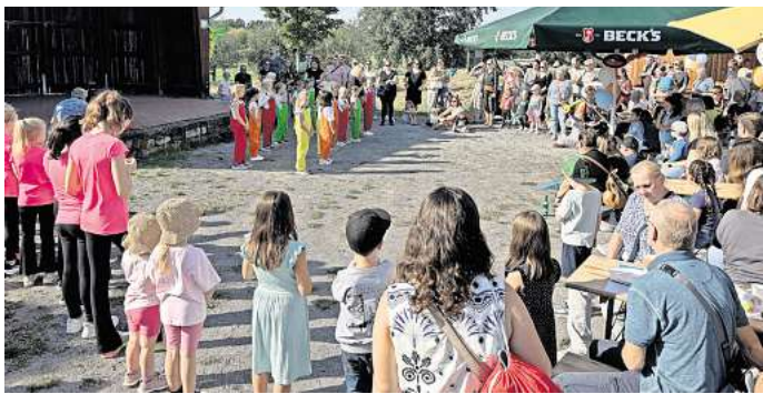
Großer Andrang herrschte bei der Feier zum Weltkindertag auf der Naturerlebniswiese.