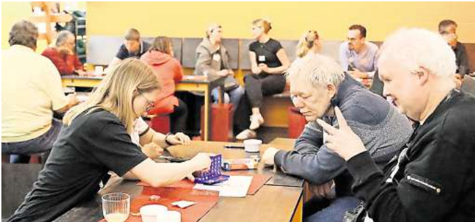
„Café DU und ICH“: In entspannter Atmosphäre treffen sich Gleichgesinnte auf der Suche nach Gemeinschaft, Unterhaltung oder der großen Liebe.

ge der Café-Besucherinnen und -Besucher haben bereits ein Profil erstellt und auf diesem Wege online jemanden kennengelernt – das „Café DU und ICH“ nutzen sie für ein erstes Date.