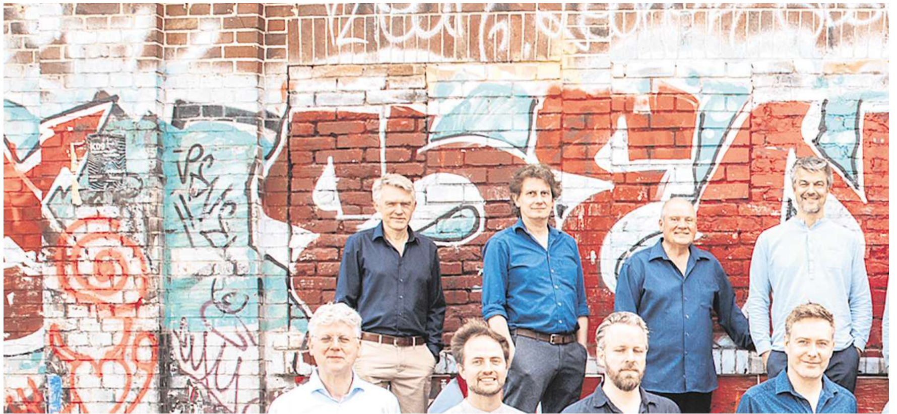
Die Bigband komplett.

Die Schwimmoffensive wurde als Reaktion auf die alarmierend hohe Zahl von Kindern ohne Schwimmkenntnisse gestartet. Während der Corona-Pandemie waren die Kurse ausgefallen, zwei Jahrgänge hatten keinen Schwimmunterricht. Danach waren die Kurse überfüllt und die Wartelisten lang – es war Zeit für diese Schwimmoffensive.