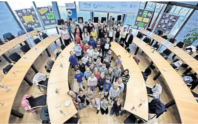
Um sich das Lob im Rathaus abzuholen waren neben den Projektverantwortlichen der Schulen auch einige Schulleitende und vor allem zahlreiche Sch lerinnen und Sch ler gekommen.