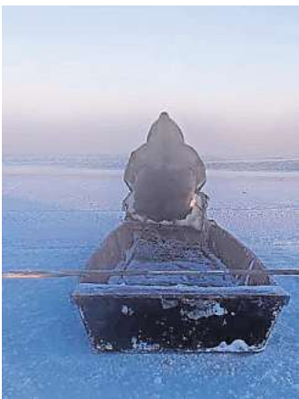
Joar Nango: „Flow Edge“, 2023.

Die eigens für die hannoversche Ausstellung konzipierte Installation besteht aus einer Vielzahl gefundener Materialien, eigens gefertigten Holzskulpturen, Fotografien und Filmen und lädt mit Sitzgelegenheiten zum Verweilen ein. Joar Nangos experimentelle und zunächst ergebnisoffene Herangehensweise ermöglicht es ihm, auf die Besonderheiten des jeweiligen Ortes