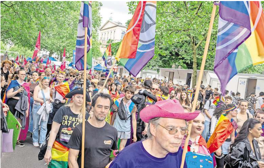
Farbenfrohe Demonstration: CSD 2024 in Hannover.

Geschlechtsbezogene Fake News und die gefährlichen Folgen – Podcast in Kooperation mit der NEUEN PRESSE klärt auf