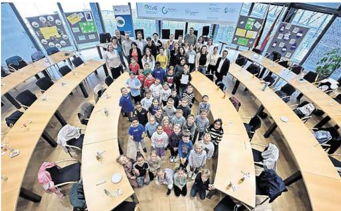
Um sich das Lob im Rathaus abzuholen waren neben den Projektverantwortlichen der Schulen auch einige Schulleitende und vor allem zahlreiche Sch lerinnen und Sch ler gekommen.

Das Projekt „eZuG – Energiesparen f r die Zukunft Garbsens“ wird von der Nationalen Klima-