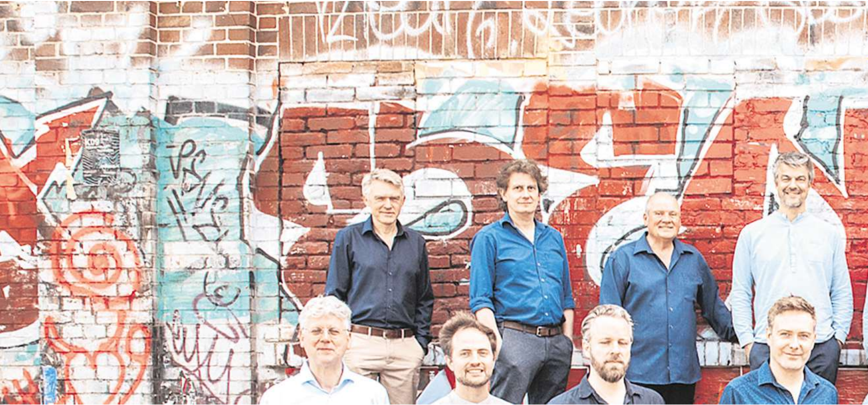
Die Bigband komplett.

JUBILÄUMSKONZERTE IM PAVILLON UND IN DER FAUST – Die magaScene empfiehlt die besten Live-Erlebnisse