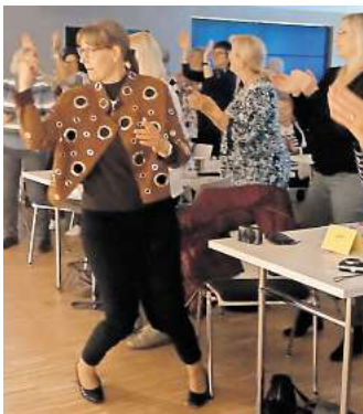
Gegen Ende der Veranstaltung, das Graham Bonney über eine Stunde gestaltete, wurde noch getanzt.