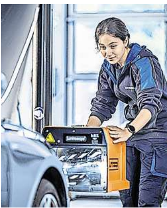
Beim Lichttest steht die technische Überprüfung aller Leucht Komponenten im Vordergrund, doch die Prüferinnen und Prüferingenieurinnen und Prüferingenieure vor Ort beantworten auch gern alle Fragen rund um das Thema Scheinwerfer.

Damit andere nicht geblendet werden, müssen Leuchtweite und Lichteinstellung der Scheinwerfer regelmäßig kontrolliert werden, vor allem bei Veränderungen der Beladung. Während zu hoch eingestellte Leuchten den Gegenverkehr blenden und vorausfahrende Fahrzeuge im Rückspiegel irritieren können, schränken zu niedrig eingestellte Scheinwerfer aufgrund des kleineren Lichtkegels die eigene Sicht ein. Dies kann besonders zur Hochsaison des Wildwechsels gefährlich werden. Beim Lichttest steht die technische Überprüfung aller Leucht Komponenten im Vordergrund, doch die Prüf-