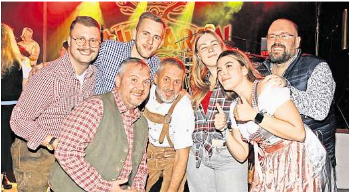
Die Partyszene aus Garbsen und Umgebung feiert das Oktoberfest ausgelassen im passenden Trachtenlook.

sucherinnen und Besucher war ganz stiecht in Trachten wie Dirndl oder Lederhose mit Karohemd erschienen.