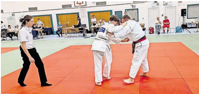
Das 24. Judo-Teufel-Turnier bot eine Vielzahl an spannenden Kämpfen.