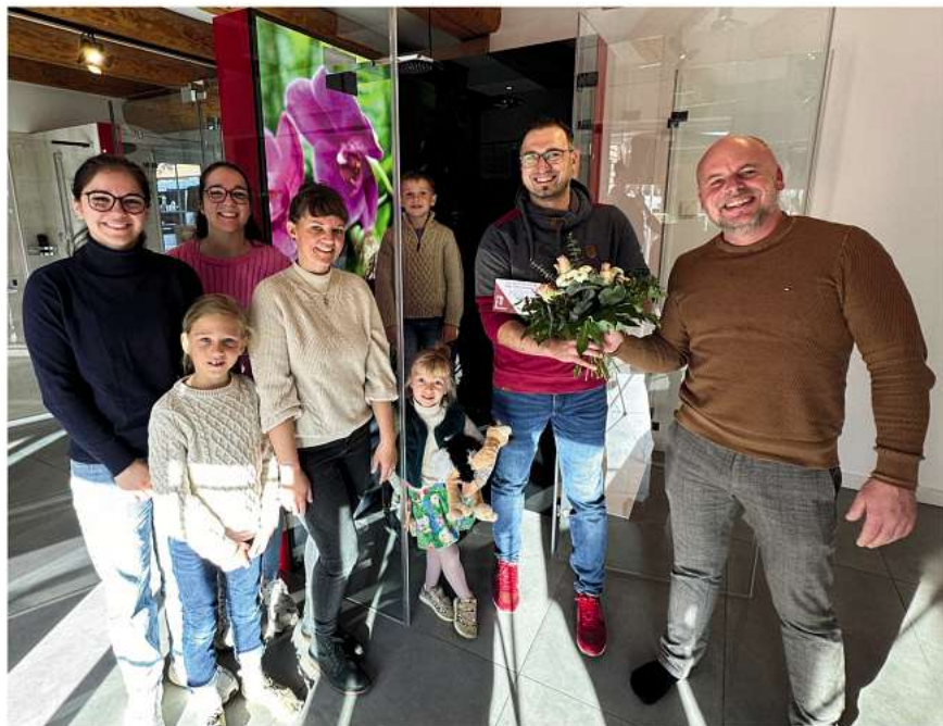
Die ganze Familie Höffmann freut sich riesig über den Gewinn und wünscht sich einen Wasserfall als Duschrückwand!