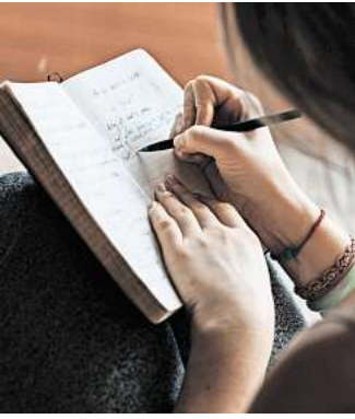
WortLaut: kreatives Schreiben, gemeinsames Lesen.