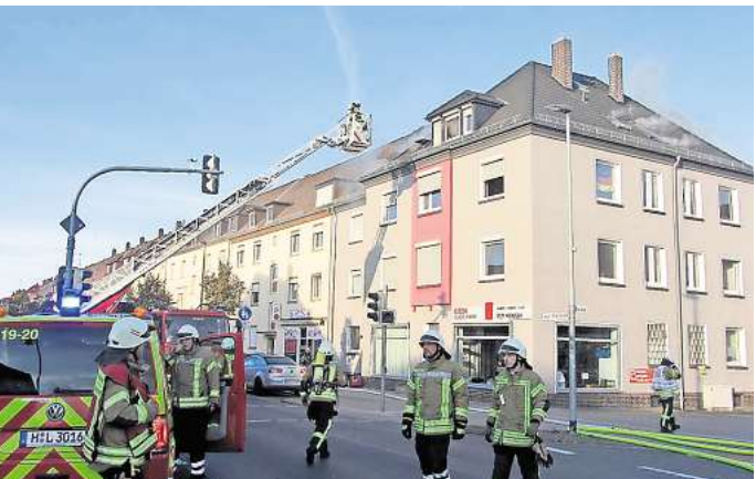
Zwei Personen wurden über die Drehleiter aus dem Dachgeschoss gerettet.

Um 10.11 Uhr konnte der Leitstelle „Feuer aus“ gemeldet werden, die Nachlösch- und Aufräumarbeiten zogen sich bis 12.15 Uhr hin. Während des Feuerwehreinsatzes musste die Lange-Feld-Straße vollständig gesperrt werden.