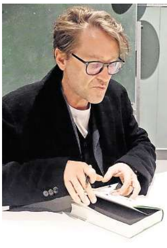
Erst hatte Jan Weiler viel zu lesen, danach viel zu schreiben beim Signieren seiner Bücher.

Ein krasser Gegensatz war in der Pause und am Ende der Lesung im Vorraum zu beobachten, denn hier drängten sich die Besucherinnen um den Tisch, an dem Weiler seine Bücher mit Schwung signierte. Neben Munk waren es auch andere Bücher des Autors, die gekauft wurden. Über sich erzählte der Autor kaum etwas. Mehr ist im Internet in der Aufzeichnung der Sendung „3 nach 9“ vom 20. September 2024 zu erfahren. Da er