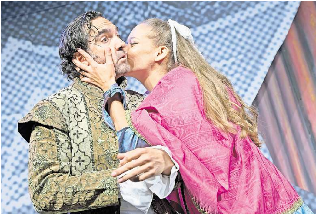
Die Komödie am Altstadtmarkt präsentiert das Theaterstück „Plötzlich Shakespeare“ am 26. Oktober in der IGS Garbsen.

für Kleintiere von Samstag 12 Uhr bis Montag 7 Uhr, Telefon (05036) 488; am 31.10. (Reformationstag) von 7 Uhr bis 7 Uhr des Folgetages Telefon (05131) 4614747.