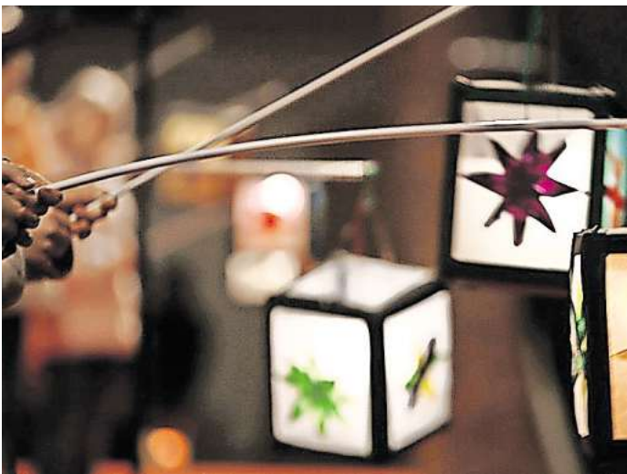
Bunte Lichter: In Seelzes Ortschaften gibt es in diesem Jahr zahlreiche Laternenumzüge.

Die Kirchengemeinde Dedenen-Gümmers lädt für Sonntag, 26. Oktober, zum Laternenfest mit anschließendem Umzug. Es gibt Kakao und Kekse sowie Geschichten zum Erntedankfest.