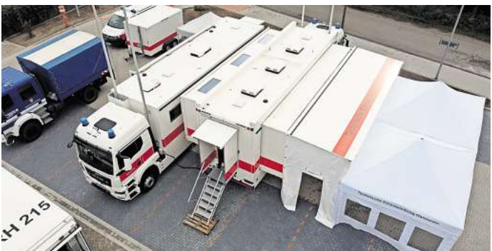
Das Foto zeigt den Aufbau der Technischen Einsatzleitung Hannover im Einsatzfall.

SEELZE. Reger Betrieb herrschte schon am frühen Samstagmorgen vergangener Woche auf dem Wangelgelände der Ortsfeuerwehr Seelze. Kameradeninnen und Kameraden der Ortsfeuerwehr bereiteten die Ankunft der Technischen Einsatzleitung Hannover vor. Die Großfahrzeuge der Ortsfeuerwehr mussten für den eigenen Einsatzfall zum gewohnt schnellen Abrücken richtig platziert werden. Um 7.52 Uhr kam die Alarmierung für das Technische Hilfswerk, Ortsverband Lehrte mit seiner Einheit für die Technische Einsatzleitung mit dem Alarmstichwort „Bombenräumung in Seelze, Wache Seelze anfahren“. Zusätzlich zu den Einsatzkräften des THWs aus