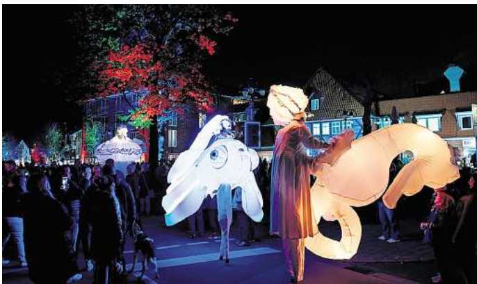
Stelzenläufer in leuchtenden Kostümen gehören zu „den Hinguckern“ beim Seelzer Lichtermeer.

Bis dahin sind ihnen sicherlich die leuchtenden Stelzenläufer begegnet, die ihre akrobatischen Spaziergänge um 17.15, 18.30 und 19.40 Uhr beginnen. Gustav und sein dampfendes eisernes Ross knattern um 17.15 und 18.45 Uhr über die Straße, die Comedy-Stewardessen sind um 17, 18 und 19.30 Uhr unterwegs.