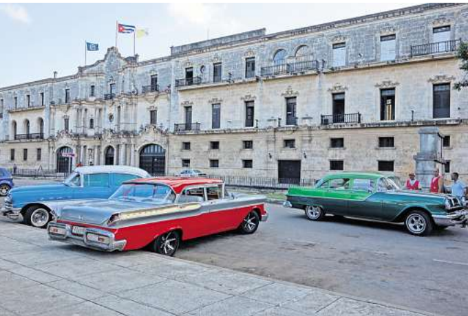
Kuba: ein faszinierendes Land zwischen Nostalgie und Nichts geht mehr.

HANNOVER. Der Global Partnership Hannover e.V. veranstaltet vom 14. bis 26. November erneut seine Veranstaltungsreihe „Kubanische Visionen“ . Die 6. Ausgabe möchte die Besonderheiten der „revolutionären Errungenschaften“ des Karibikstaates in Erinnerung rufen. Dazu gehört auch das cineastische Schaffen, das immer wieder sehr unterhaltsam den Fokus auf die Lebensfreude der Menschen wie auf die Schwächen des Systems richtet. Ein Kaleidoskop jüngerer und älterer Produktionen setzt genau dies beispielhaft in Szene und bietet vielfältige Gesprächsanlässe. Den diesjährigen Auf-