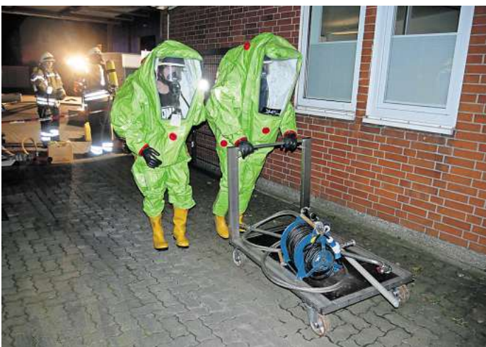
Die Feuerwehr Seelze konnte auf dem Firmengelände eine realitätsnahe Gefahrgut-Einsatzübung durchführen.

werden. Zunächst wurde ein Copter eingesetzt, um schnell nähere Informationen zu dem austretenden Stoff sowie dessen Austrittsmenge zu erlangen. Parallel baute sich der CBRN-Zug auf und die ersten Trupps rüsteten sich mit Schutzkleidung aus und ging zur Erkundung vor. Es handelte sich bei dem verunfallten Gefahrstoff um Salpetersäure. Verschiedene umfangreiche Maßnahmen durch drei Trupps der Feuerwehr Seelze wurden ergriffen, so dass am Ende nach dem erfolgreichen Umpumpen der Salpetersäure die erfolgreiche Einsatzübung beendet und nachbesprochen werden konnte.