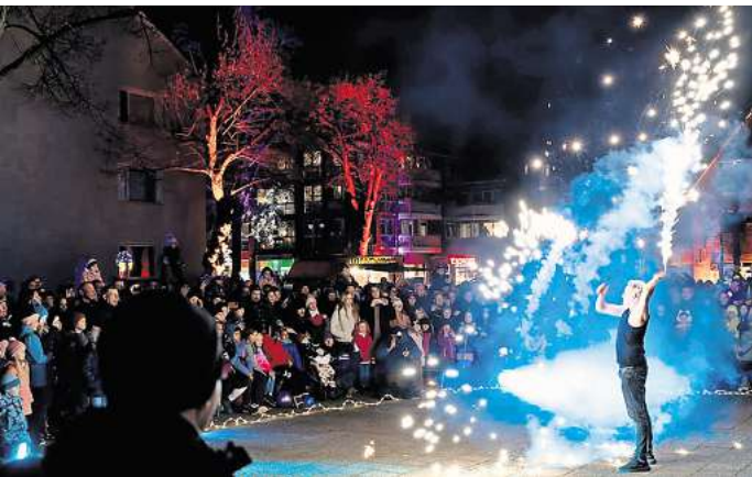
Zweimal wird auf dem Rathausplatz wieder eine spektakuläre Feuer-Show geboten.