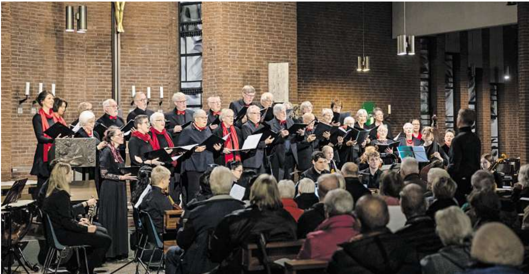
Chor „Ad Libitum“ und Orchester in St. Maria Regina in Berenbostel.