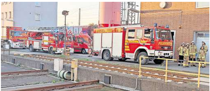
Die Feuerwehren aus Seelze und Letter wurden zu einer Einsatzübung am Rangierbahnhof gerufen.

te eine Person zunächst vom Rettungsdienst versorgt und anschließend durch die Feuerwehr gerettet werden. In der Lokomotive befand sich ein weiteres Opfer, welches mit Kopfverletzungen durch Einsatzkräfte der Feuerwehr aus der Lok gerettet und dem Rettungsdienst übergeben werden musste. Eine dritte Person wurde auf einer Arbeitsplattform aufgefunden. Auch hier musste zunächst der Rettungsdienst die Transportfähigkeit herstellen, bevor die Person von Feuerwehrkräften mit einer sogenannten Schleifkorbtrage aus der Höhe geholt werden konnte. Die umfangreiche Übung hatte der stellvertretenden Ortsbrandmeister aus Letter, Marcel