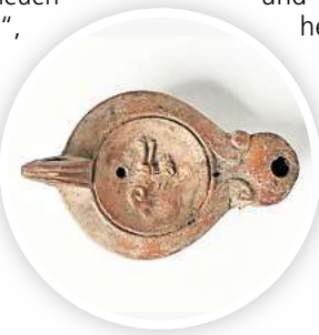
Im Museum August Kestner geht es mit Bildern und Bastelwerkstatt um Tonlampen und ihre Geschichte.

HANNOVER. Mit Bastelaktionen auf den Spuren der Geschichte: Das Historische Museum Hannover im neuen „Hannover Kiosk“, Karmarschstraße 40, bietet eine offene Werkstatt an für Familien mit Kindern, in der diese Fächer basteln und gestalten können. Es beginnt am Sonnabend, 16. November, um 11.15 Uhr und dauert zwei Stunden. Die Gäste haben die Möglichkeit, antiken Vorlagen selber zu gestalten. Die Aktionen nehmen zwischen zehn und 30 Minuten Zeit in Anspruch. Die Kosten richten sich nach dem Materialwert. Kinder bis zwölf Jahren können nur in Begleitung eines Erwachsenen teilnehmen.