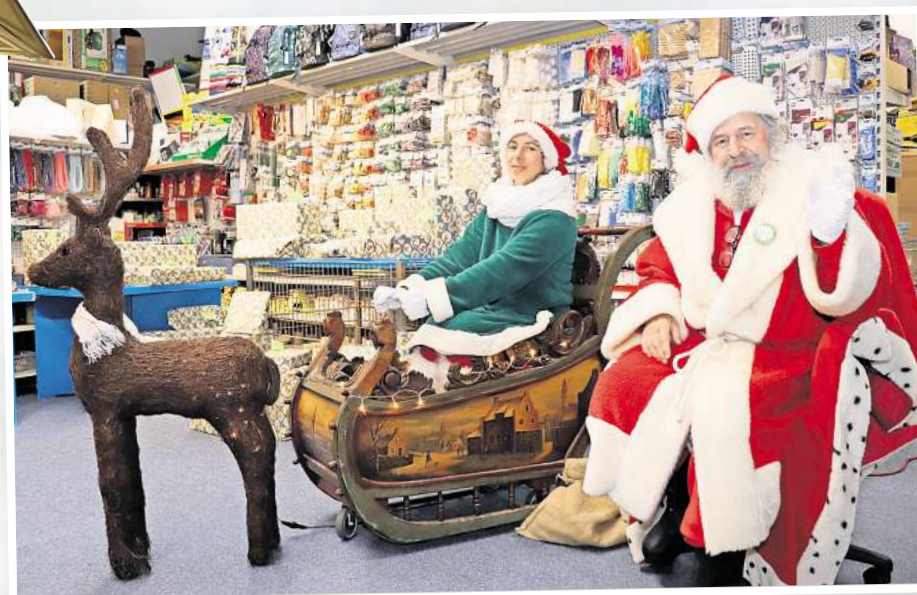
Der Weihnachtsmann will auch in diesem Jahr wieder vielen Kindern Freude bereiten ...

Mit freundlicher Unterstützung! TOP-IN Spielzeugmarkt mit Bastelshop Bunsenstraße 10 Barsinghausen www.topin-toys.de