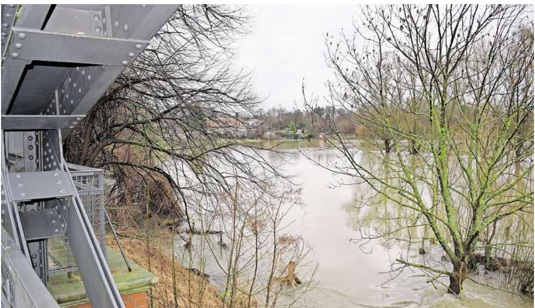
Anfang Januar 2024: Die Leinebrücke zwischen Schloß Ricklingen und Luthe scheint im Wasser zu stehen.

STADT SETZT APP-BASIERTES ALARMSYSTEM EIN Auch die Stadtverwaltung will den Hochwasserschutz in Garbsen weiter optimieren. „Das Hochwasserereignis des vergangenen Jahres hat uns wertvolle Erkenntnisse geliefert, die in die künftige Planung einfließen“, schreibt Benjamin Irvin, Pressesprecher der Stadt. Garbsen sei auf Starkregenereignisse vorbereitet, betont Irvin: „Die Stadt verfügt über umfassende, regelmäßig aktualisierte Einsatz- und Gefahrenabwehrpläne, die es uns ermöglichen, in Hochwasserlagen schnell und koordiniert zu handeln.“ Diese Einsatzpläne regeln etwa die Einberufung des Krisenstabs. Einsatzkräfte werden im Krisenmanagement geschult. Außerdem hält die Stadt eine Reihe von Hilfsmitteln wie Sandsackreserven und mobile Hochwasserschutzsysteme bereit. Die Verwaltung hat zudem kürzlich ein App-basiertes Alarmierungssystem eingeführt. „Das verbessert die Erreichbarkeit und Reaktionsgeschwindigkeit des Krisenstabs zusätzlich“, so Irvin. Darüber hinaus werde die technische Ausstattung des Krisenstabs laufend nachgerüstet, um für Einsatzlagen bestmöglich gerüstet zu sein. Zudem solle mithilfe der Expertise eines Gutachters die Zusammenarbeit innerhalb der Verwaltung und