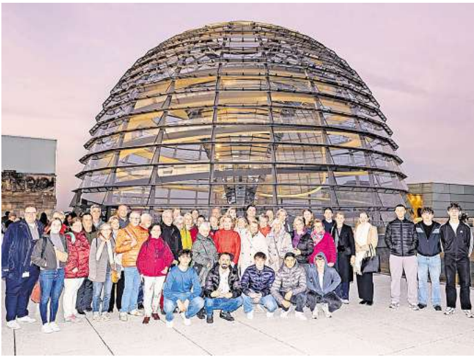
50 Bürgerinnen und Bürger zu Besuch in Berlin bei der SPD-Bundestagsabgeordneten Rebecca Schamber.

den die Möglichkeit, ihre Fragen loszuwerden und zu diskutieren. Für Schamber ist das Angebot, interessierten Bürgerinnen und Bürgern die Möglichkeit zu bieten den Berliner Politikbetrieb kennenzulernen, besonders wichtig. „Ich freue mich sehr über das große Interesse an meiner politischen Arbeit im Deutschen Bundestag“, betont Rebecca Schamber. Alle Abgeordneten des Deutschen Bundestags haben die Möglichkeit, eine begrenzte Anzahl von Bürgerinnen und Bürgern aus ihrem Wahlkreis zu einem Besuch in die Bundeshauptstadt einzuladen und ihnen so Einblicke in die Arbeit von Bundestag und Bundesregierung zu geben.