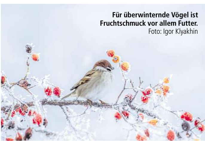
Für überwinternde Vögel ist Fruchtschmuck vor allem Futter.

Dieser Frühlingsbote kann im Winter gesät werden, denn das Duft-Veilchen (Viola odorata) gehört zu jenen Stauden, deren Samen zum Keimen eine lange Kälteperiode benötigen. Die Saat-