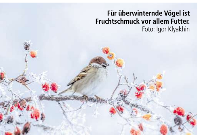
Für überwinternde Vögel ist Fruchtschmuck vor allem Futter.

Dieser Frühlingsbote kann im Winter gesät werden, denn das Duft-Veilchen (Viola odorata) gehört zu jenen Stauden, deren Samen zum Keimen eine lange Kälteperiode benötigen. Die Saat-