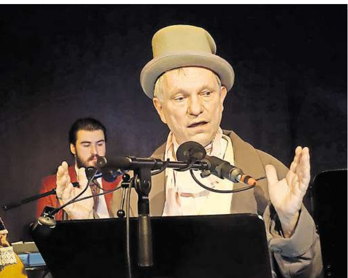
Ebenezer Scrooge ist ein Ausbund an Geiz und Gier.

SEELZE (KÖ). Für diejenigen, die die Weihnachtsgeschichte von Charles Dickens über den hartherzigen Geizkragen Ebenezer Scrooge gelesen oder einer der entsprechenden Filme gesehen hatten, war das Live-Hörspiel des Theaters Ex Libris ein Genuss. Sie konnten sich voll und ganz den wandlungsfähigen Sprechern, der Live-Musik und den auf die Handlung abgestimmten Lichtbildern widmen. Anderen, die neugierig waren auf die Geschichte des Geizkragens, aber sie nicht kannten, fiel das deutlich schwerer. Der Kulturinitiative Seelze (KIS) beschränkte diese Gemengelage eine ausverkaufte Vorstellung, aber auch zahlreiche enttäuschte Besucher.