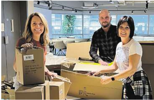
Das Deko Team hat aktuell den größten Stress, um die liebevoll eingerichteten Flächen zu gestalten und den letzten Schliff zu verpassen.