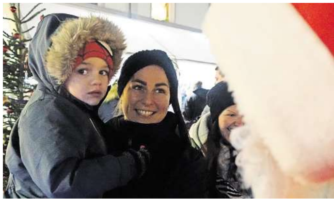
Der Nikolaus war diesem Kind offensichtlich nicht ganz geheuer.