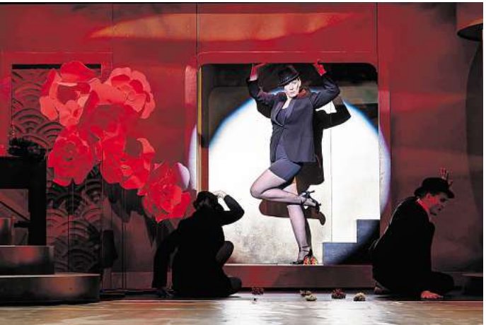
Die Aufführung „Unendliche Sterne“ lud zum Nachdenken, Mitfühlen und Zuhören ein.