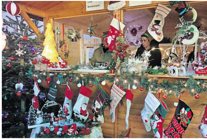
Mit welcher Hingabe und Kreativität die Kunsthandwerkerinnen ihre Weihnachtshütten schmückten, macht dieses Foto deutlich.

„Es fehlte eigentlich nur eine Cafestube“, meinte Ortsbürgermeister Hackbarth. Dafür meldete sich aber schon ein Interesse für den Weihnachtsmarkt 2025.