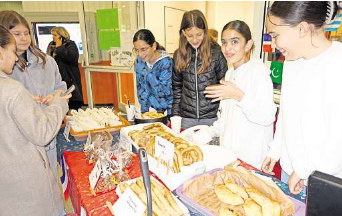
Die Schülerinnen und Schüler der 6g2 boten Kuchen und Gebäck aus ihren Herkunftsländern an.

wahrscheinlich in der dritten Welt. Wie nachhaltig sich das soziale Engagement auf Schüler auswirken kann, zeigt das Beispiel einer ehemaligen Schülerin. Sie engagiert sich noch immer für Kinder in Afrika und kam zum Winterfest an ihre Schule zurück, um für ihr Projekt zu sammeln.