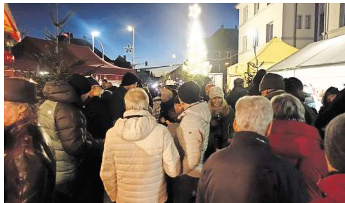
Brechtend voll war der Kastanienplatz an den beiden Weihnachtsmarkttagen.