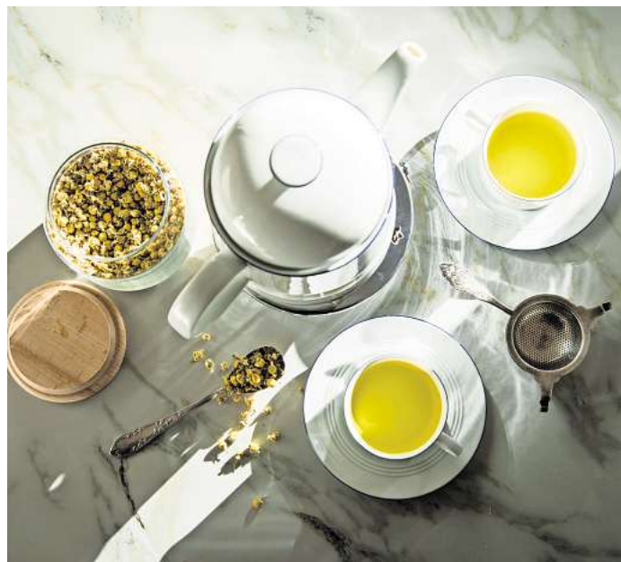
Für die Zubereitung von Tee empfiehlt der Deutsche Tee & Kräutertee Verband, das Wasser stets sprudelnd aufzukochen, um Keime abzutöten.