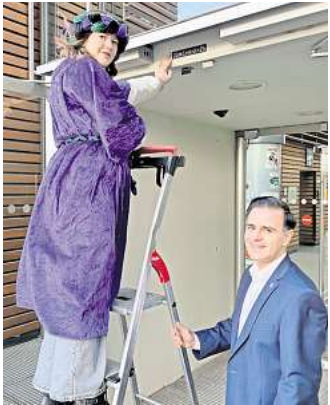
Die Sternsinger haben auch in diesem Jahr wieder ihren traditionellen Segen an der Rathausstür angebracht.