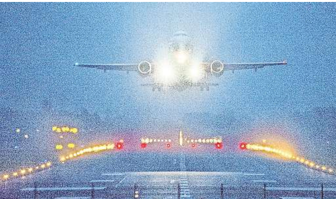
Lärmbelastung für Anwohner: Die Nachtflüge am Flughafen Hannover haben sich in den vergangenen Jahren deutlich erhöht.

Dazu gehört eine ausgewogene Nutzung von Nord- und Südbahn zwischen 1 und 5 Uhr. Größere Wartungsarbeiten an den Bahnen sollten nicht von