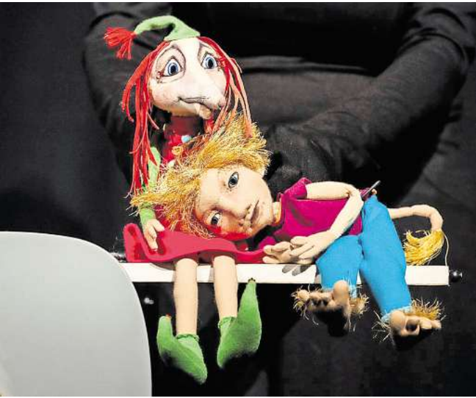
„Trollkinder können alles“: Die Geschichte einer wunderbaren Freundschaft ist in Garbsen und Seelze zu sehen.

die von Frieda geträumte Katastrophe ist, was dann? Erst einmal gemeinsam Tee trinken. Die Aufführung vom Figuren-