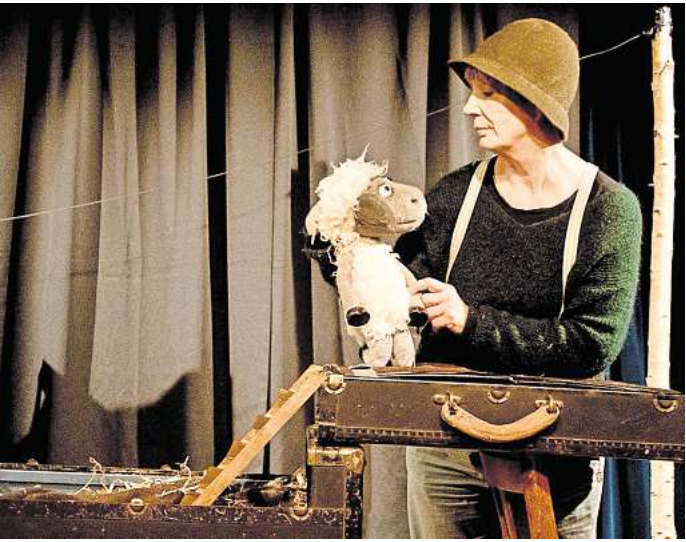
Theater für Kinder: In „Luise ist weg“ sucht der Schäfer nach einem kleinen Schäfchen. Dabei muss er sich beeilen, denn auch der Wolf hat Luises Spur aufgenommen.

die Bühne im Veranstaltungszentrum Alter Krug in einen Hof für den Schäfer, für Hund Bruno und für Huhn Agathe zu verwandeln und auch den Wolf und natürlich auch Luise fantasievoll auftreten zu lassen. Die Aufführung mit Puppen dauert rund 45 Minuten und ist für Kinder ab vier Jahren geeignet. Der Eintrittspreis beträgt 5 Euro für Kinder und 6 Euro für Erwachsene. Reservierungen für die Aufführungen im Veranstaltungszentrum Alter Krug, Hannoverstraße 15a, in Seelze nimmt das Kulturbüro der Stadt Seelze unter Telefon (05137) 828284 sowie per E-Mail an kulturbue-ro@stadt-seelze.de entgegen. Die Tageskasse öffnet jeweils eine halbe Stunde vor Vorstellungsbeginn. Vorbestellte Karten liegen an der Kasse bereit und sollten spätestens 15 Minuten vor Beginn abgeholt werden.