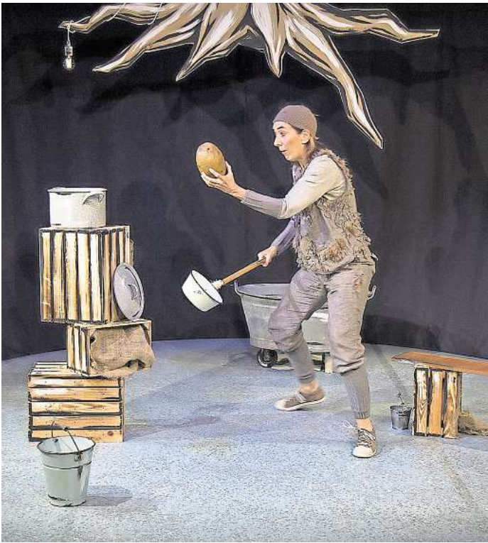
Theater für Kinder: Mit acht Theaterraufführungen übers Jahr verteilt will das Kulturbüro der Stadt Seelze viele kleinere und größere Kinder ins Veranstaltungszentrum Alter Krug locken. Dort wird am Freitag, 4. April, auch das Stück „Plötzlich war Lysander da“, eine einfühlsame und humorvolle Geschichte für Kinder ab vier Jahren, aufgeführt.