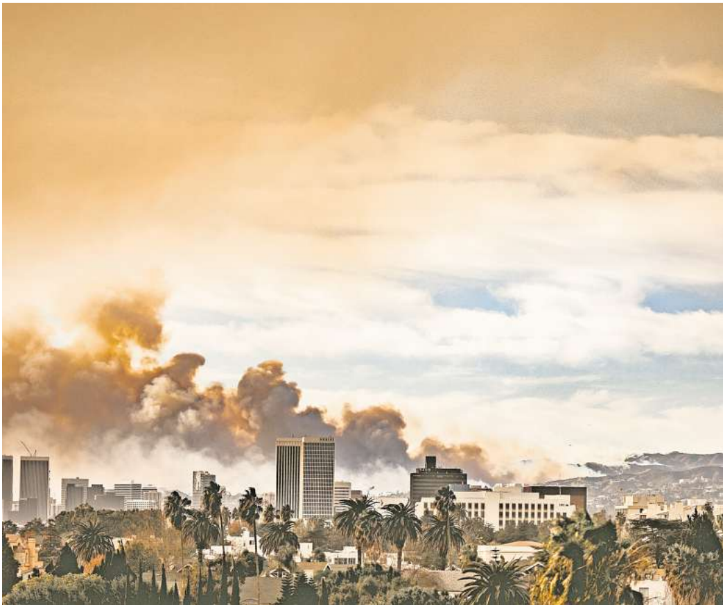
Die Brände in und um Los Angeles sind laut US-Regierung die verheerendsten in der Geschichte Kaliforniens.

bisher von den Spitzenkandidaten im Wahlkampf thematisiert werden. Scheinbar planen sie weite Teile der Gesellschaft für dumm zu verkaufen, und ihnen weiter einzureden, dass die Klimakrise uns schon in Ruhe lässt, wenn wir sie lange genug ignoriert haben.“ Zu den fatalen Folgen der Erderwärmung gehören je nach Region heftigere und häufigere Dürren, Stürme und Überschwemmungen, die schon jetzt