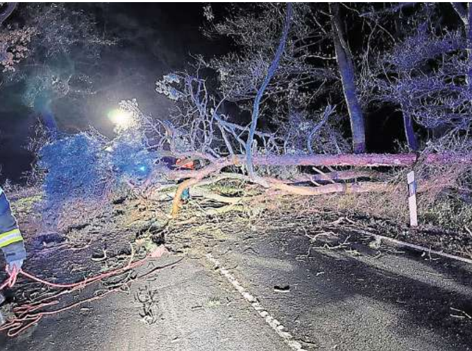
Die Ortsfeuerwehr Schloß Ricklingen musste beim Sturmtief am Montag einen umgestürzten Baum von der Burgstraße entfernen.