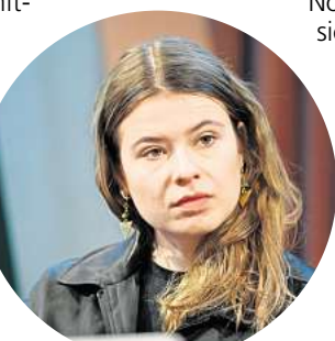
Klimaaktivistin Luisa Neubauer nahm in Berlin an einer Pressekonferenz von Fridays for Future zur aktuellen Klimapolitik teil.