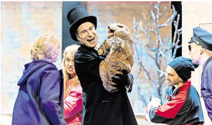
Das Theater für Niedersachsen zeigt am Sonnabend, 22. Februar, das Musical „Groundhog Day – Und täglich grüßt das Murmeltier“ im Forum der IGS.

Mit Jürgen Brehm, Elisabeth Köstner, Samuel Jonathan