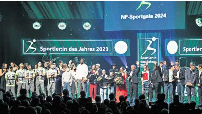
Nächste Woche haben wir ein Jubiläum: Am 28. Januar feiern wir die 30. NP-Sportgala.

sionen geplagter Nationaltorhüter vor ihnen auf der Bühne stand und locker plauderte.