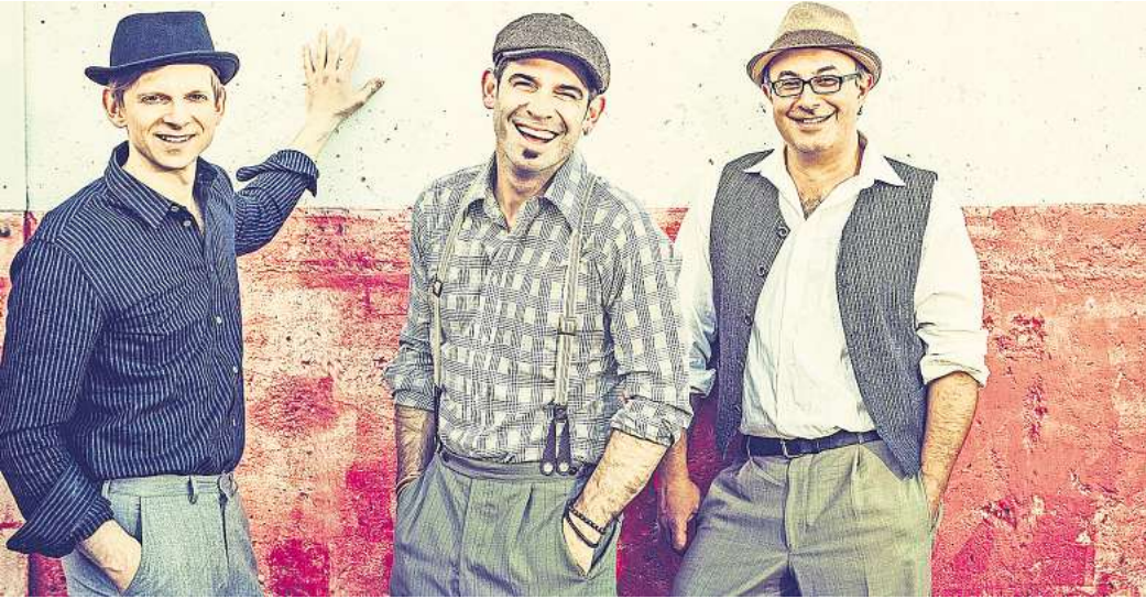
Tritt am 23. August in Garbsen auf: Die Band Marquess ist bei „Garbsen goes Beach“ am Rathausplatz dabei.

Der Berenbostel Chor ad libitum beginnt bereits mit den Proben für ein neues Programm. Darin wird Filmmusik erklingen, etwa aus „Titanic“, „Evita“ und „Wie im Himmel“. Einen Termin für den Auftritt in der zweiten Jahreshälfte gibt es noch nicht. Wann das Adventskonzert des Chores in der Stephanuskirche erklingt, indes schon: Der Auftritt ist für den 13. Dezember geplant. Und die Reihe Heitlinger Herbst startet mit dem Auftritt von B.B. & The Blues Shacks am 26. September.