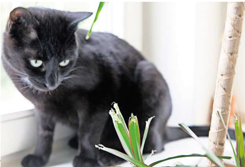
Haustiere und Zimmerpflanzen sind nicht immer eine gute Kombination: Viele beliebte Pflanzen können für Tiere giftig sein.

Wer bemerkt, dass der tierische Mitbewohner an einer giftigen Pflanze geknabbert hat, sollte eine Tierarztpraxis aufsuchen. Wichtig: Für eine gezielte Behandlung sollte man dem Tierarzt mitteilen können, welche Pflanze angeknabbert wurde oder zumindest aussagekräftige Fotos vom Gewächs zeigen können. Denn es gibt unterschiedliche Pflanzengifte. Tipp: Wer den Pflanzennamen nicht mehr weiß, kann auch mit Hilfe einer App herausfinden, um welches Exemplar es sich handelt.