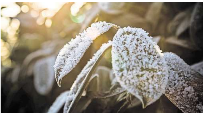
Robuster Gartenbewohner: Der Kirschlorbeer (Prunus laurocerasus) kommt gut mit frostigen Temperaturen zurecht.

Bei den frostharten immergrünen Gehölzen besteht die Gefahr, dass sie vertrocknen. Man muss also dafür sorgen, dass die Pflanze keine Feuchtigkeit verliert. Dafür gibt es Frostschutzabdeckungen. Mit Noppenfolie kann man den Topf einwickeln und ihn auf Styroporplatten stellen, um den Erdbal-