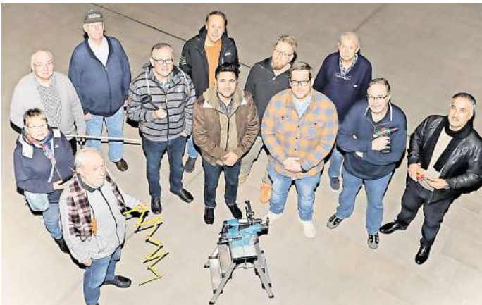
Der Ehrenamtliche Handwerkerdienst steht Menschen seit über zehn Jahren bei anfallenden Reparaturen im Haushalt zur Seite.

Oft sind es Kleinigkeiten, die einen vor unerwartete Herausforderungen stellen. In drei Meter Höhe ist eine defekte Glühbirne zu wechseln, die Schranktür schließt nicht mehr, die Fern-sehender sind verstellt. Für derartige Situationen gibt es bei der Stadt Garbsen seit über zehn Jahren das Ehrenamtsprojekt Ehrenamtlicher Handwerkerdienst. Das engagierte Team steht Menschen bei anfallenden Reparaturen im Haushalt zur Seite, die diese nicht mehr selbständig ausführen können.