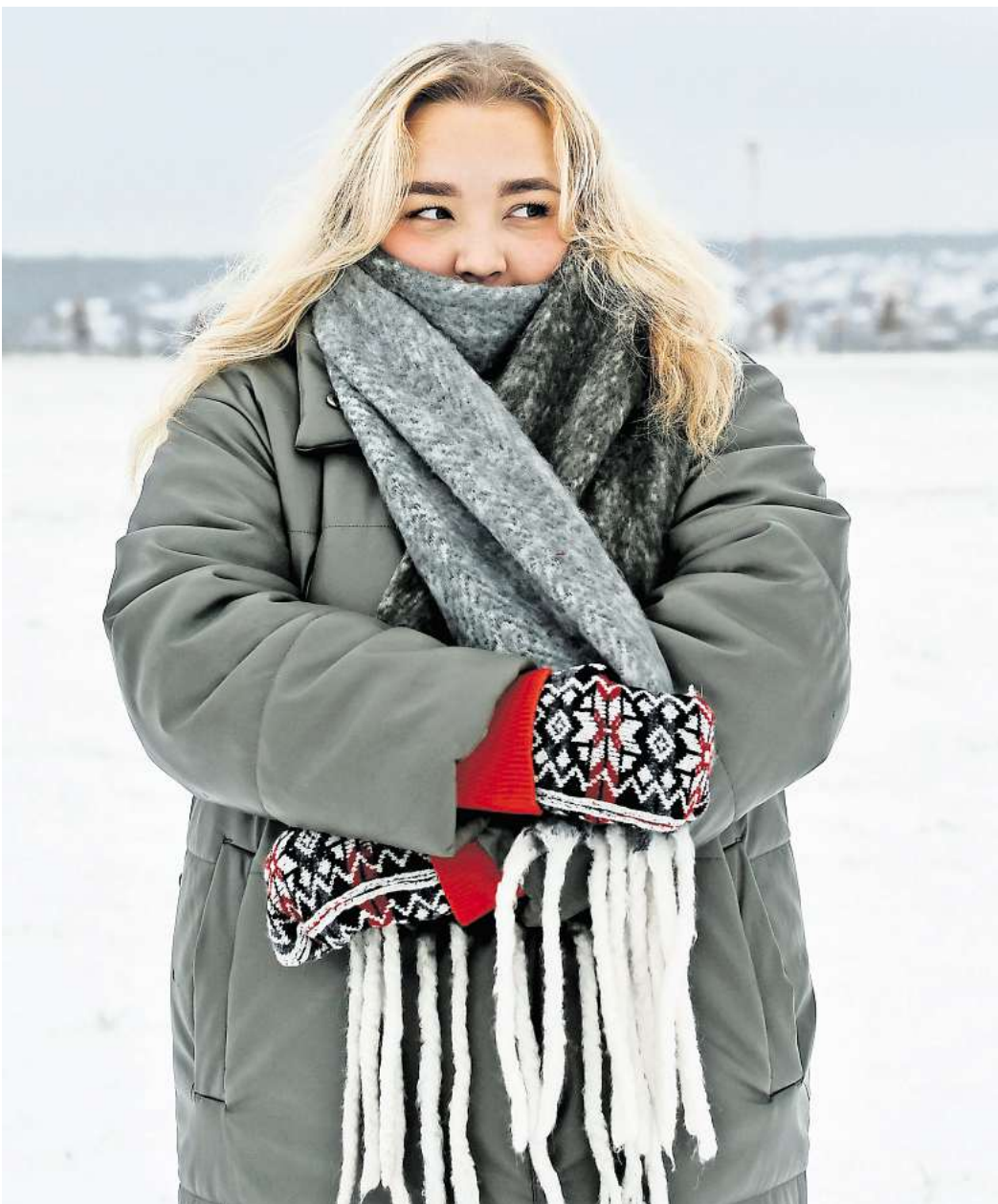
Wechselduschen und Zwiebellook helfen dabei, weniger zu frieren.

Wichtig dabei: In kritischen Situationen sollte man die Person lieber nicht von außen aufwärmen. Dabei würden die Gefäße