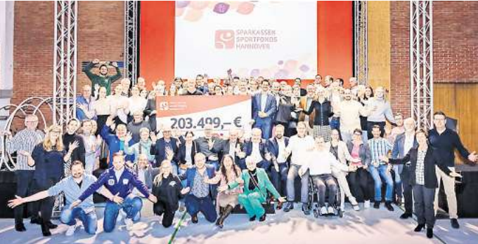
In 2024 legte die Sparkasse Hannover einen besonderen Schwerpunkt auf den Sport: Mit dem Sparkassen-Sportfonds förderte sie 129 regionale Sportvereine mit einer Gesamtsumme von mehr als 203.000 Euro.