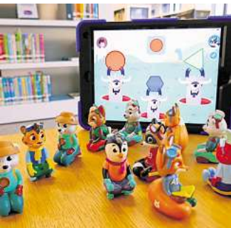
Edurino-Einzelfiguren können jetzt in der Stadtbibliothek Garbsen ausgeliehen werden.

Das Angebot eignet sich für Vor- und Grundschulkinder zwischen vier und acht Jahren. Sie können aus insgesamt 13 Figuren wählen. Das Lernkonzept von Edurino benötigt eine App, die kostenlos auf Tablets und Smartphones herunter geladen werden kann.