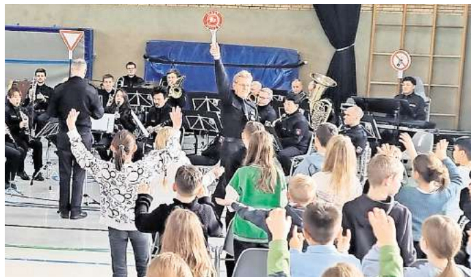
Mit sichtbarer Begeisterung waren die Kids bei der Sache.