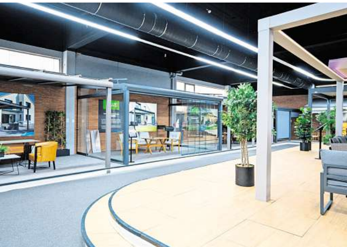
Der Ausstellungsraum bietet auf 750 Quadratmeter eine große Produktvielfalt.

AYlux Hannover GmbH Zeißstraße 66 30519 Hannover Telefon: (0511) 49532238 www.aylux.de