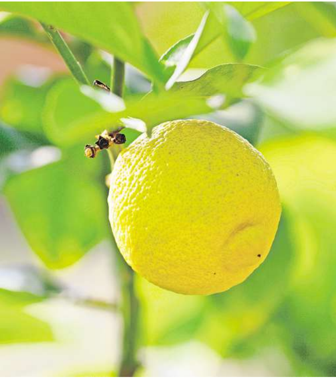
Das „Citrus-Fest“ in der Orangerie stellt die kostbaren Früchte, einst als „goldene Äpfel der Hesperiden“ gefeiert, in den Fokus: mit kulinarischen Genüssen,

Ein besonderes Konzerterlebnis steht am 25.Februar mit „Blütezeiten: Natur und Poesie“ im Rahmen der Reihe „Herrenhausen Barock“ auf dem Programm. Es ist ein Konzert im Rahmen der 8. Steffani-Festwoche in Hannover. Inmitten der Ausstellung in der Orangerie erklingen Musik und Auszüge aus den Briefwechseln der Komponisten und begeisterten Gärtner Telemann und Händel. Am 15. und 16. März rückt ein „Citrus-Fest“ in der Orangerie die kostbaren Früchte, einst als „golde-