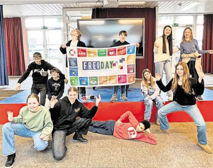
Die Schülerinnen und Schüler beider Schulen waren von dem Besuch und dem FREI DAY Lernkonzept begeistert.

Im Zuge des themenorientierten Unterrichts an der Oberschule, behandelten die Jahrgänge 7 und 8 das Thema „Streben nach Freiheit“, daher stand auch ein Ausflug nach Berlin an. Für viele dänische Schülerinnen und Schüler war dies der erste Besuch in der deutschen Hauptstadt. Auch die Schülerinnen und Schüler der Oberschule waren vom ersten Austausch be-