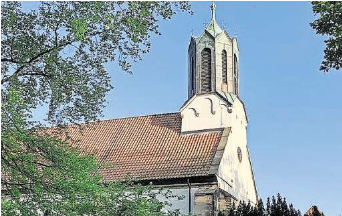
In der Klosterkirche Marienwerder feiert die Evangelisch-lutherische Kirchengemeinde Marienwerder-Havelse ihren Festgottesdienst zur Fusion.