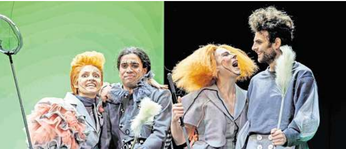
Das Kulturbüro präsentiert „Don Quijote“, ein turbulentes und vor Fantasie sprühendes Spiel voller Sprachwitz und Doppelbödigkeit, das neben aller Komik und Skurrilität der Figuren auch große Fragen aufwirft.