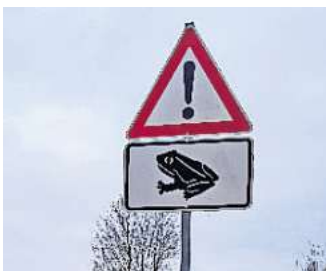
Die Krötenwanderung beginnt: Die Stadt Seelze bittet alle Verkehrsteilnehmenden, besonders aufmerksam zu sein und in beschilderten Bereichen maximal 30 Stundenkilometer zu fahren.“ So ist es richtig!

Ein wesentlicher Schwerpunkt der Krötenwanderung im Seelzer Stadtgebiet befindet sich in einem Kurvenbereich der Bundesstraße 441 in Höhe des Gewerbegebiets Seelze-Süd und der Kleingartenanlage Hortense. Dort weisen von der Stadt Seelze aufgestellte Verkehrsschilder auf die Krötenwanderung hin. Während der Wanderung zu ihrem Laichgewässer werden die von Norden kommenden Tiere in einigen Abschnitten dieses Bereichs über fest eingebaute Rinnen zu sogenannten Krötentunneln geführt, durch die sie unter der Bundesstraße hindurch geleitet werden. Ein Krötenschutzzaun