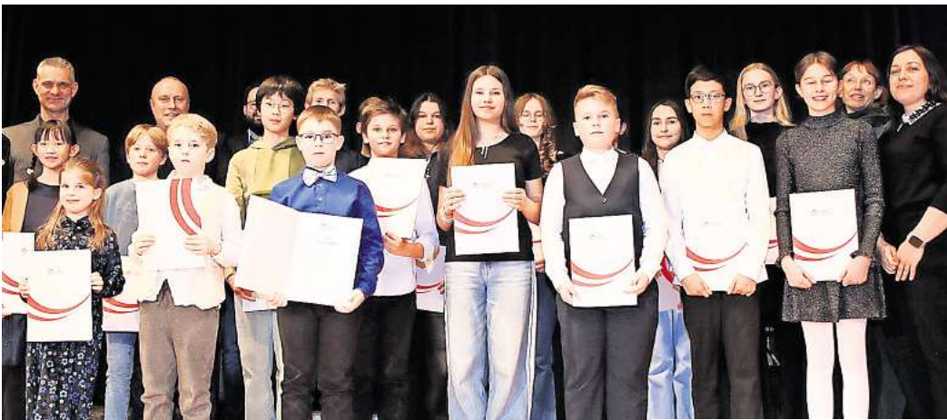
Alle Preisträgerinnen und Preisträger auf einen Blick: Stolz zeigen die anwesenden Sieger ihren Urkunden vor.