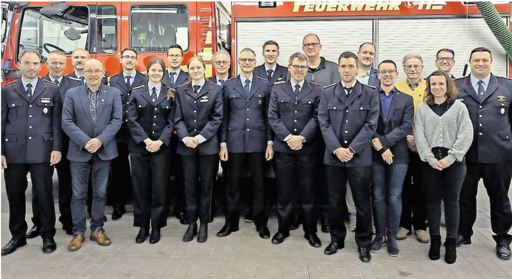
Das Foto zeigt die Geehrten, Beförderten und Gewählten der Ortsfeuerwehr Velber.