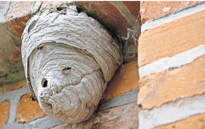
Rechtlich geregelt: Sind sie bewohnt, dürfen Wespennester nur von Fachleuten und aus guten Gründen entfernt werden – im Winter hingegen stehen sie leer, da können Hausbesitzer auch selbst ran.

man ein Wespennest, das leer ist, auch im Winter entfernen. Die neuen Jungköniginnen paaren sich erst, suchen ein Überwinterungsquartier und fangen dann im Frühling an, ein komplett neues Nest zu bauen. Das heißt, sie ziehen nicht wieder zurück in das alte Nest. Manchmal ist es aber auch gar