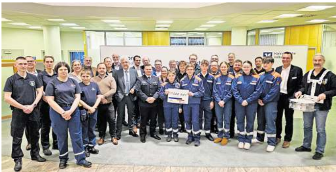
Engagierte Mitglieder aus neun Vereinen freuen sich über die Spenden der Hannoverschen Volksbank