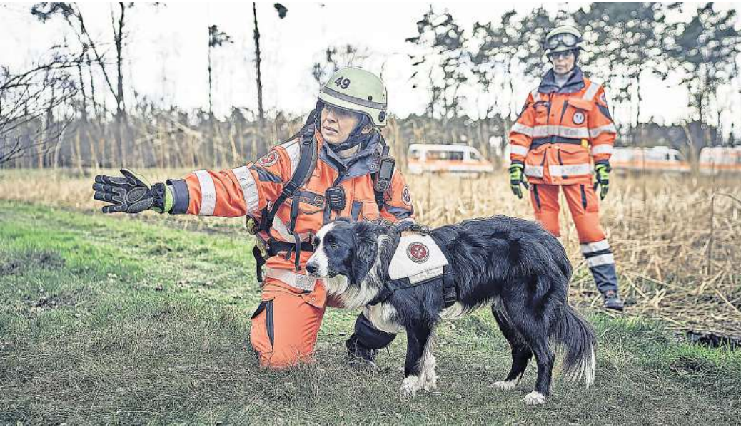
94 Ehrenamtliche waren im vergangenen Jahr in den Rettungshundestaffeln 365 Tage aktiv. Zusammen mit ihren Hunden sind sie unverzichtbare Teams, wenn es um das schnelle Auffinden und die Rettung von Menschen geht.