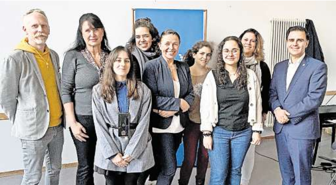
In Garbsen haben vier spanische Fachkräfte den Startschuss für eine zukunftsweisende Personalpolitik gegeben.

Es handelt sich um einen 27-Jährigen, der ohne festen Wohnsitz ist. Nach der Beschreibung kommt der 27-Jährige auch für weitere Fälle des Ansprechens von Kindern, auch an anderen Schulen, in Frage. Nach den polizeilichen Maßnahmen wurde er in die Psychiatrie nach Wunstorf gebracht. Eine Strafanzeige wegen Widerstands gegen Vollstreckungsbeamte wurde eingeleitet. Inwiefern die Belästigung der Kinder strafrechtlich verfolgt werden kann, wird noch geklärt.