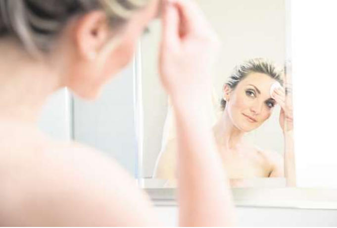
Damit die Gesichtshaut Pflegeprodukte gut aufnehmen kann, sollte sie vorher gründlich gereinigt werden.