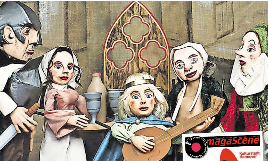
„Es lebe der König“ im Theatro.

Das Trio Gruberich aus Oberbayern spielt am 16. März ab 10.30 Uhr im Schloss Landestrost, in Neustadt am Rübenberge das Kinder-Erzählkonzert „Die Kuh will mehr“. Dabei geht es um eine Kuh, die Gedichte schreibt und Sehnsucht nach dem Meer bekommt. Das Erzählkonzert lädt zum Lauschen und Mitmachen ein. Ohrenzwinkernd umspielen Gruberich eine Geschichte über eine abenteuer-