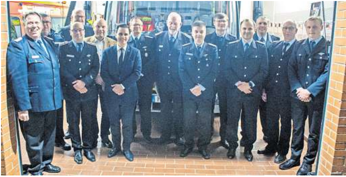
Die Geehrten und Beförderten der Ortsfeuerwehr Meyenfeld stellen sich gemeinsam mit dem Bürgermeister und dem Stadtbrandmeister zum Gruppenfoto auf.

feuerwehr Meyenfeld ihr 100-jähriges Bestehen. Der Termin für die Feierlichkeiten steht bereits fest – am 20. Juni 2026 wird das Jubiläum gebührend gefeiert.