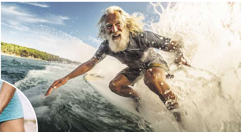
Müde und beanspruchte Muskeln? Viele vertrauen dabei auf Rubaxx Cannabis CBD Gel.

Der älteste Hanf-Fund in Europa liegt in Deutschland und wird auf 5500 v. Chr. datiert. Damals war jedoch noch nicht zu erahnen, dass insbesondere der Cannabisstoff CBD einmal einen Siegeszug in der Wissenschaft antreten würde. Heute ist ein regelrechter CBD-Boom ausgebrochen. Kein Wunder, denn anders als der ebenfalls bekannte Cannabisstoff THC (Tetrahydrocannabinol), der für die berauschende Wirkung der Cannabisdroge verantwortlich ist, macht CBD weder „high“ noch abhängig. Sogar die WHO (Weltgesundheitsorganisation) stuft CBD als sichere Substanz mit einem geringen Risiko ein. 1 Zahlreiche Studiendaten deuten bereits darauf hin, dass CBD einen äußerst vielfältigen therapeutischen Nutzen haben könnte.