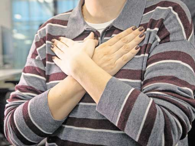
Überforderung, Angst oder emotionale Belastung? Dann kann die Selbstberuhigungsmethode «Butterfly Hug» helfen, zu entspannen.

Mit geschlossenen Augen kann man sich oft noch besser auf die