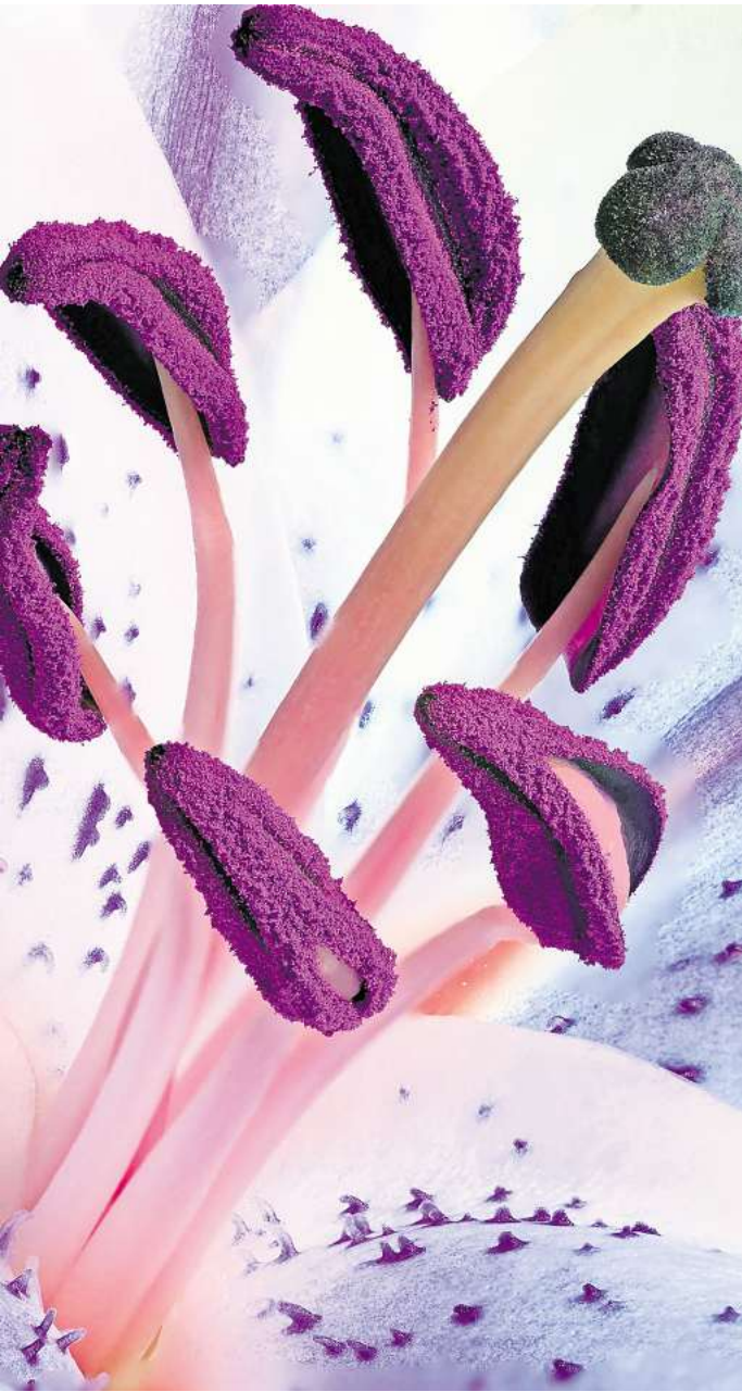
Mithilfe von Pollen können sich Pflanzen vermehren.