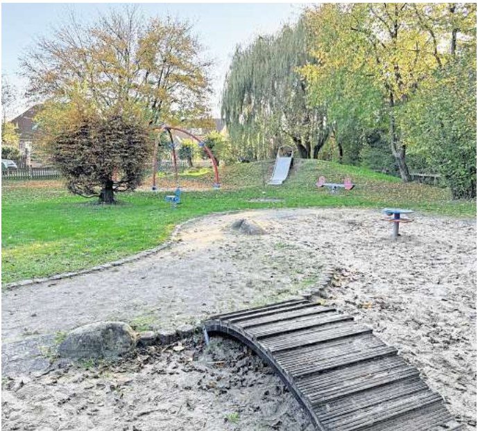
In einer Stärken-Schwächen-Analyse hat die Stadt jetzt die 62 öffentlichen Spiel- und Freizeitplätze in Seelze unter die Lupe genommen. Wie fällt das Ergebnis aus?

Weitere 138.840 Euro brächte zudem der Verkauf des Grundstücks an der Gartenstraße in Velber ein, wie aus der Analyse hervorgeht. Dort befindet sich aktuell ein Spielplatz, den die Stadt als entbehrlich einstuft. Ein Verkauf würde laut Verwaltung jährliche Einsparungen von Unterhaltungskosten in Höhe von etwa 9000 Euro bedeuten.