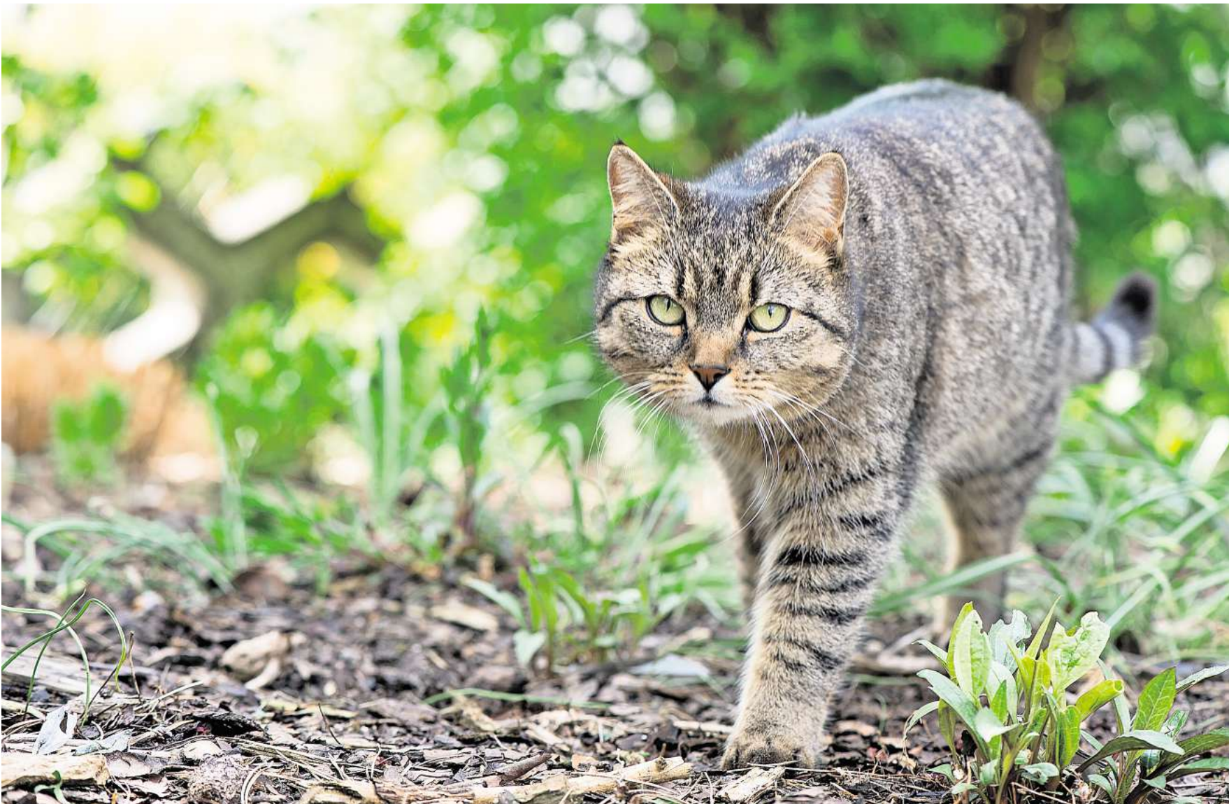
Ist die Bindung zum Heim gefestigt, bietet der Garten eine Möglichkeit für einen kontrollierten Freigang.

Nachts sollten aber auch Freigänger lieber in der Wohnung oder im Haus bleiben. Sollte das nicht so sein, sorgt ein reflektierendes Halsband mit Sicher-