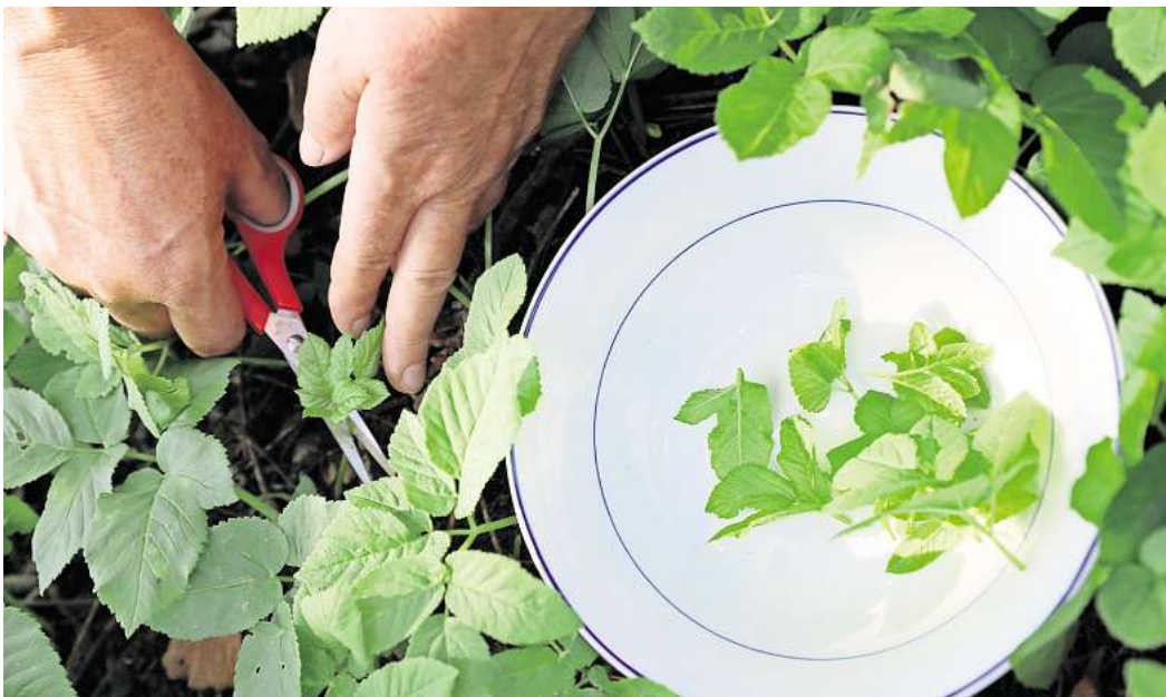
Vom Garten in die Küche: Giersch kann zum Beispiel als Zutat in Suppen oder als Pesto verwendet werden.