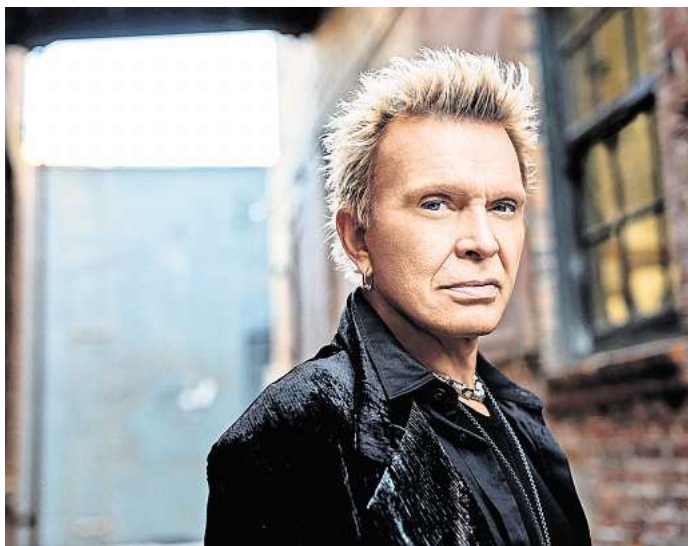
Billy Idol rockt am 18. Juni auf der Waldbühne Northeim