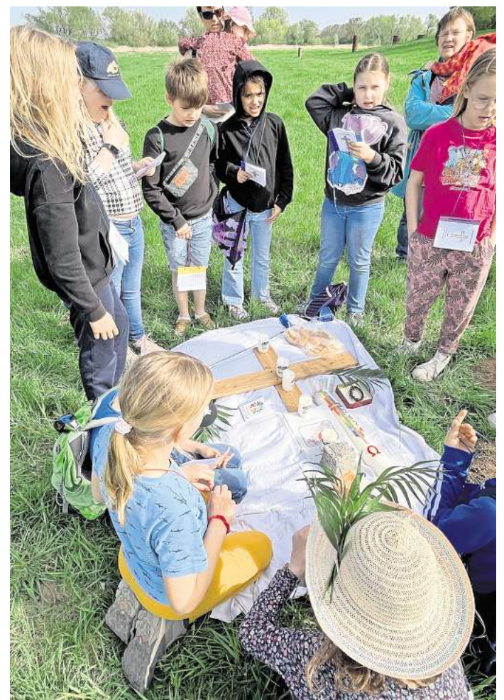
Mit großem Ernst, aber auch mit Freude nahmen die Kinder an dem Kinderkreuzweg im Bürgerpark teil.

Abschließend legten die Kinder nacheinander gelbe „Sonnenstrahlen“ um das Kreuz. Dieses Symbol veranschaulicht, wie Jesus mit seinem Licht alle Dunkelheit vertreibt – ein Licht, das gerade an Ostern besonders gefeiert wird. Die Sonnenstrahlen stellten einen lebendigen Kontrast zu dem ernsten Kreuz dar und machten den Kindern auf anschauliche Weise deutlich, dass immer wieder Hoffnung und