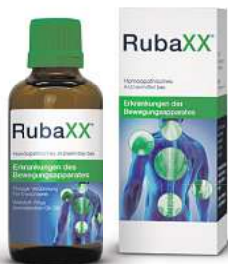
Abbildung Betroffenen nachempfunden

Für Ihre Apotheke: Rubaxx (PZN 13588561)