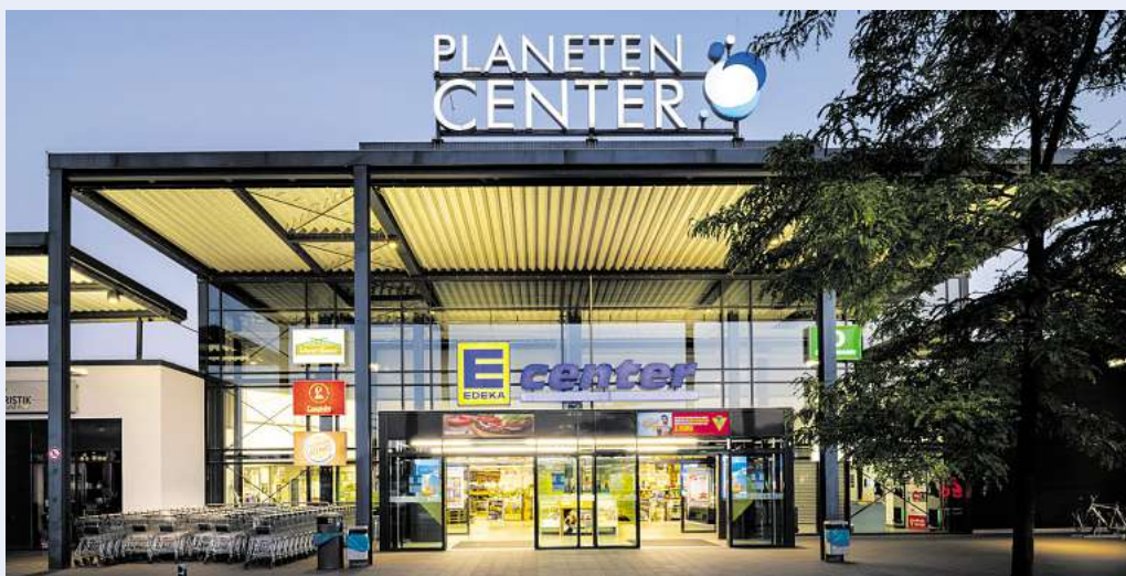
Tolle Angebote und eine angenehme Atmosphäre: Willkommen im Planetencenter Garbsen.

Seit 2015 gibt es im Planetencenter mit Brillenliebe by Foth das Augenoptik-Fachgeschäft für gutes Sehen an der Adresse Planetenring 31 bis 33. Der handwerklich perfekt gemachten Sehhilfe geht eine sorgfältige Analyse voraus. Dank der professionellen Typberatung findet jeder eine Brille, die optimal zum Typ passt. Denn die Kundschaft soll gut sehen und natürlich selbst gut aussehen. Frische Säfte, hochwertiges