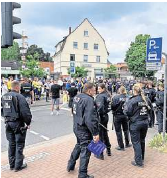
Großeinsatz für die Polizei: An allen Zufahrtsstraßen Garbsens stehen schwer bewaffnete Einheiten.

Geholfen hat Peschke auch die Tatsache, dass der MDR das Relegationsspiel kurzfristig live im TV übertragen hat. „Ich