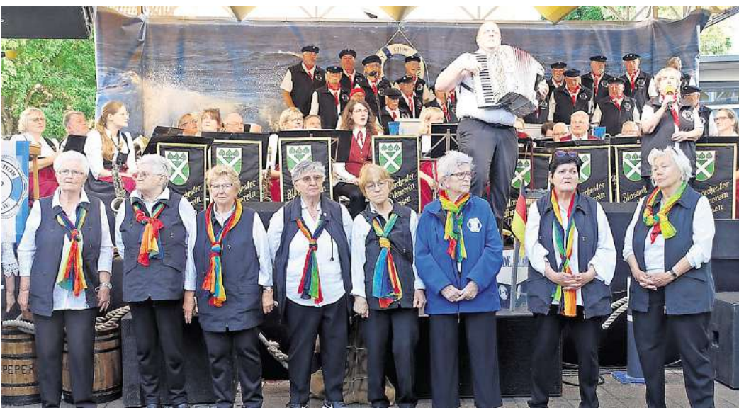
Schon zum Start am Freitagabend mit dem gemeinsamen Konzert des Musikvereins Dedensen und des gastgebenden Shanty-Chors war der Rathausplatz gut gefüllt.

Bemerkenswert war auch die Kollekte mit 460 Euro. Die Hälfte davon geht an den Verein „Hilfe für unsere Kinder“, den der Shanty-Chor seit vielen Jahren unterstützt, die andere Hälfte an den Seelzer Brotkorb. Und die hatten sich die Mitglieder des Brotkorbs redlich verdient. Mit rund 20 Kuchen und Torten hatte die Spendenfreudigkeit der Bevölkerung einen Tiefpunkt erreicht, so dass im Laufe der drei Tage rund 70 Kuchen nachgebacken werden mussten.