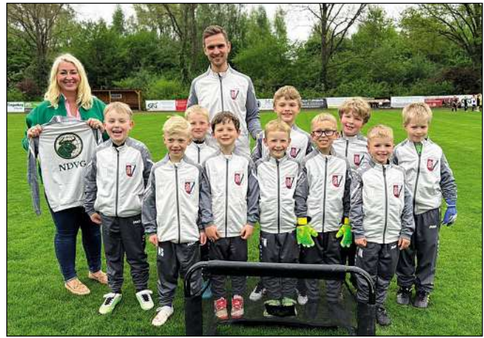
Schloß Ricklingen - Die Nachwuchstalente des TSV Schloß Ricklingen dürfen sich über eine großzügige Unterstützung freuen: Die Norddeutsche Vermögensgesellschaft (NDVG) hat neue Trainingsanzüge für die Fußballjugend gesponsert. Bei der offiziellen Übergabe strahlten die jungen Kicker vor Freude. Die neuen Anzüge sind nicht nur praktisch, sondern stärken auch den Teamgeist und das Zusammengehörigkeitsgefühl der Nachwuchsmannschaften.

Die Vogelhochzeit hat in vielen Varianten und Sprachen singend und spielend das musische Leben von Millionen Kindern geprägt. Ebenso viele Erwachsene erinnern sich an diese unvergessliche Zeit ihres Lebens und erleben sie heute neu mit den eigenen Kindern oder Enkeln. Die Lieder sind wahre Klassiker des Kinderzimmers geworden.