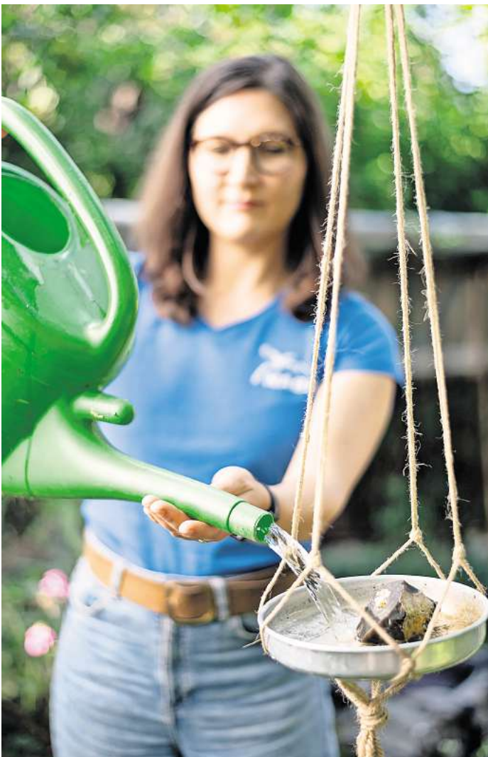
Naturnah Gärtnern: Wasserstellen sollten Tieren Ausstiegsmöglichkeiten geben, zum Beispiel kleine Steine.

Für die Trinkstellen eignen sich spezielle Vogeltränken aus dem Fachhandel, ebenso aber auch flache Schüsseln oder Untersetzer. Wichtig ist, dass sie einen rauen Boden haben, damit die Tiere Halt finden. Die Tie-