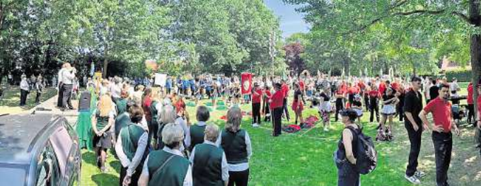
Sammeln und Antreten der Vereine zum festlichen Umzug am Sonntag im Werner-Baermann-Park.

Die Organisatoren des Festes blickten zufrieden auf ein gelungenes und erfolgreiches Jubiläumfest, welches die Mühen der langwierigen und umfangreichen Vorbereitungen wettmacht.