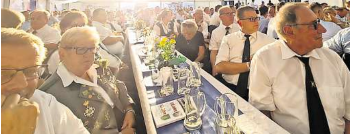
Feierlicher Kommerz am Freitagabend mit zahlreich geladenen Gästen.