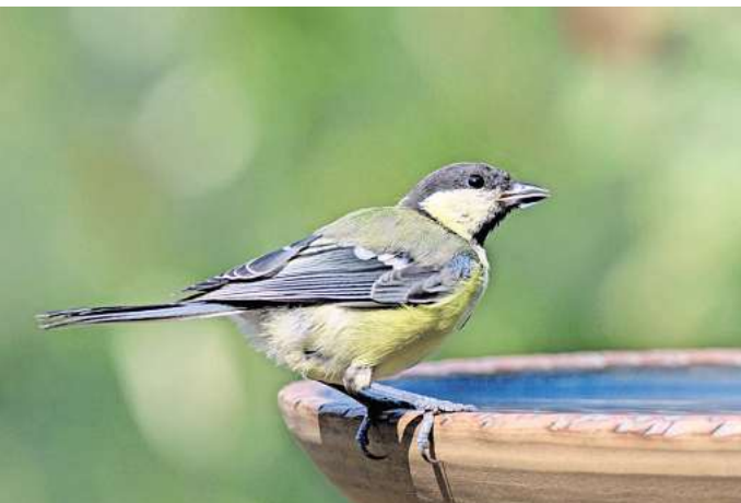
Vogeltränken sollten eine rauen Boden haben, damit die Tiere Halt finden.

„Jede Wasserstelle sollte unbedingt mit einem großen Ast, Stein oder Holzstück ausgestattet sein. Dies dient nicht nur Vögeln als sicherer Landeplatz,