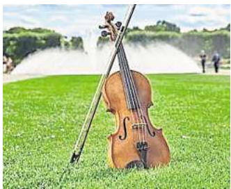
Barocke Spiele, Märchen und Musik sind in der „Sonntags“-Reihe im Garteneintritt enthalten.

ein Blechbläser-Ensemble, und am 28. September, treffen sich E-Piano und Trompete. RED