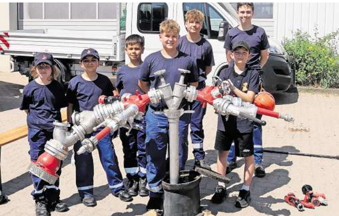
Orientierungslauf: Gruppe 1 der Jugendfeuerwehr Seelze an der Station Kuppeln.

wehr Seelze. Die Urkunden wurden stellvertretend für die Kinderfeuerwehr von Wiebke Blume und für die Jugendfeuerwehr von Marcel Klose in Empfang genommen. Besonders erfreulich war, dass auch Gründungsmitglieder der Jugendfeuerwehr Seelze sowie ehemalige Kinder- und Jugendfeuerwehrwärter der Einladung zur Jubiläumsfeier gefolgt sind. Nach einem gemeinsamen Abendessen vom Buffet in der festlich geschmückten Fahrzeughalle, wurde ausgiebig getanzt und gefeiert. Das besondere Highlight des Abends war die Live-Band „Die Bandmanufaktur – Lochmann & Holzinger“, welche die Feuerwache Seelze zum Beben brachte und für eine ausgelassene Stimmung sorgte. Für die passenden Lichteffekte sorgte die Seelzer Firma LichtKlang. Während der gesamten Veranstaltung konnten die Gäste auf einem Fernseher Fotos aus den vergangenen 60 Jahren Jugendfeuerwehr und 10 Jahren Kinderfeuerwehr ansehen. Alte Fotos weckten bei einigen Anwesenden Erinnerungen; So manche „Geschichte am Lagerfeuer“ wurde dazu erzählt.