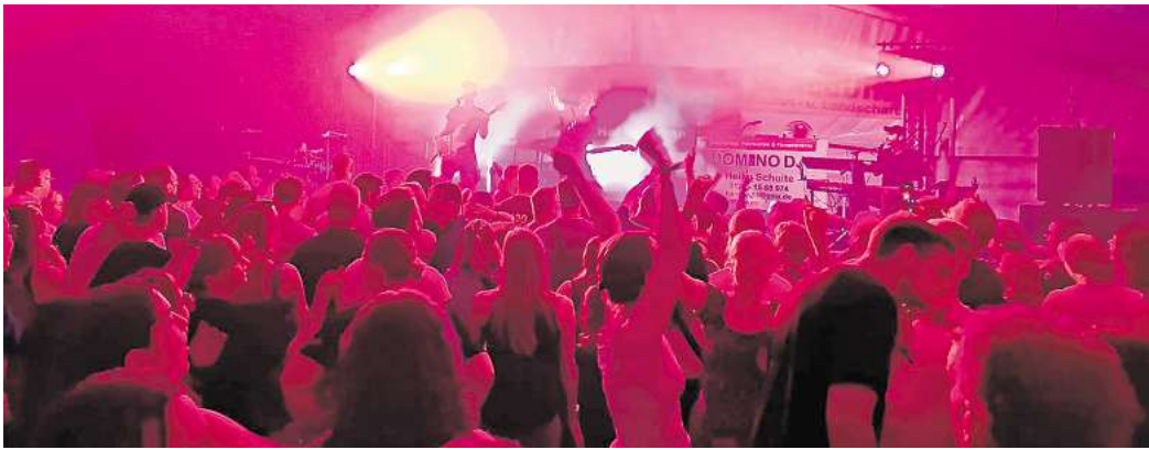
„Volles Haus“ zur Party im Zelt am Samstag mit „The Jetlags“.

Der Samstag stand im Zeichen der Freiwilligen Feuerwehr. Zum Tag der offenen Tür mit großer Fahrzeugshow, Blaulichtmeile, Vorführungen und viel Programm für Groß und Klein kamen zahlreiche Schaulustige auf das Gelände rund um