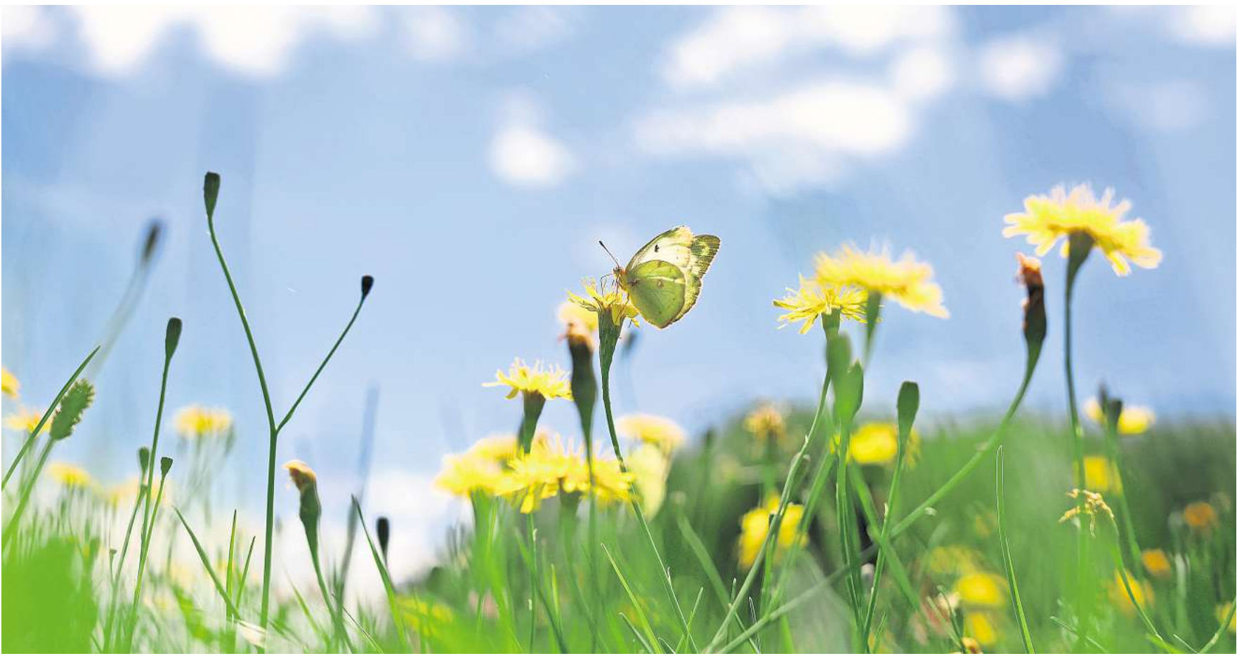
Ein Weißklee-Gelbling sitzt auf einer Blumenwiese auf einer Blüte.

die Chance, zu wachsen. Diese Pflanzen sind eine wertvolle Nahrungsquelle für Wildbienen, Schmetterlinge und andere Insekten, da sie Nektar und Pollen enthalten. Ein ständig kurz gemähter Rasen schränkt die biologische Vielfalt im Garten ein. Denn vielen Insekten gehen dadurch Schutz und Nahrung verloren. Und fehlen Insekten, mangelt es wiederum Vögeln, Igeln und Fröschen an Fressen. Blühpflanzen und hohes Gras locken mehr Nützlinge in den Garten. Neben Vögeln sorgen dann auch Marienkäfer, Florfliegen und Schlupfwespen dafür, dass Blattläuse und Schnecken nicht das angebaute Gemüse wegfuttern. Dicht gewachsenes Gras ist zudem ein Rückzugsort für Igel, Gartenschläfer und Amphibien. Auch Laub oder Totholz sollte man hier ruhig liegen lassen. Für viele heimische Tiere schafft man damit einen wertvollen Lebensraum und erhält so die Vielfalt im Garten. Wer auf automatische Mähroboter nicht verzichten will, sollte daran denken, die kleinen Tiere vor den scharfen Messern zu schützen – indem er den Roboter