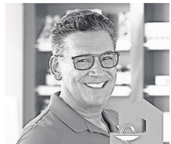
Dr. Erdals Gesundheitstipps

Die Gastritis kann aber auch schleichend und dauerhaft verlaufen, sie wird dann als chronische Gastritis bezeichnet. Eine akute Gastritis kann sehr leicht in einen chronischen Verlauf übergehen.