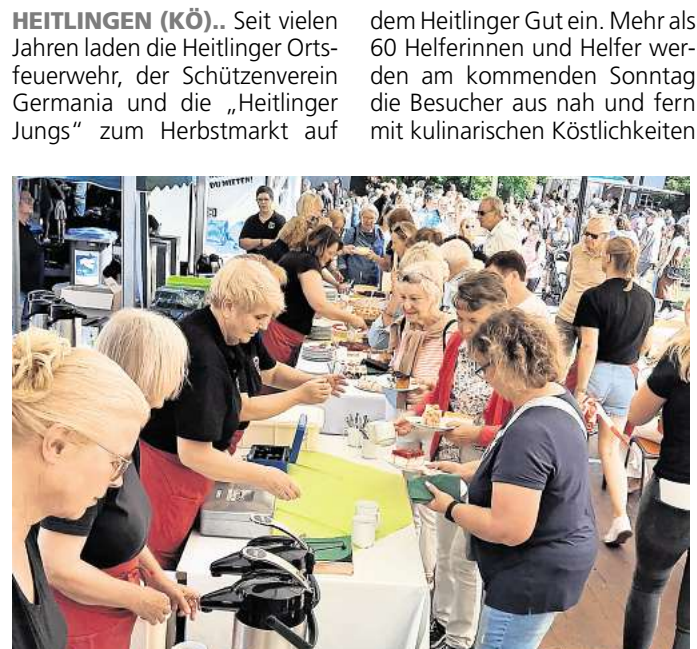
Bei schönem Wetter werden Festzelt und Stände gut besucht sein.

Interessenten können sich gerne bei Ursel Teubert unter Telefon (0163) 2439708 melden und einen Termin zum „Schnuppern“ vereinbaren.