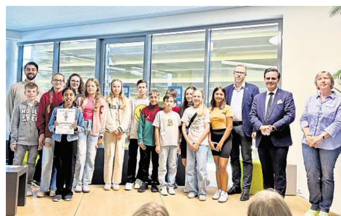
Die 6c hat Grund zur Freude: Bei der Abschlussveranstaltung des JULIUS-CLUBS gibt es für sie einen Gutschein als Anerkennung fürs Viellesen.

Besonderen Applaus erhielt die Klasse 6c (ehemals 5c) des Johannes-Kepler-Gymnasiums, die sich mit 14 Mitgliedern beteiligte und gemeinsam den Rekord von 102 Bewertungen erreichte. Als Anerkennung überreichte der Bürgermeister zur