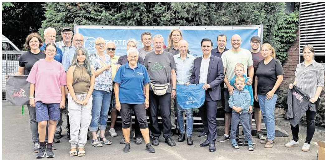
Vorbilder in Sachen Umwelt- und Klimaschutz: Die Radlerinnen und Radler des Stadtradelns aus Garbsen.

Das Radlergrillen dient als herzliches Dankeschön für alle Teilnehmenden, die sich im Zeitraum vom 18. Juni bis 7. Juli wieder für den Klimaschutz auf dem Fahrrad eingesetzt