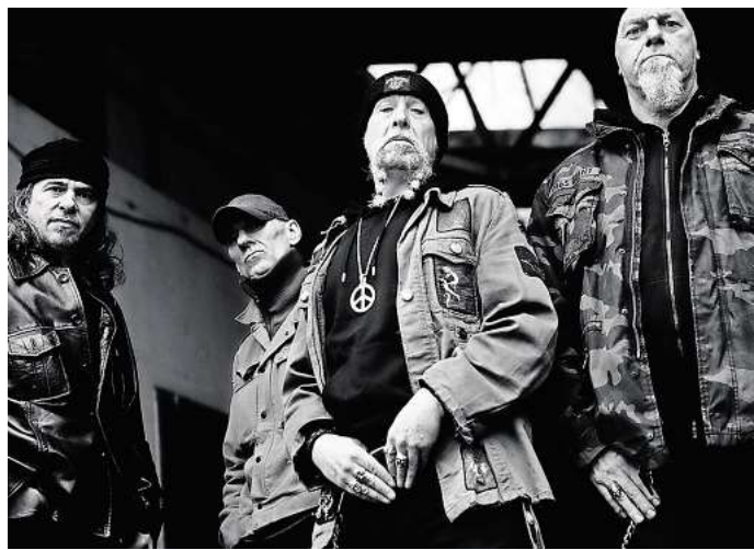
Schrei! spielt am 6. September.

aktivoptik Rote Reihe 19 in Garbsen-Berenbostel 05131.47 69 49