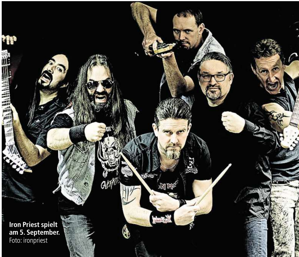
Iron Priest spielt am 5. September.

Freitag startet das Fest um 15 Uhr. Das Musikprogramm beginnt um 15.30 Uhr mit Sick Lick. Die Hardrockers werden das Publikum gleich ordentlich auf Betriebstemperatur bringen. Ab 17 Uhr gehört die Bühne dann The Nifties, die bereits seit 1998 diverse Bühnen mit ihrem Punk-injected Rock'n'Roll bespielt haben. Tickbreeder bringen Euch ab 18.30 Uhr echte Evergreens des Punkrock von den Sex Pistols, Ramones, Dead Kennedys, The Clash und auch eigene Songs mit. Die letzte Band des Tages sind dann ab 20 Uhr Iron Priest. Wie der Name schon vermuten lässt, haut Euch die 5-köpfige Band aus Rotenburg an der Wümme feinste Metal-Coversongs von Iron Maiden, Judas