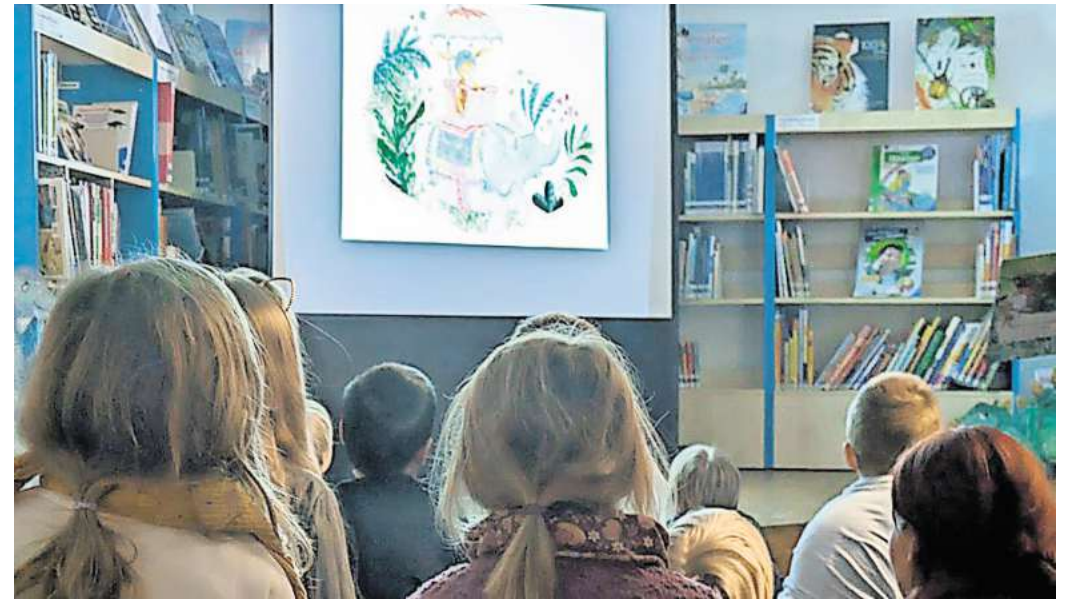
Im Bilderbuchkino der Stadtbibliothek Seelze beweist das Kaninchen großen Mut und überlegt, wie es dem kranken Drachen helfen kann. Foto: Stadt Seelze

Ein mutiges Kaninchen hilft einem kranken Drachen