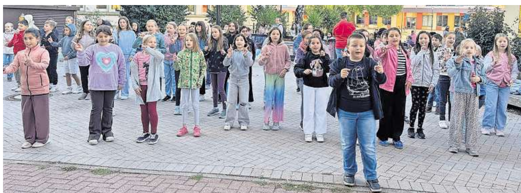
Vor der Brüder-Grimm-Schule in Letter haben Schülerinnen und Schüler mit einem Flashmob tanzend auf die Sicherheitsprobleme auf ihrem Schulweg aufmerksam gemacht.

Autos stehen, wir wollen alleine gehen“, heißt es in dem Song, der mit dem Rapper erarbeitet wurde. Gemeinsame Lösungen entwickeln. Seit längerer Zeit ist die Mobilität vor der Brüder-Grimm-Schule (BGS) ein Sicherheits- und Wohlfühlproblem. Zu viel Verkehr, enge Wege und wildes Parken prägen die Straße vor der Schule. Die Stadt Seelze möchte, dass die BGS mehr Raum für die Selbstständigkeit der Kinder bietet. Einige Ideen wurden schon ausprobiert, bisher gibt es jedoch noch keine dauerhafte Lösung. „Jetzt wollen wir Ideen bündeln und zusammen mit der Schule, den Kindern, Eltern, Anwohnenden und allen, die täglich betroffen sind Lösungen entwickeln“, so Bürgermeister Alexander Masthoff, der hinter der Aktion steht