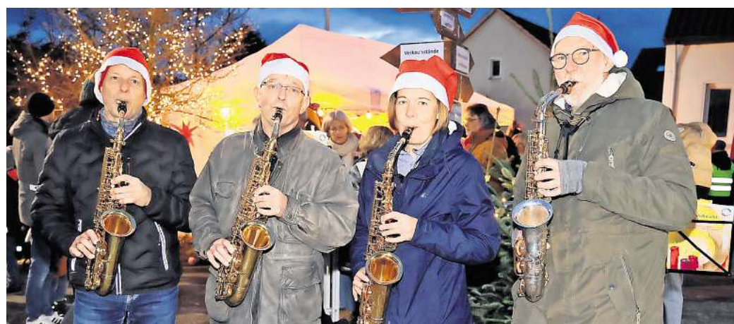
Platzkonzert: Auf dem Adventsmarkt stimmt die Formation Altsaxtett mit (von links) Roland, Wilfried, Conny und Gerhard die Besucher mit weihnachtlichen Saxofon-Klängen auf das Fest ein.