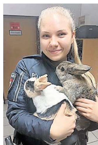
Die Polizei brachte sie ins Tierheim: Diese Kaninchen wurden in Garbsen ausgesetzt.

Das Aussetzen eines in Obhut genommenen Tieres gilt als Ordnungswidrigkeit im Sinne des Tierschutzgesetzes. Demzufolge haben die Beamten ein Verfahren eingeleitet. Die Kaninchen sind unterdessen vorerst im