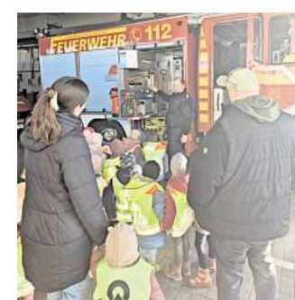
Ein besonderer Höhepunkt war der Besuch im Feuerwehrhaus. Alle Kinder durften einmal im Löschfahrzeug Platz nehmen.

„Rauchmelder retten Leben“, ist für die Kinder der Kita An den Grachten ein wichtiges Thema geworden; Mit schrillen Tönen warnt der Rauchmelder bei einem Brand z.B. in der Nacht im Kinderzimmer. Spannend war natürlich die Vorführung „Anzünden eines Streichholzes“ und