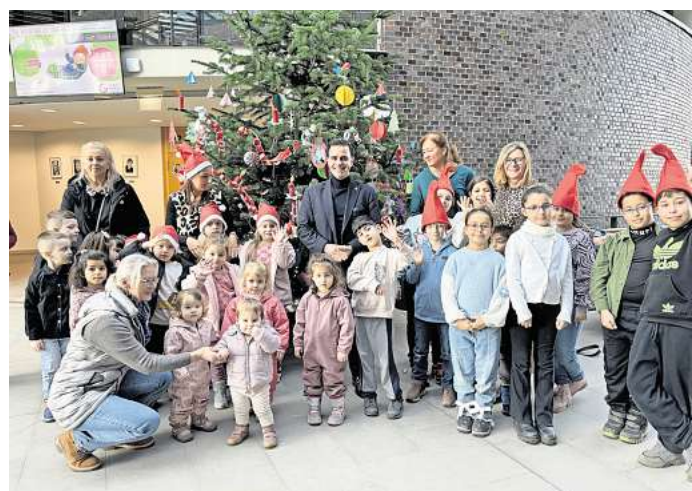
Das ist richtig schön geworden: Die Kinder von der Kindertagespflege haben den Weihnachtsbaum in der Rathauhalle geschmückt.

Mit Dank wurde nicht gespart. Bei Kakao und Keksen lobte der Bürgermeister die Kinder für ihr Engagement. Anschließend ging es in die Rathauhalle, wo der festlich geschmückte Baum entstand. Als weiteres kleines Dankeschön übergab der Bürgermeister zwei neue Spiele an