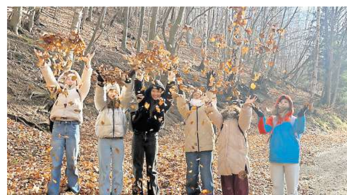
Die Jugendlichen aus Lanzarote unternahmen eine winterliche Wanderung im Harz.

Zum Abschluss der Austausch-Woche kamen mehr als 50 Schülerinnen und Schüler aus verschiedenen Jahrgängen zu einem Europa-Quiz rund um die Kanarischen Inseln zusammen. Für eine humorvolle Über-