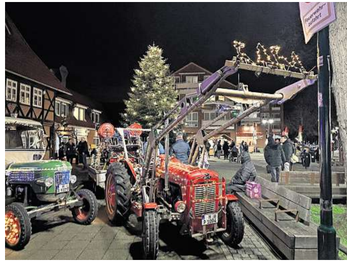
Lichterfahrt: Viele Stunden haben die Vereinsmitglieder investiert, um ihre Traktoren zu schmücken.