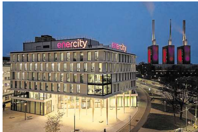
enercity Netz übernimmt zum 1. Januar 2026 den Stromnetzbetrieb der Stadt Garbsen.

kes Zeichen für eine nachhaltige und sichere Energieversorgung. Wir freuen uns sehr, diese ver-