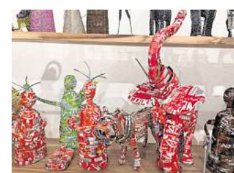
Kunst aus Müll: Aus Simbabwe stammen diese Krippenfiguren aus alten Cola-Dosen.

Tee, Kaffee und Kekse bereit. Kinder zahlen 3, Erwachsene 5 Euro und Gruppen je nach Größe mindestens 50 Euro. Das Geld fließt in den Erhalt des Krippenhauses. Bei den Führungen wird Oliva von zehn Ehrenamtlichen unterstützt. Eine individuelle Führung lässt sich unter Telefon (0175) 2557545 buchen.