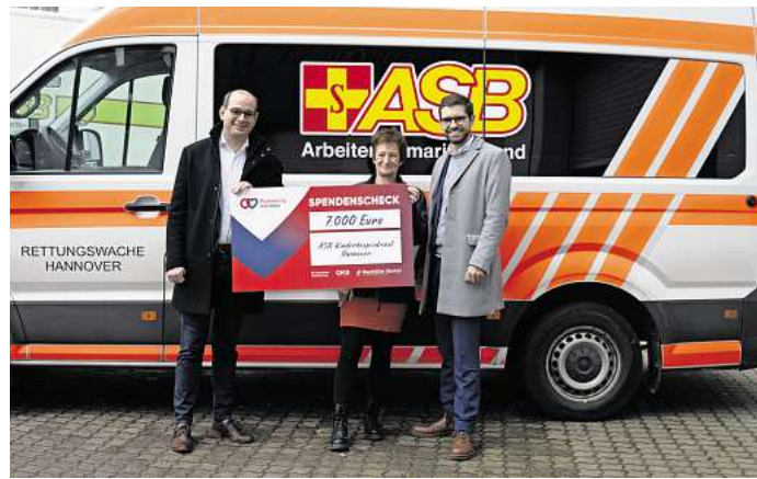
„Bewegung mit Herz“. Mitarbeitende von OMS Retail sowie der N&B Unternehmerstiftung haben gemeinsam 7.000 Euro für den ASB-Kinderhospizdienst Hannover erlaufen.