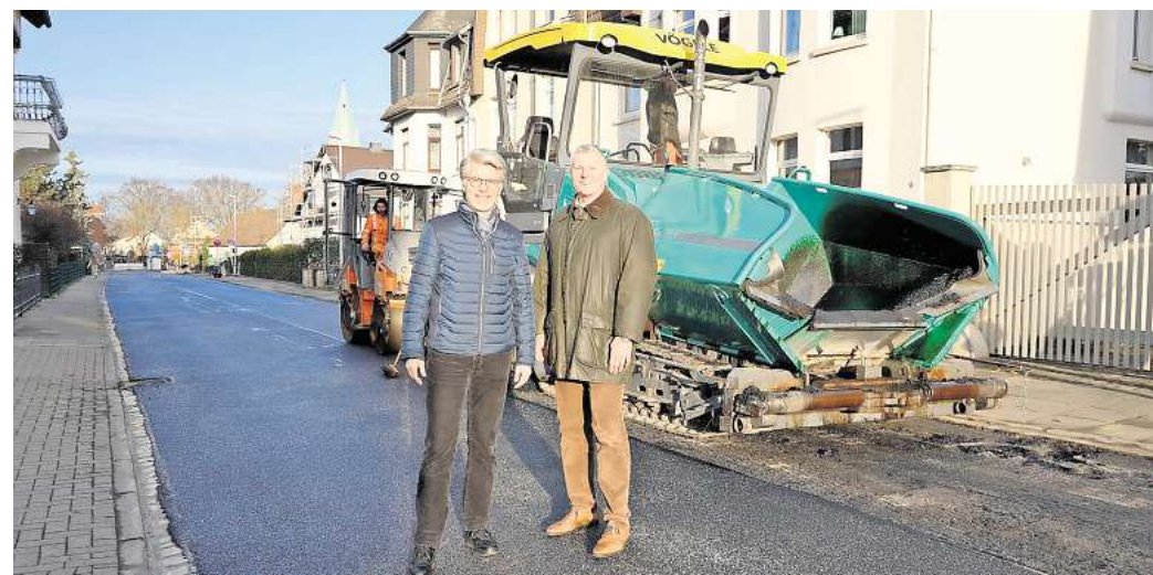
Auftakt eines umfangreichen Straßensanierungsprogramms: Beschäftigte eines von der Stadt Seelze beauftragten Fachbetriebs fräsen die alte Fahrbahndecke der Bonhoefferstraße ab.

„Die Verdopplung der Mittel zeigt, dass wir den Abbau des Sanierungsstaus ausdrücklich priorisieren und nicht länger aufschieben“, hebt der Bürgermeister hervor. „Diese Investitionen