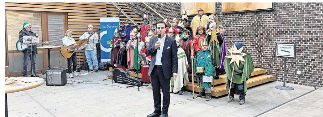
Nachdem die Sternsinger in den vergangenen Tagen bereits Kindertagesstätten und Pflegeheime besucht haben, überbrachten sie am Dienstag den traditionellen Segen den Mitarbeitenden im Rathaus.