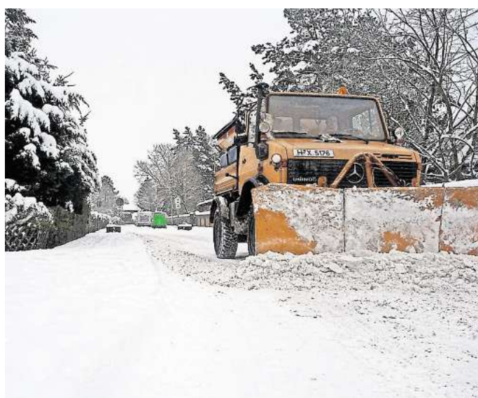
Für den Winterdienst müssen die Seelzer 2026 weniger bezahlen.

SEELZE. In Zeiten allgemeiner Teuerung kommt es nicht überraschend, dass auch die Stadt Seelze einige Gebühren anpasst. Künftig müssen die Bürger für die zentrale Entsorgung der Abwässer deutlich tiefer in die Tasche greifen. Bei der Straßenreinigung wird es bei einem Posten allerdings günstiger. Das Jahr 2026 wird für die Bürger Seelzes mit einem Ärgernis beginnen. Die Abwasserentsorgung wird teurer, und die Begleichung dieser gestiegenen Kosten wird auf die Gebühren umgelegt. Was ist Abwasser? Das sogenannte Abwasser teilt sich auf in Schmutzwasser und Regenwasser. Beide fließen zwar in dieselbe Kläranlage. In der Gebührenordnung ist allerdings zu sehen, dass die Entsorgung von Schmutzwasser deutlich teurer ist als die von Regenwasser und entsprechend den Gebührenzahler auch mehr kostet. Schmutzwasser enthält Fäkalien und Chemikalien, nicht selten auch feste Stoffe. Es muss aufwendiger in der Kläranlage aufbereitet werden, bevor es dem Wasserkreislauf wieder zugeführt werden kann. Seine Reinigung ist energie- und kostenintensiver als die von Regenwasser. Die Gebührenhöhe für den Einzelnen richtet sich nach dem tatsächlichen Wasserverbrauch. Regenwasser ist deutlich sauberer als Schmutzwasser – auch, wenn es durch Straßen