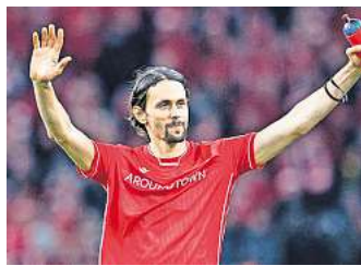
Im Union-Trikot: Neven Subotic wurde nicht nur in Dortmund, sondern auch in Berlin von den Fans gefeiert.

Er ist Deutscher Meister, Champions-League-Finalist, Stif-tungsgründer und eine der markantesten Persönlichkeiten des deutschen Fußballs: Neven Subotic. Am 21. Januar kommt er zum NP-Anstoß und spricht über seine Karriere auf dem Platz, seinen persönlichen Weg nach dem Profifußball und sein soziales Engagement. Seine Geschichte ist außergewöhnlich. Trotz einer von Flucht und Neuanfängen geprägten Kindheit schaffte es Neven Subotic bis in die europäische Spitze des Fußballs: zweifacher Deutscher Meister und Pokalsieger mit Borussia Dortmund, mehr als 200 Bundesliga-Einsätze und Champions-League-Finalist im Londoner Wembleystadion 2013.