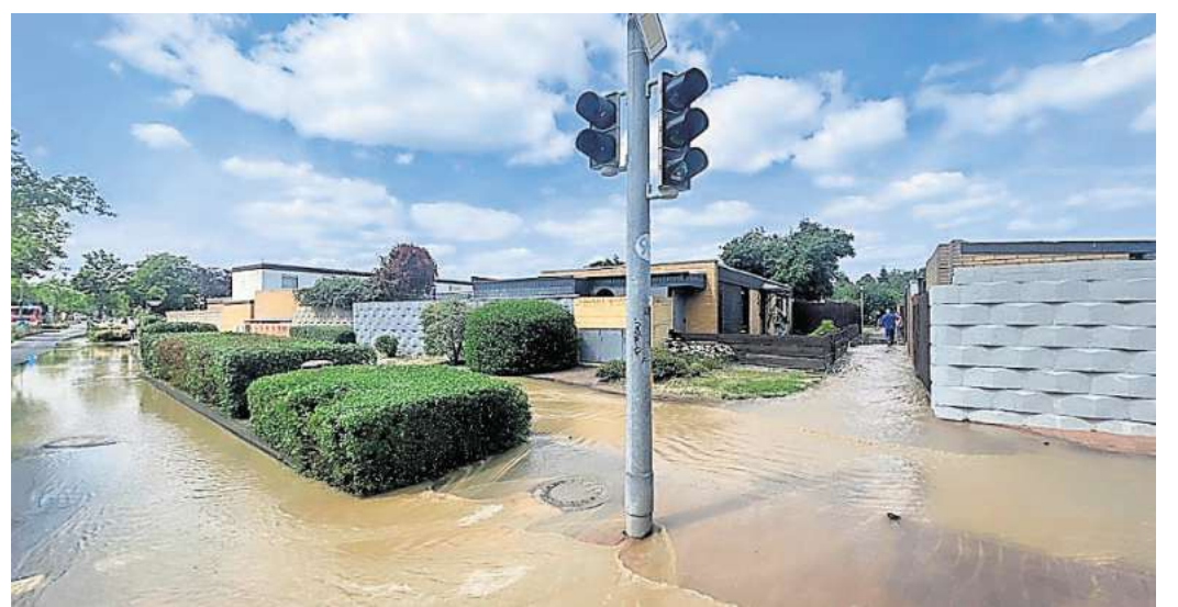
Rohrbruch: Das Wasser hat sich auf dem Planetenring in Garbsen ausgebreitet.

Weil er wegen einer Krankheit schuldunfähig ist, wird er auf unbestimmte Zeit zur Behandlung in der Psychiatrie untergebracht. Letzter Supermarkt schließt Im Mai war die Situation der Nahversorgung im Stadtteil Schloß Ricklingen ein entscheidendes Thema. Auslöser war die Ankündigung des Betreibers der Filiale von Edeka Kappe, diese Ende des Monats endgültig zu schließen. Er begründete das mit zu hohen Kosten, zu wenigen Kunden und zu hohen anstehenden Investitionen. Für die Schloß Ricklinger war das ein herber Rückschlag, weil sie lange um die Einkaufsmöglichkeit gekämpft hatten – und weil es nun keinen Supermarkt im Dorf mehr gibt. Die gute Nachricht lautet: Das könnte sich in absehbarer Zukunft ändern. Anfang Juni stellten Garbsens Bürgermeister Claudio Provenzano (SPD) und Architekt Jörg Prus-