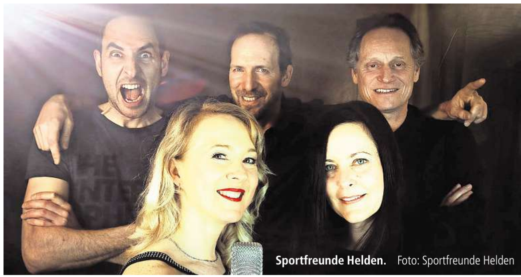
Sportfreunde Helden.

reißende Sounds, restlose Spielfreude und ein Gespür für Stimmung machen ihre Neuvertonung zum wahrscheinlich ausgelassensten Beitrag des Abends.