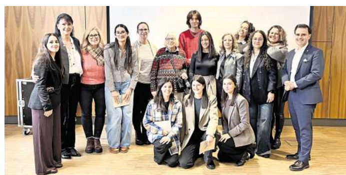
Eingesetzt in Garbsener Kitas: Der erste Jahrgang spanischer Erzieherinnen gemeinsam mit der neuen Teilnehmergruppe.