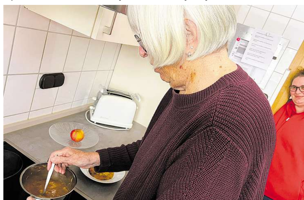
Eigene Gerichte zubereiten und dabei mit der Betreuungskraft klönen.

Wer auf seine Eigenständigkeit Wert legt, ist hier also genau richtig. Um sich selbst einen Eindruck zu verschaffen, kann man unter Telefon: 05131-52989 in der Heinestraße 3 einen Besuchstermin vereinbaren. cha