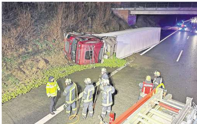
Ein mit Birnen beladener Sattelzug stürzte auf die Seite und kam auf der Autobahn zum Liegen.

Die Feuerwehr leuchtete die Einsatzstelle aus, kontrollierte die Ladung und überprüfte den umgestürzten Lkw auf austretende Betriebsstoffe. Der Einsatz konnte nach rund einer Stunde beendet werden. Die weitere Bergung wurde von einer Fachfirma übernommen.