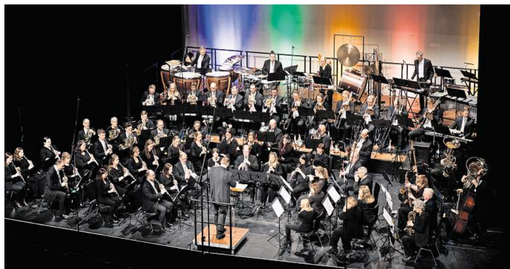
Das Modern Sound[s] Orchestra präsentierte bei seinen Konzerten eine herausragende musikalische Leistung und entließ das Publikum erst nach zwei ebenfalls begeistert aufgenommenen Zugaben von der Bühne.

Den Abschluss bildete ein Musical-Medley, das große Klassiker von der „West Side Story“ bis zur „Rocky Horror Show“ klangvoll vereinte. Ein fulminantes Finale, das auch den Musikern lange in Erinnerung bleiben wird – schließlich erlebt das Orchester nicht jeden Tag, dass bis zu 900 Menschen im Saal begeistert den „Time Warp“ singen und tanzen.