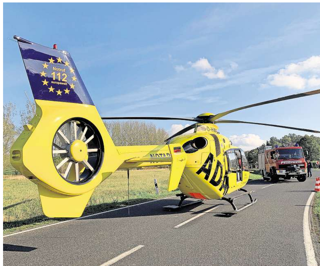
Christoph 30: Schnelle Hilfe aus der Luft in akutmedizinischen Notfällen: Der Einsatzradius von „Christoph 30“ ist 50 bis 70 Kilometer groß und reicht im Norden bis zur Lüneburger Heide (Raum Gifhorn), im Osten in den Raum Helmstedt, im Süden in den Harz und im Westen Hannover.

ber pro Tag im Durchschnitt zu 134 Notfällen alarmiert. Das geht aus der veröffentlichten Jahresbilanz der gemeinnützigen Rettungsdienstorganisation hervor. Darunter waren 3314 Flüge in der Dunkelheit, fünf Prozent mehr als im Vorjahr. Ebenfalls um fünf Prozent auf 580 erhöhte sich die Zahl der hochanspruchsvollen Spezial-einsätze mit Rettungswinde. Unfälle die häufigste Ursache der Luftrettung Häufigste Einsatzgründe waren in fast jedem dritten Fall (31 Prozent) Verletzungen nach Unfällen. Dazu gehören Freizeit-, Sport-, Arbeits-, Schul- und Verkehrsunfälle. Bei etwa jeder vierten Alarmierung (26 Prozent) lagen Notfälle des Herz-Kreislauf-Systems wie Herzinfarkte und Herzrhythmusstörungen vor. In 13 Prozent der Fälle diagnostizierten die ADAC Luftretter neurologische Notfälle wie zum Beispiel einen Schlaganfall, in acht Prozent war akute Atemnot oder Asthma die Ursache. Bei fast jedem zehnten Patienten handelte es sich um Kinder oder Jugendliche. Über die ADAC Luftrettung gGmbH Mit 60 Rettungshubschraubern und 37 Stationen ist die gemeinnützige ADAC Luftrettung eine der größten Luftrettungsorganisationen Europas mit bis heute mehr als 1,3 Millionen Einsätzen. Die ADAC Rettungshubschrauber gehören zum deutschen Rettungsdienstsystem, werden immer über die Notruf-