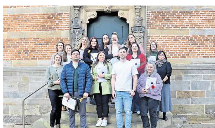
Im März 2026 haben 14 Absolventinnen und Absolventen erfolgreich die vhsConcept-Weiterbildung „Fachwirtin und Fachwirt für Kindertageseinrichtungen“ abgeschlossen.

Die Weiterqualifizierung richtet sich an Interessierte, die eine Leitungstätigkeit im Berufsfeld frühkindlicher Bildung, Erziehung und Betreuung anstreben oder ihre Leitungstätigkeit reflektieren und verändern oder neu ausrichten wollen. An der Qualifizierung können Personen mit einer einschlägigen pädagogischen Ausbildung teilnehmen.