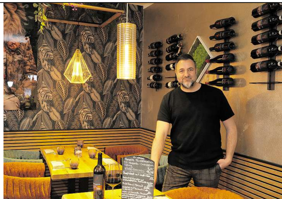
Okay Bilgi liebt das Besondere.

auch in digitaler Form bereit und baut damit die transparente Darstellung der städtischen Finanzen weiter aus. Eine Anmeldung für den Zugriff auf die Daten ist nicht erforderlich.