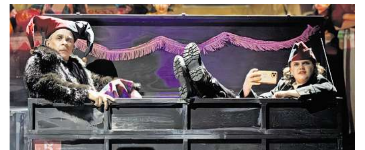
Das Theater für Niedersachsen verspricht mit „Till Eulenspiegel“ ein kritisches und intensives Theatererlebnis voller Witz und Schabernack.

Als unsterbliches Duo mit seiner treuen Begleiterin Ule reist Till durchs Land und durch die Zeit. Vom späten Mittelalter über die Bauernkriege hin zur Weimarer Klassik und in die Gegenwart mischen sich die beiden in historische Ereignisse ein. Auf dem wilden Ritt durch die Epochen verschmelzen Realität und Fantasie – mal seiltanzend übermütig, mal derb und dreist. Voller Spielfreude und ohne Hemmungen wechseln die Schauspielerinnen und Schauspieler mehrfach ihre Rollen, denn Till und Ule haben viele Gesichter und wissen ihr Publikum zu unterhalten. Immer mit dabei ist Muli, der live auf der Bühne Soundcol-