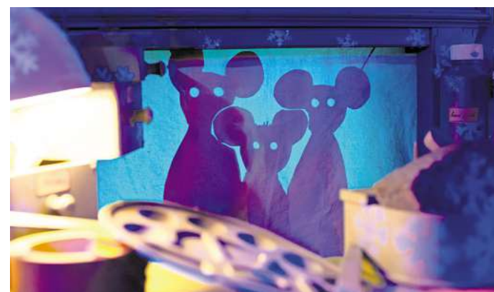
Die Geschichte von Frederick am 9. April in der Osterbergschule soll Kinder ermutigen, mit ihren unterschiedlichen Fähigkeiten und Talenten ihren eigenen Weg zu gehen und ihre einzigartigen Eigenschaften zu schätzen.

Die Vorstellung um 10.30 Uhr ist bereits ausgebucht.