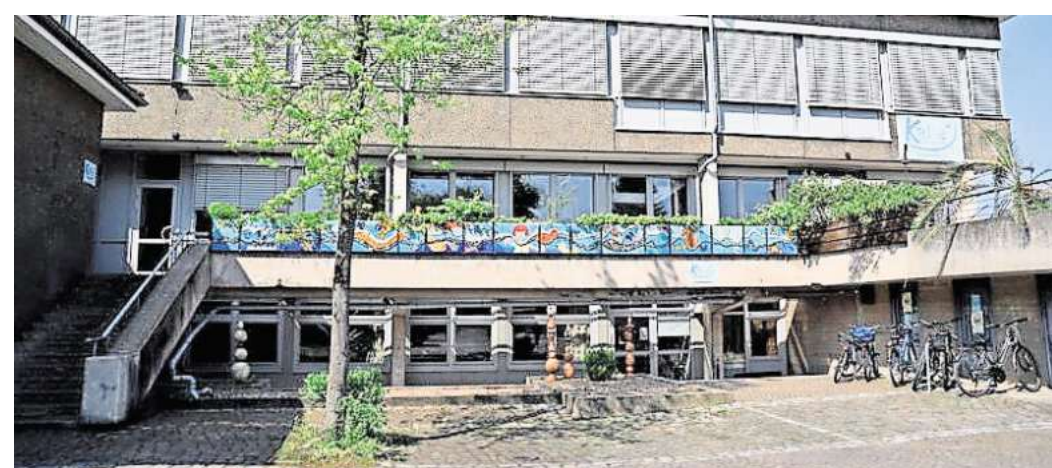
Von April bis Juni erwartet Interessierte im Kulturhaus Kalle eine breite Auswahl an Konzerten, Vorträgen, Kursen sowie künstlerischen und kulturellen Veranstaltungen, die zum Entdecken, Mitmachen und Genießen einladen.