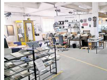
Besonders die Telex-Abteilung mit ihren zahlreichen funktionsfähigen und miteinander verbundenen Fernschreibern erfreut sich großer Beliebtheit.

Unter Telefon (05131) 707170 ist eine Anmeldung für Bilderbuchkino, Kamishibai und Basteln möglich.