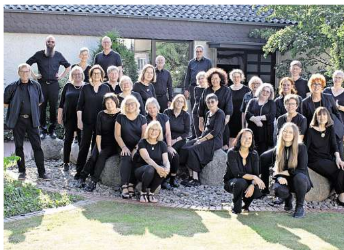
Der Kammerchor Schloß Ricklingen freut sich darauf, das neue Programm „Licht und Stille“ aufzuführen.

wie auch die Tage und Nächte in den nordischen Breitengraden etwas ganz Besonderes sein können: „Weiße Nächte“, in denen die Sonne nicht oder nur für kurze Zeit untergeht, oder Polarnächte, die auch den Tag in Dunkelheit hüllen. Hinzukommen Polarlichter, die den Nachthimmel in ein mystisches Spektakel verwandeln.