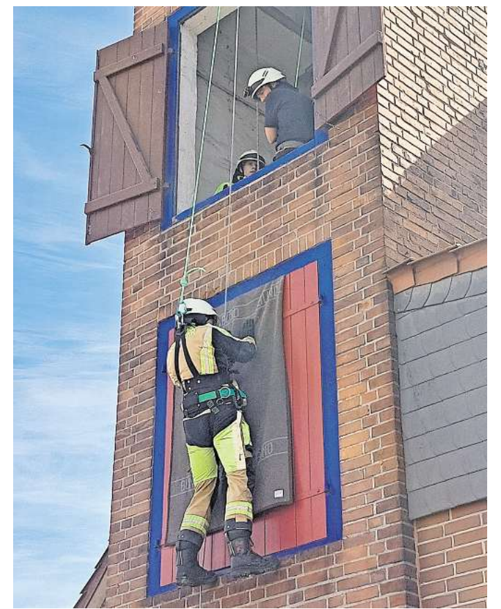
Schon traditionell ist das Selbstretten an der dritten Station, dem alten Schlauchturm des Feuerwehrhauses in Lohnde. Hierbei müssen sich die Teilnehmer aus einer Höhe von zirka 8 Metern vom Turm abseilen. Dabei wurden sie von erfahrenen Ausbildern gesichert. Diese Übung wird auf freiwilliger Basis angeboten.

Auf dem Schulhof der Grundschule lernten die Teilnehmer dabei den Umgang mit den verschiedenen, auf den Löschfahrzeugen geladenen Werkzeugen und ihre Einsatzmöglichkeiten. Auch die