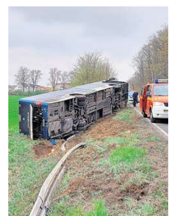
Glück hatte der Fahrer des Linienbusses, er blieb bei dem Unfall unverletzt.

Eine Überprüfung durch die Einsatzkräfte der Feuerwehr ergab, dass keine Betriebsstoffe ausgetreten waren, sodass diese wieder einrücken konnte. Die Ursache ist derzeit unbekannt, die Polizei hat die Ermittlung zum Hergang aufgenommen.