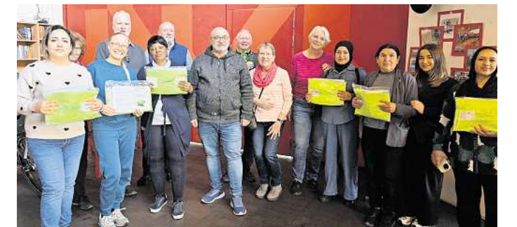
Das Foto zeigt die Teilnehmerinnen mit ihren Urkunden, Warnwesten und gespendeten Helmen gemeinsam mit den ehrenamtlichen Unterstützerinnen und Unterstützern.