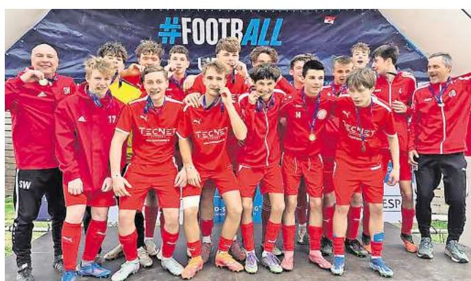
An der Costa Brava wuchs das Team noch enger zusammen – eine Erfahrung, die weit über den sportlichen Erfolg hinausgeht.

und England – traten gegeneinander an. Sportlich zeigte die Mannschaft eine starke Leistung. In der Vorrunde musste sie sich lediglich einmal geschlagen geben und belegte einen guten zweiten Platz in ihrer Gruppe. In den anschließenden Spielen blieb das Team ungeschlagen und überzeugte durch großen Einsatz, starken Teamgeist und ein sehenswertes Zusammenspiel. Die mitgereisten Fans erlebten spannende Spiele, schöne Tore und ein besonders nervenaufreibendes Elfmeterschießen. Neben dem