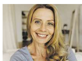
– Judith F. –

Auch ein deutsches Forscherteam hat sich umfassend mit den vielfältigen Cannabissorten und Extraktionsverfahren beschäftigt. Dabei ist den Wissenschaftlern ein Mega-Erfolg gelungen: Mittels eines speziellen CO 2 -Verfahrens konnten sie aus der besonderen Cannabissorte