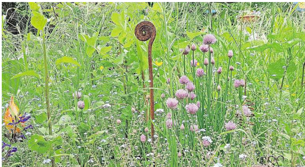
Vielfältig und insektenfreundlich: Die Stadt Seelze ruft zum zweiten Mal zur Teilnahme an einem Wettbewerb für naturnahe Gärten und Balkone auf. Die Gewinnerinnen und Gewinner erhalten ein Preisgeld.

Der Wettbewerb stellt erneut die Menschen in den Mittelpunkt, die ihre Gärten und Balkone bereits naturnah gestalten und damit einen Beitrag zur Biodiversität und zum Klimaschutz leisten. Gleichzeitig soll der Wettbewerb weitere Bürgerinnen und Bürger für eine naturnahe Gestaltung ihrer Flächen sensibilisieren und ermutigen.