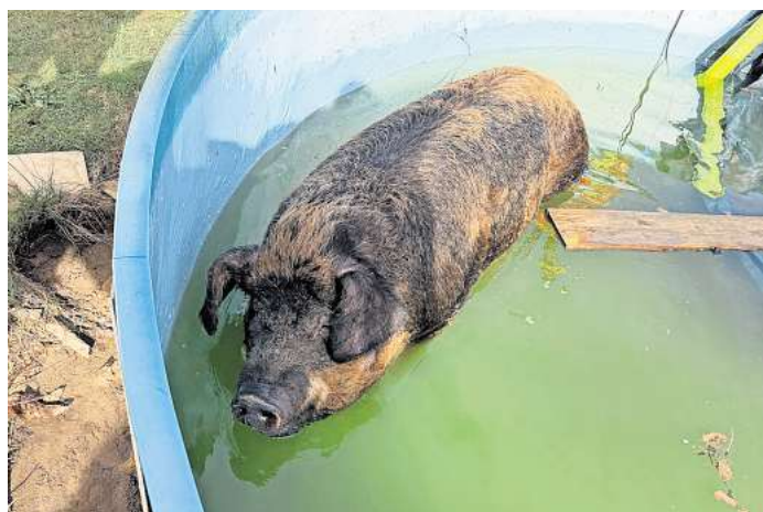
Der Feuerwehr Garbsen gelang es, dieses 300 Kilogramm schwere Schwein aus einem Gartenpool zu retten.

Nach einigen Minuten und unter sanfter Führung der Feuerwehr gelang es dem Schwein schließlich, die improvisierte Treppe hinaufzusteigen und den Pool unverletzt zu verlassen. Der Besitzer zeigte sich erleichtert und dankbar über die schnelle und einfallsreiche Hilfe.